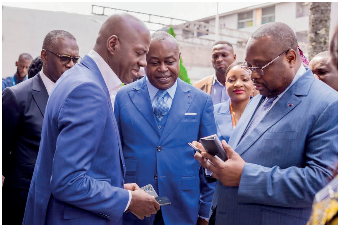
Les officiels effectuant des tests d'appels afin de vérifier la qualité du réseau/DR

Les tests des appels avec MTN et Airtel qui se sont révélés concluants marquent ainsi le lancement du réseau de téléphonie mobile de l'opérateur national Congo Télécom. Page 4