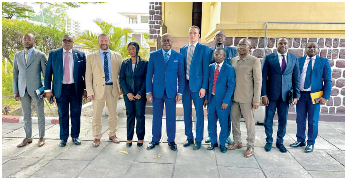
Les deux parties posant après les échanges

Satisfait des différentes discussions avec le ministre en charge de l'Economie numé-