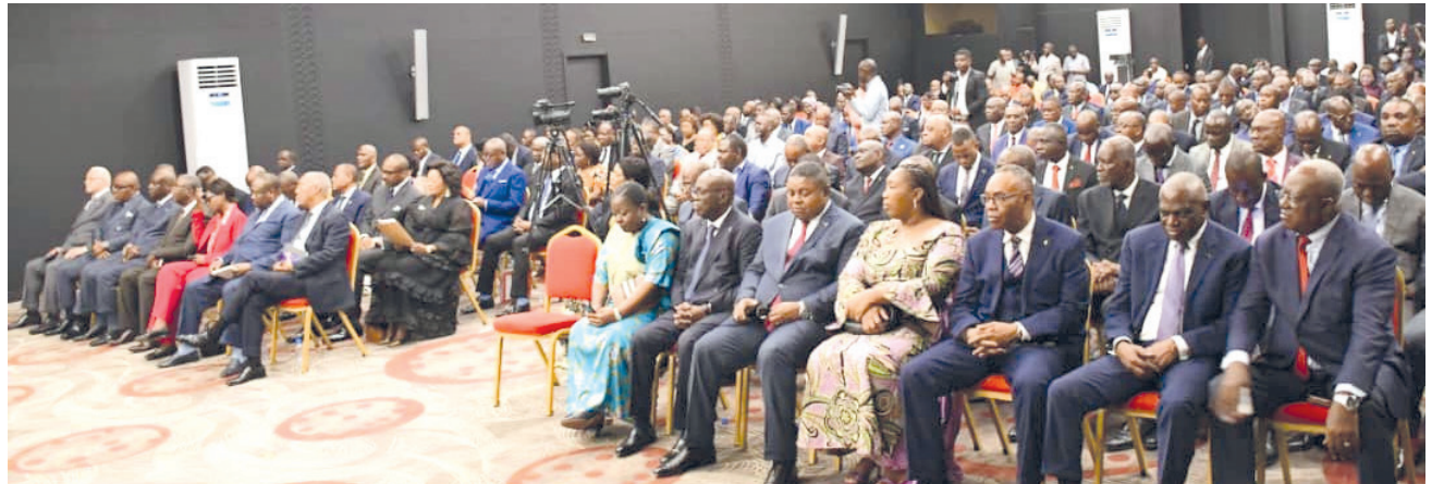
Une vue des parlementaires de la majorité présidentielle

Le Premier ministre, Anatole Collinet Makosso, a échangé le 23 décembre à Brazzaville avec la majorité parlementaire, dans le but de consolider davantage l'approche managériale, collégiale et consensuelle pour répondre au mieux aux aspirations profondes des populations, à travers une gouvernance participative renforcée.