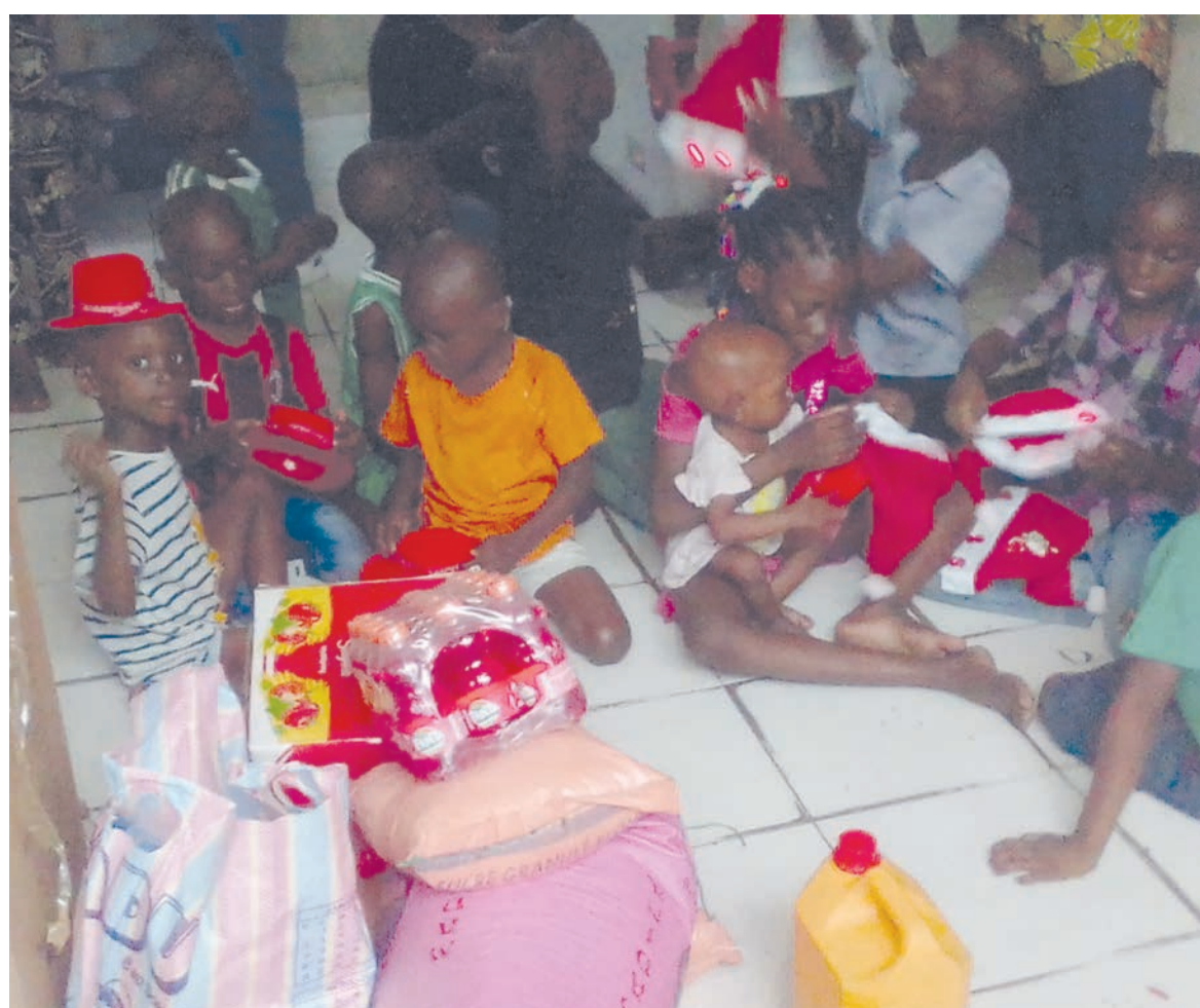
Des vivres remis à l'orphelinat Bon berger

Le don et le spectacle organisé sont des initiatives qui témoignent l'engagement des deux associations à œuvrer en faveur de la communauté, et leur volonté d'apporter du réconfort ainsi que du bonheur à