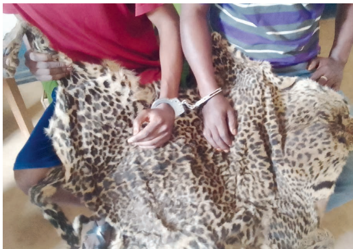
Des trafiquants de peau de panthère

Interpelés conjointement par les agents de la direction départementale de l'Economie forestière en collaboration avec les agents de la section de recherche judiciaire de la région de gendarmerie avec l'appui technique du projet d'appui à l'application de la loi sur la faune sauvage, ces délinquants fauniques ont été reconnus coupables des délits d'abattage d'une pan-