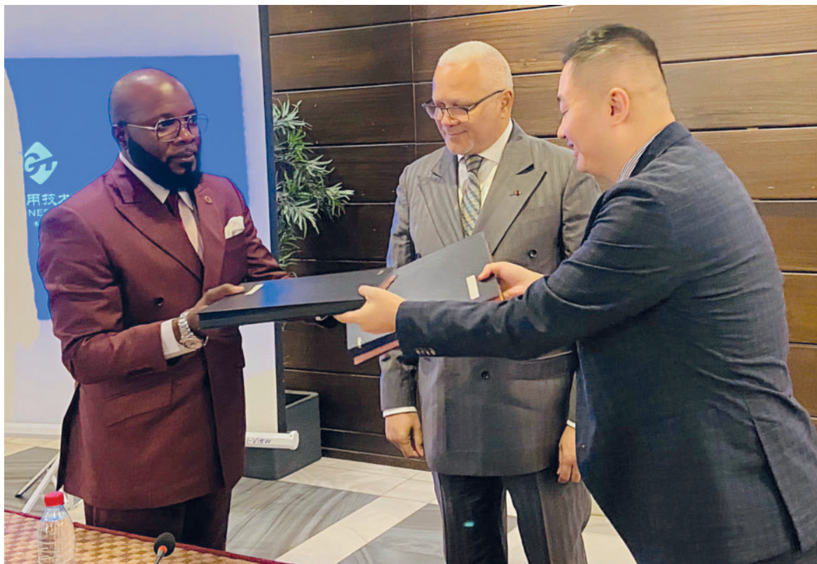
Echange des parapheurs entre les deux parties

« Ignié 2021-2046 » est l'un des projets pionniers du développement des ZES d'Igné. Né sous l'impulsion du projet du boulevard énergétique lancé en 2009 par le chef de l'Etat, il a pour finalité la résolution du problème de la dépendance énergétique au Congo. Bénéficiant de l'appui du gouvernement, ce projet est passé par plusieurs phases, à sa-