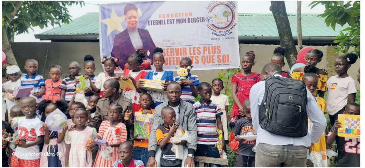
Distribution de la nourriture et des cadeaux aux orphelins

Dans sa prise de parole, le coordinateur de la Fondation a fait appel à toutes les personnes éprises de bonne foi pour participer volontairement à cette oeuvre noble. Après IDV, la délégation de la FEMB s'est rendue