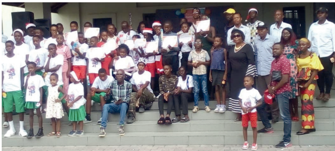
Des participants à la fin de l'activité

Pour cette première édition, les enfants d'Actions de solidarité internationale (ASI), de la Fondation Engobo-Descalzi, du Centre d'accueil des mineurs (CAM) de Mvou Mvou ont pris part aux concours de dessin et de chant. Le Samu Social et l'orphelinat Coeur de