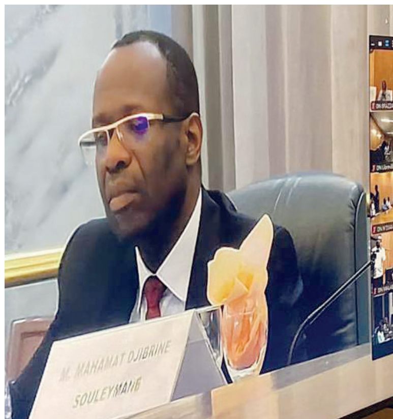
Yvon Sana Bangui présidant la réunion par visioconférence

D'après le gouverneur de la BEAC, outre la consolidation de la croissance économique, le CPM a relevé, entre autres, une atténuation des tensions inflationnistes à 4,4 % en moyenne annuelle, contre 5,6 % en 2023 ; une amélioration de la