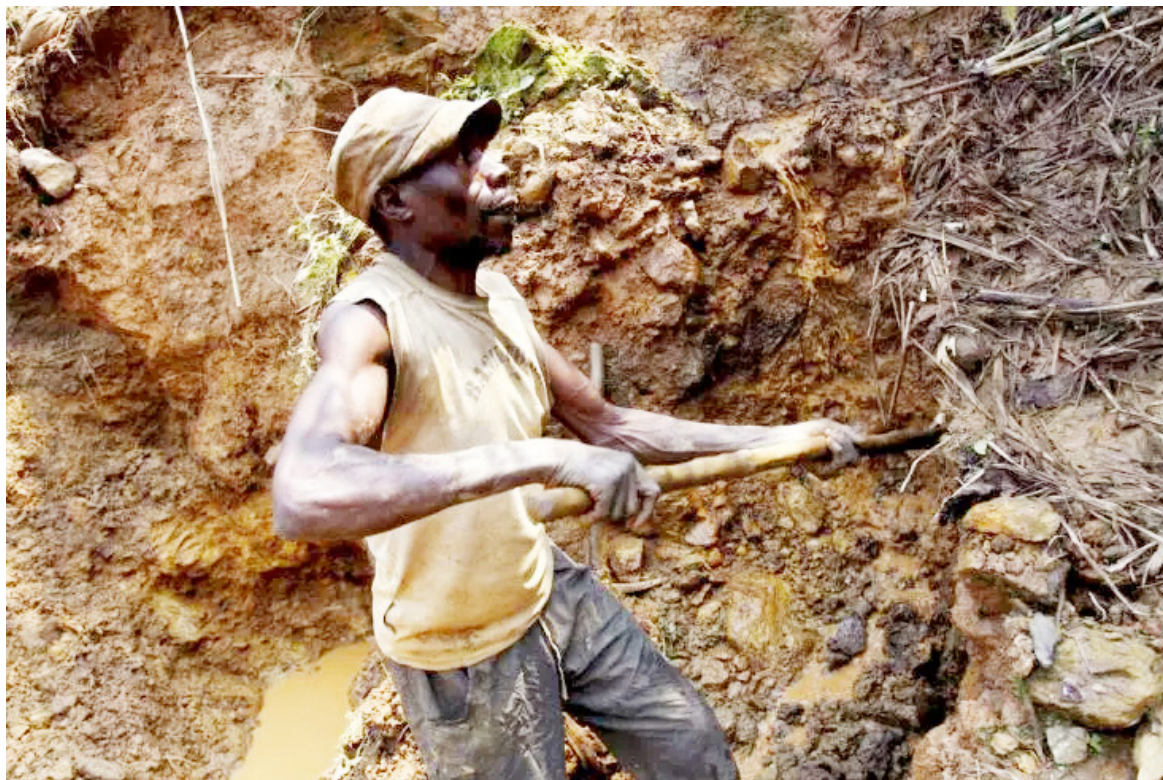
Un mineur congolais extrait de la cassitérite, le principal minéral d'étain, à la mine de Nyabibwe, dans l'est de la République démocratique du Congo, le 17 août 2012.

Apple est accusée d'utiliser des minerais pillés en RDC et blanchis via des chaînes d'approvisionnement internationales. Les