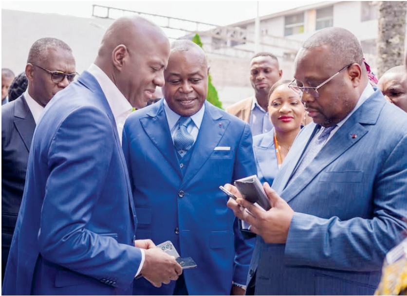
Les officiels effectuant des tests d'appels afin de vérifier la qualité du réseau

L'annonce a été faite à la suite de la visite effectuée par le ministre d'État chargé de l'Aménagement du territoire, des Infrastructures et des Travaux publics, Jean-Jacques Bouya, sur différents sites, notamment le site du Projet de couverture nationale (PCN) et ceux abritant des infrastructures clés indispensables au déploiement du réseau de Congo Télécom. En effet, cette visite a permis, entre autres, d'évaluer l'état d'avancement de la phase 3 du PCN. Pour ce faire, des tests d'appels téléphoniques ont été effectués, confirmant la qualité et la fiabilité des installa-