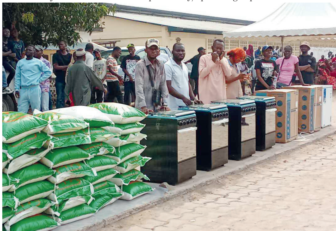
Les heureux bénéficiaires