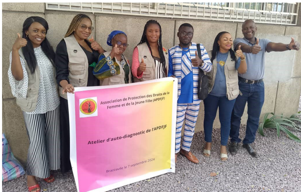
Les membres de l'association