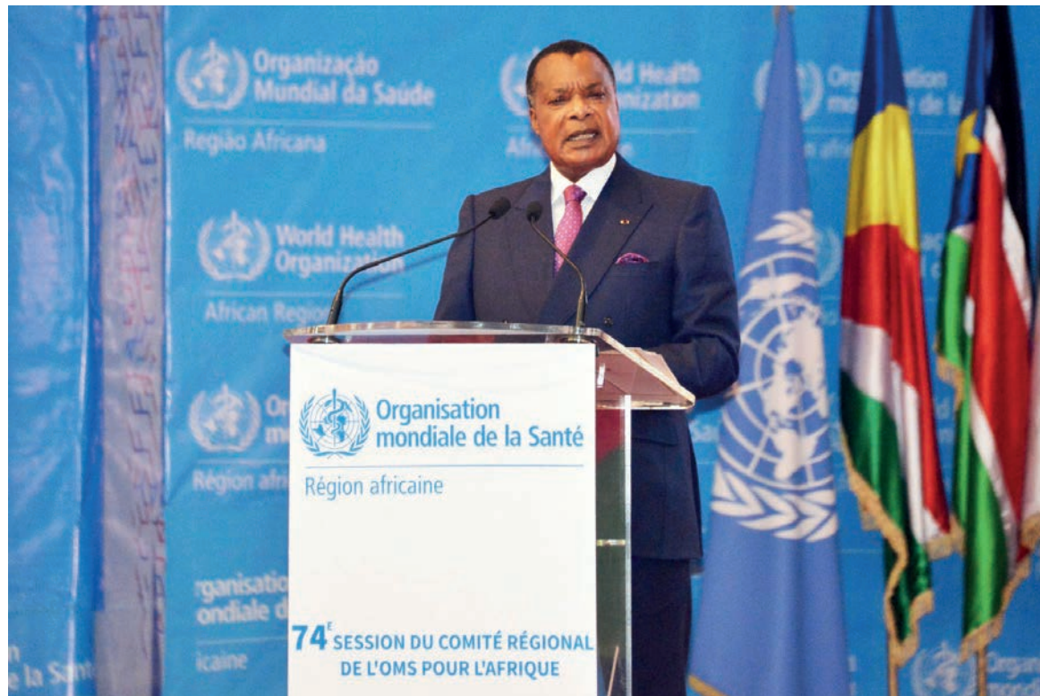
Le président de la République ouvrant les travaux de la 74 e session de l'OMS-DR

Souhaitant la bienvenue à près de mille participants à cette 74 e session du Comité régional de l'OMS-Afrique, le