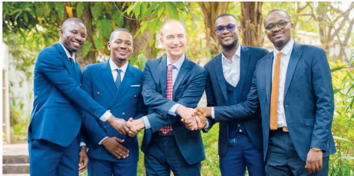
Quatre des cinq boursiers congolais posant avec l'ambassadeur

Pour montrer que l'apprentissage se passe bien, l'entretien entre l'ambassadeur et les cinq boursiers s'est tenu exclusivement dans la langue allemande. Cela a permis aux élèves-professeurs de prouver leurs compétences linguistiques acquises au cours des deux premières années. En effet, l'année qui vient de passer s'est révélée pour eux couronnée de succès. D'une part, ils ont participé brillamment aux examens de langue au Goethe-institut Kamerun en obtenant le certificat de langue du niveau B2, un diplôme qui les classe dans la catégorie des apprenants avancés faisant un usage indépendant de la langue allemande en situation de communication. Et, d'autre part, les boursiers ont souligné leur passage en troisième année comme un événement important, marquant une fois de plus le succès