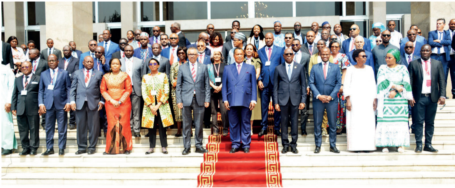
Le président de la République et les participants à la 74 e session de l'OMS -Afrique

Le président Denis Sassou N'Gusso a ouvert hier, dans la capitale, les travaux de la 74 e session du Comité régional de l'Organisation mondiale de la santé (OMS) pour l'Afrique qui a pour thème « Un monde mobilisé pour la santé, la santé pour tout le monde ». « Il s'agit de focaliser nos actions sur les problèmes de santé les plus en vue, sous le leadership de l'OMS », a-t-il déclaré après avoir reçu une distinction de l'OMS pour son engagement dans le domaine de la santé. Les travaux de cette session, qui prendront fin le 30 août, déboucheront sur l'élection du nouveau directeur régional de l'OMS pour l'Afrique.