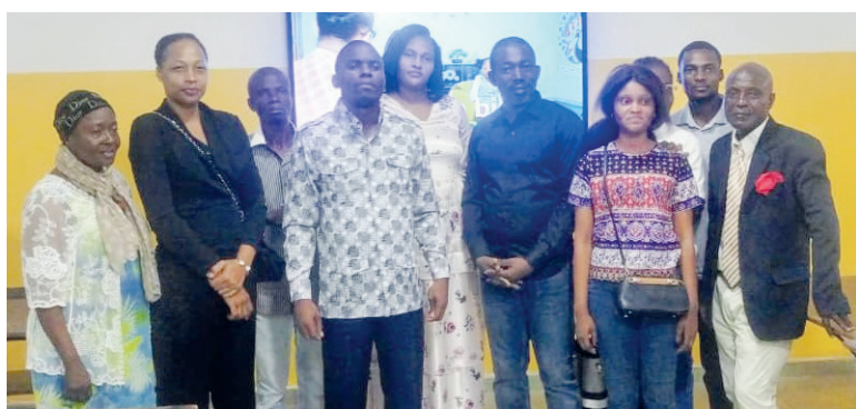
Quelques participants à la masterclass

Prélude à la rentrée scolaire, plusieurs parents d'élèves ont participé, le 23 août, à la journée portes ouvertes organisée au sein du groupe scolaire Paradis Kids. Une session de formation et de partage a permis aux participants de découvrir l'importance d'adapter la formation des élèves à leurs aptitudes et besoins innés.