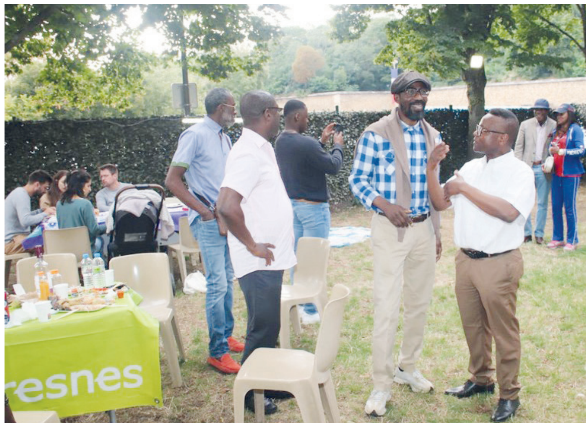
Ambiance détendue à la guinguette africaine de Suresnes 2024

Comme à l'accoutumée, une partie des recettes permettra de