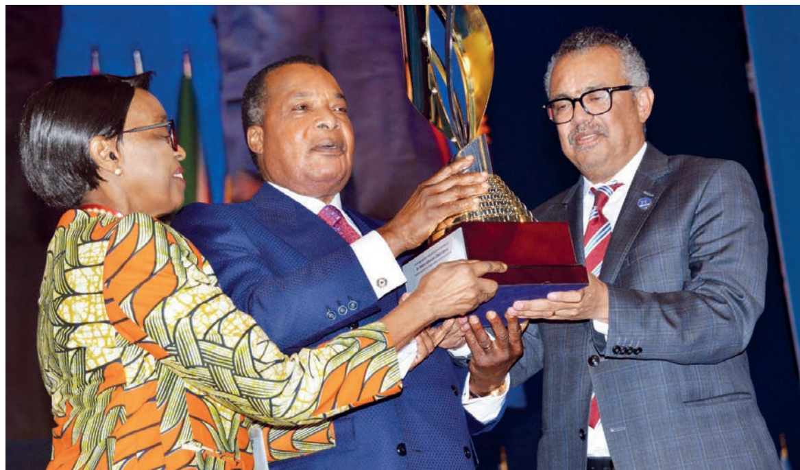
Le président Denis Sassou N'Gusso recevant sa distinction des mains du directeur général de l'OMS et de la directrice régionale

A l'ouverture des travaux de la 74 e session du Comité régional de l'OMS-Afrique le 26 août à Brazzaville, le directeur général de l'OMS, le Dr Tedros Adhanom Ghebreyesus et la directrice régionale, le Dr Matshidiso Moeti, ont remis au président Denis Sassou N'Gusso une distinction pour son engagement en faveur de la santé et ses actions en matière de protection de la biodiversité. « Dans sa contribution notable à la promotion de la santé dans la région d'Afrique en général et au Congo en particulier, le président Denis Sassou N'Gusso a soutenu le travail de l'OMS. Il a été à l'avant-garde des efforts visant à accélérer le progrès vers la couverture sanitaire universelle. Il a volontiers