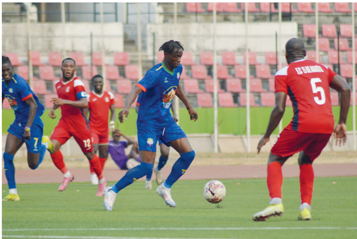
Avec un avantage de deux buts, AS Otohô abordera la manche retour dans de meilleures dispositions

«Effectivement, il y a beaucoup de choses à améliorer. Le plus important est d'abord de gagner. Tous ici