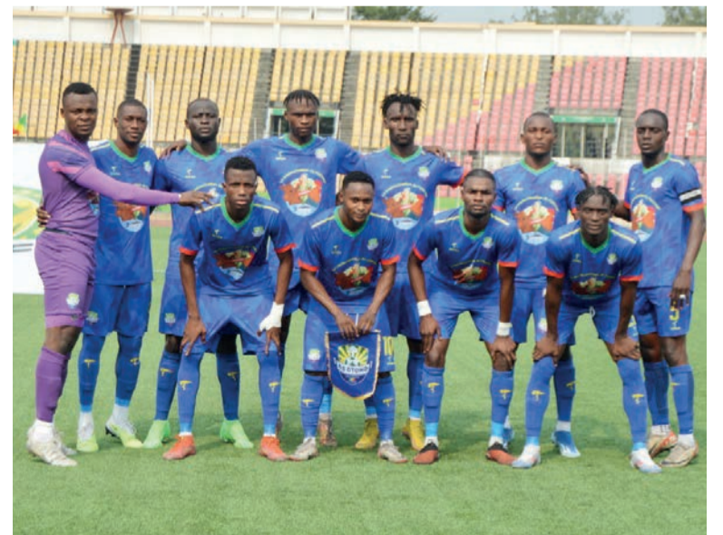
Avec un avantage de deux buts, AS Otohô abordera la manche retour dans de meilleures dispositions Adiac

Le club qui représente le Congo à la Coupe africaine de la Confédération de football s'est imposé 2-0 en match aller du premier tour préliminaire de la compétition face aux Equato-guinéens de 15 de Agosto à Brazzaville. La manche retour se disputera ce 28 août. A défaut d'une victoire, un match nul suffira pour la qualification de l'AS Otohô au deuxième