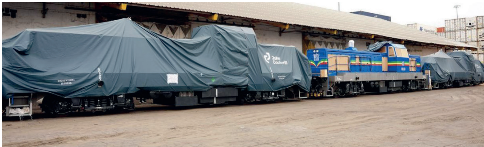
La mise sur rail des locomotives après l'opération de manutention

Le Chemin de fer Congo-océan (CFCO) vient d'acquiescer quatre nouvelles locomotives qui ont été dédouanées, le 22 août, au port autonome de Pointe-Noire, en présence du ministre des Transports, de l'Aviation civile et de la Marine marchande, Honoré Sayi. Dotées chacune d'une puissance de traction de 1200 CV, ces machines importées du royaume de Belgique vont renforcer les capacités opérationnelles du CFCO.