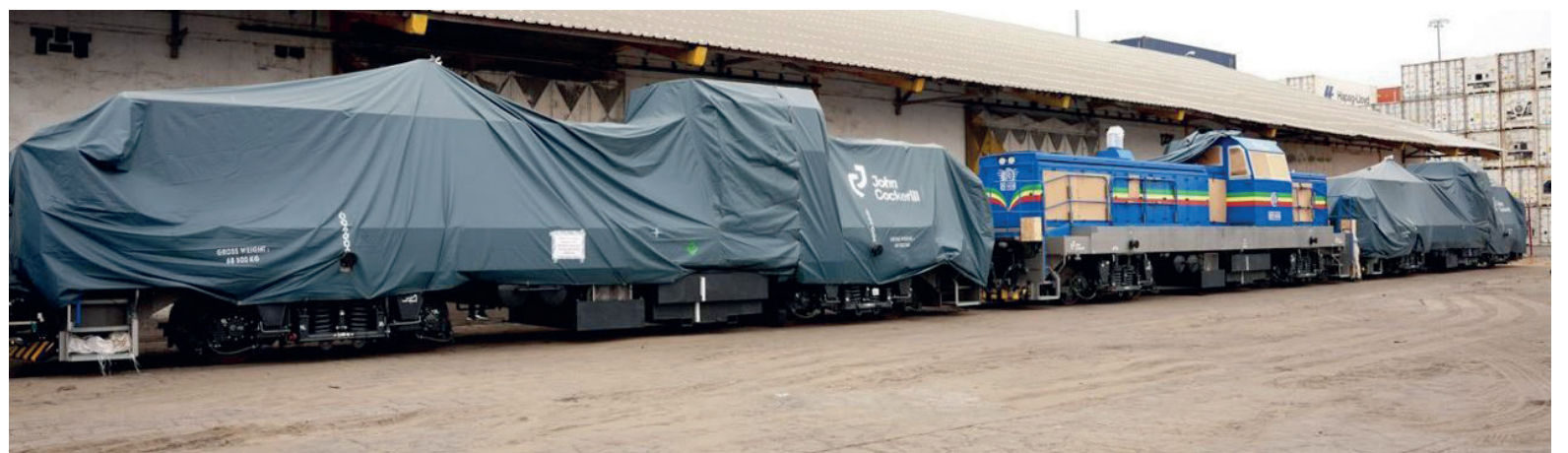
La mise sur rail des locomotives après l'opération de manutention

Les nouvelles locomotives de 68.5 tonnes, 16.9m de long, 2.8m de large et 4.20m de hauteur disposent chacune d'une puissance de traction de 1200 CV. Importées de la Belgique, elles permettent au Chemin de fer Congo-Océan (CFCO) de renforcer sa capacité opérationnelle en matière de transport ferroviaire intra villes des personnes et des biens le long de son réseau de 885 km sur ses trois tronçons, à savoir Pointe-Noire/Brazzaville (512km), Mont-Bello à Mbinda (285km) et le tracé de Bilinga-Dolisie, long de 91km. « Notre ambition est de continuer à investir dans l'acquisition des locomotives pour revaloriser le transport ferroviaire. Ces quatre locomotives viennent accroître notre parc, augmentant ainsi nos capacités », a déclaré Honoré Sayi, ministre des Transports, de l'Aviation civile et de la