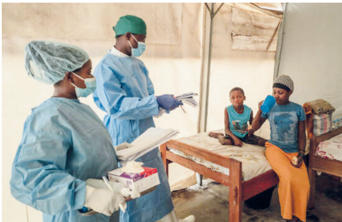
Le centre de traitement de mpxo et d'isolement des malades de l'hôpital général de Nyiragongo, dans le Nord de Goma, dans l'Est de la RDC/DR

En effet, les États-Unis ont promis 50 000 doses, tandis que le Japon a signé avec les autorités congolaises pour 3,5 millions de doses, uniquement pour les enfants. « J'espère que la semaine prochaine, on pourrait déjà voir arriver les vaccins (...) Notre plan stratégique de réponse à la vaccination est déjà prêt, nous attendons juste que les vaccins arrivent », a souligné le ministre. La maladie, a-t-il ajouté, « touche de plus en plus de jeunes. Beaucoup d'enfants de moins de 15 ans sont touchés ». L'épidémie est caractérisée par un virus plus contagieux