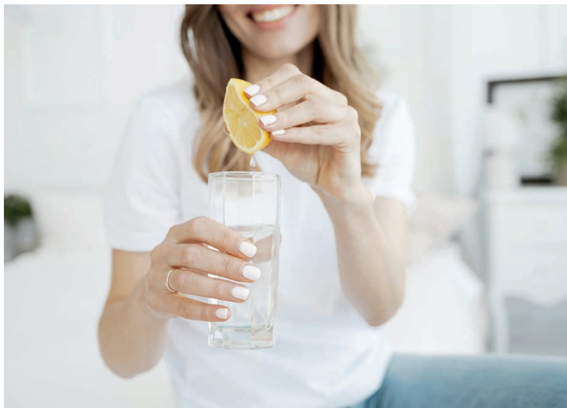
Boire du jus de citron est bon pour la santé

Le citron étant très acide, il peut attaquer l'émail de vos dents. Pour réduire cet effet, préférez boire le jus tiède plutôt que chaud. Vous pouvez aussi boire à la paille (en métal ou en bambou) ou vous rincer la bouche immédiatement après avoir bu.