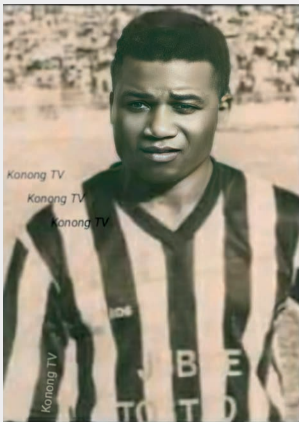
Le légendaire buteur congolais Paul Moukila, Ballon d'or africain en 1974

L'emblématique numéro 10 congolais, sous les