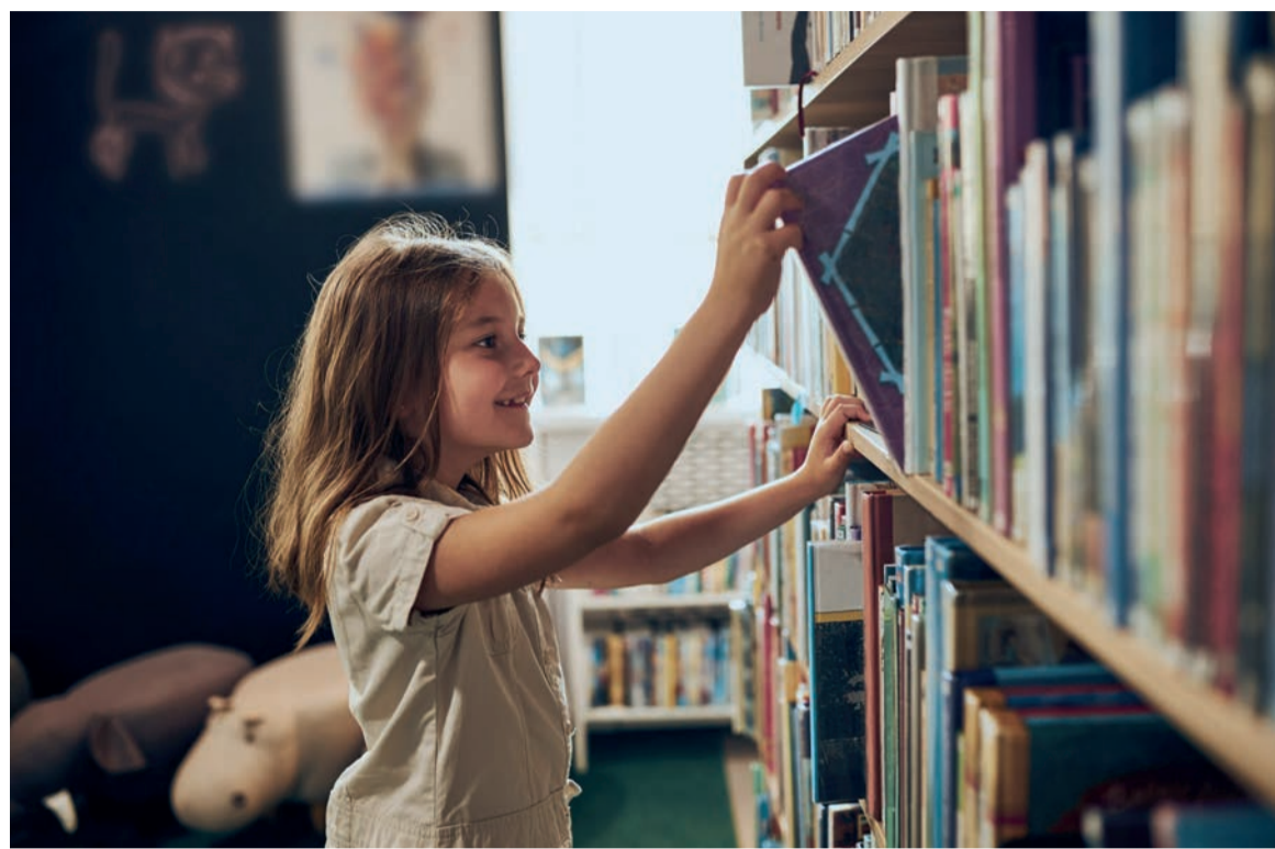
C'est parti pour le «Défi 10 jours sans écran»

Le défi fait écho au récent rapport d'experts remis fin avril à Emmanuel Macron, visant à éva-