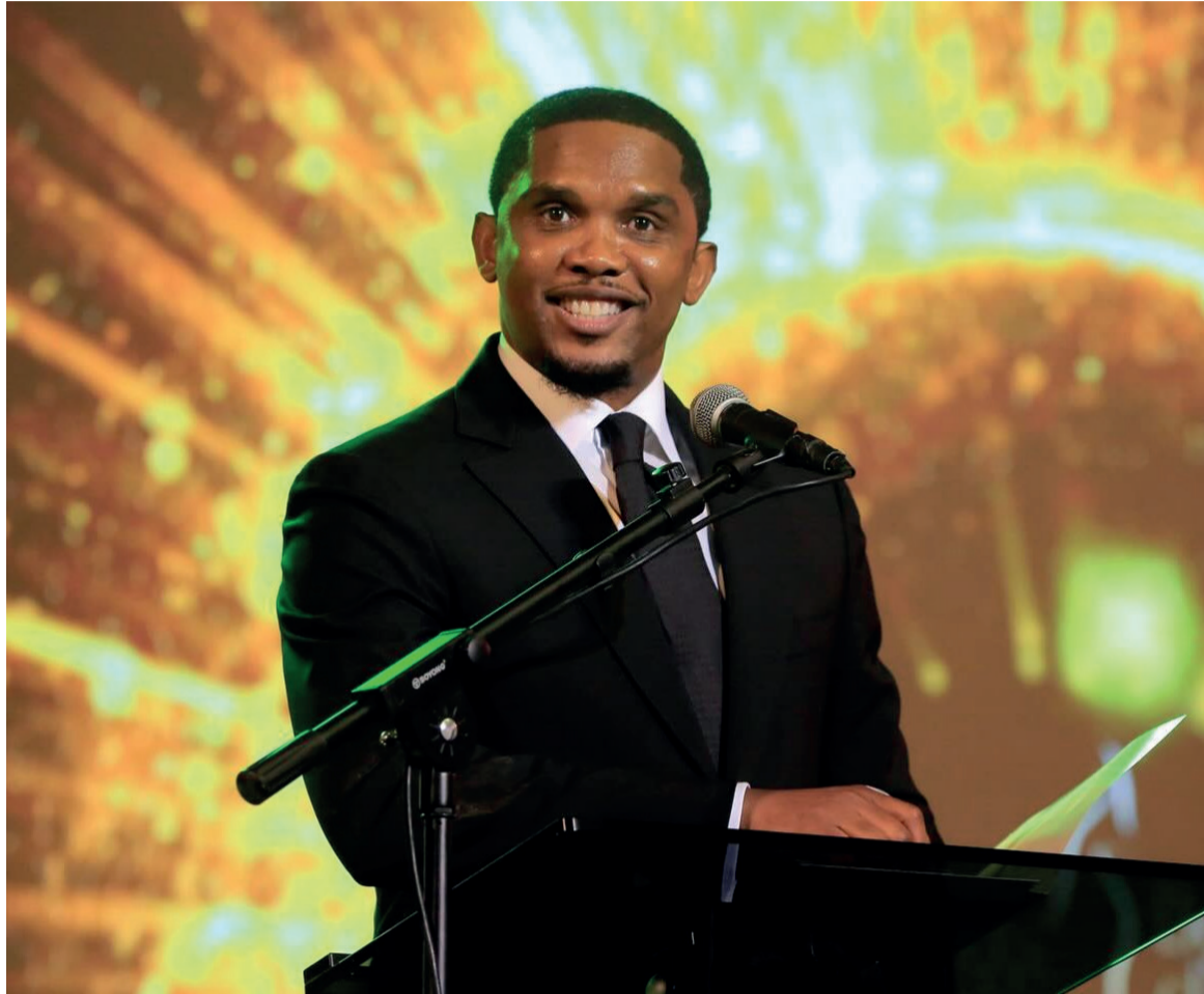
Samuel Eto'o Fils, figure emblématique du football africain et président de la Fédération camerounaise de football

Alors que le jury disciplinaire délibère, une atmosphère de suspense envahit Samuel Eto'o Fils et ses supporters. Chaque instant qui passe semble éternel, chaque fragment d'information pouvant détenir la clé de l'issue de cette affaire conséquente, qui a eu des répercussions dans toute la communauté africaine du football. La fraternité mondiale du football attend avec impatience la résolution de cette saga complexe. Les conséquences pour-