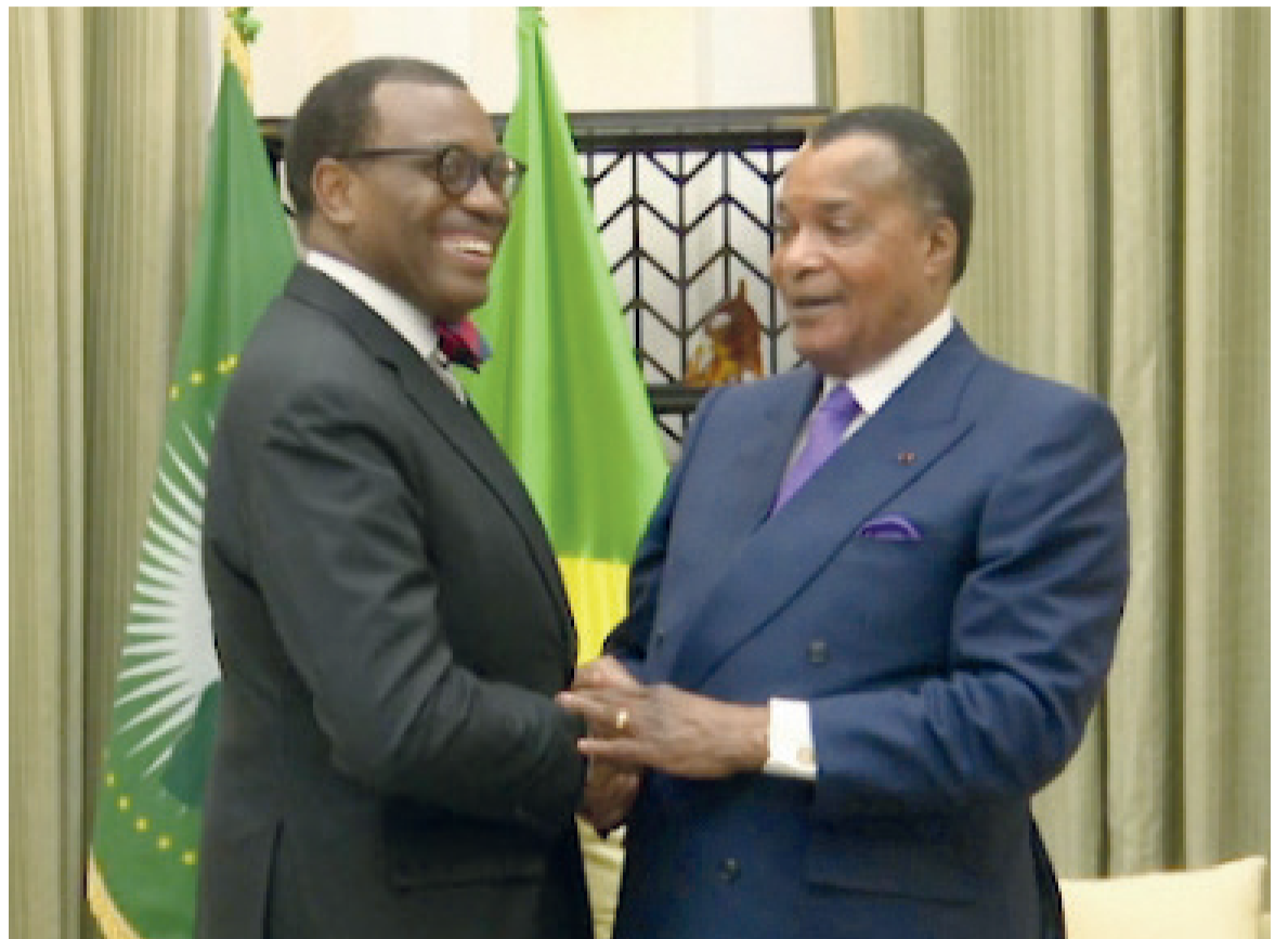
Akinwumi Adesina et Denis Sassou N'Guesso

Outre le corridor Brazzaville-Bangui-N'Djamena, Denis Sassou N'Guesso et Akinwumi Adesina ont aussi évoqué le projet intégrateur pont-route-rail Kinshasa-Brazzaville. Les deux hommes semblent être satisfaits de l'avancement de ce projet qui peine depuis plusieurs années à se concrétiser. À en croire le président de la BAD, les derniers réglages du projet ont été bouclés, sans plus de précision sur la mobilisation des financements,