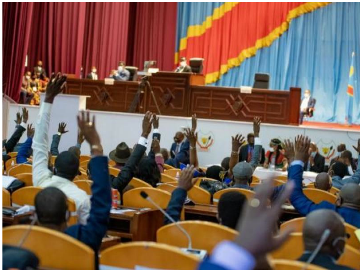
Une séquence des travaux en plénière à l'Assemblée nationale

Réagissant à ce rapport du Crefdl, les services de l'Assemblée nationale ont balayé d'un revers de main toutes ces accusations, arguant que jusqu'à ce jour, aucun grief ni dépense irrégulière n'ont été signalés ni reprochés au bureau sortant. "Loin d'être crédible, ce soi-disant rapport qui n'engage que son auteur est faux sur toute la ligne et prouve que ce dernier ignore tout (...)", peut-on lire dans la mise au point. "Chaque chambre du Parlement jouit d'une autonomie financière et administrative. Mélanger les données comptables, c'est faire de l'amalgame nuisible