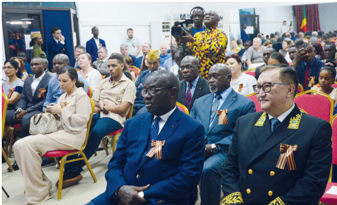
Célébration de la Grande Guerre patriotique à la Maison russe de Brazzaville

Par ailleurs, saluant l'hospitalité congolaise, le