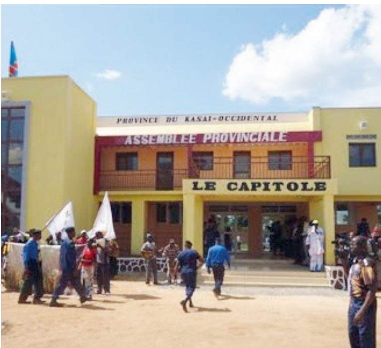
Siège de l'Assemblée provinciale de Kasai centrale