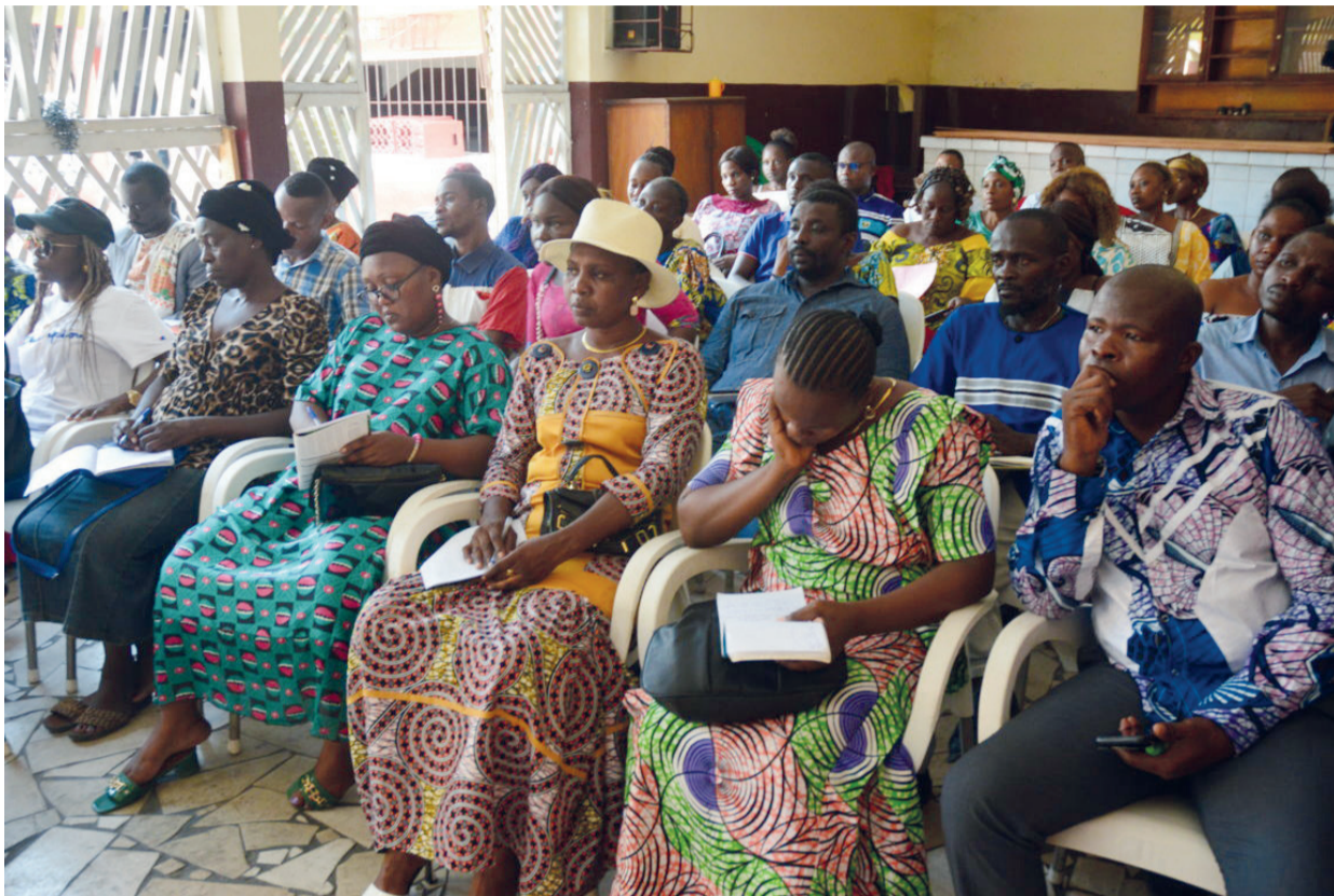
Les membres de l'association en assemblée générale

« Publier les textes d'intégration, campagne de recrutement 2023, dans un délai raisonnable ; régulariser le paiement de bourses des enseignants volontaires et communautaires du ministère de l'Enseignement préscolaire, primaire, secondaire et de l'Alphabétisation ; du ministère de l'Enseignement technique et professionnel », indique la déclaration,