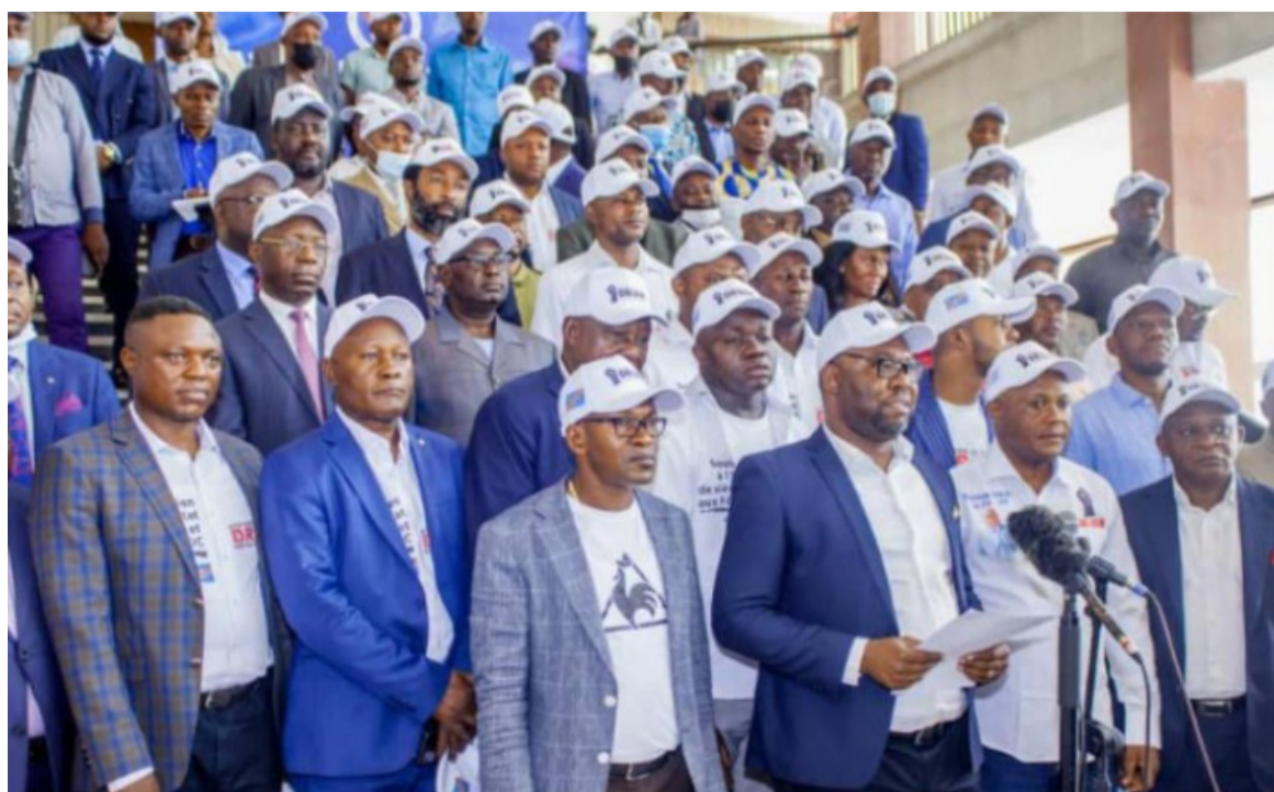
Les cadres d'Ensemble lors d'une manifestation à Kinshasa