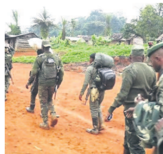
Les FARDC en patrouille dans un village de l'Est du pays