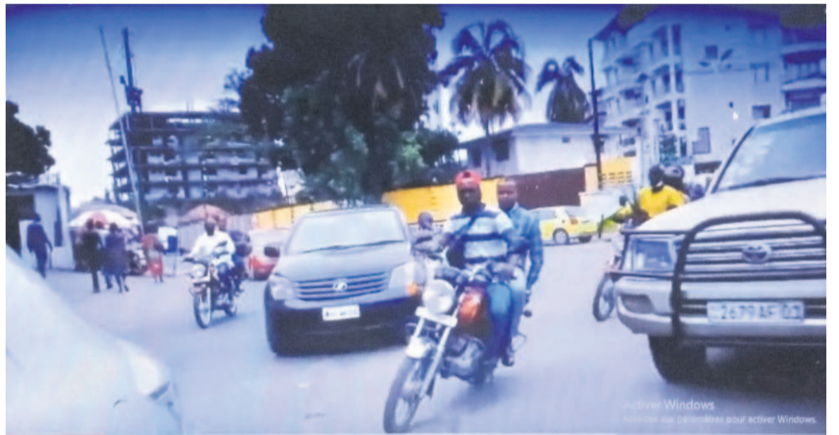
Un extrait de «Molende ya ba Wewa» posté sur YouTube.