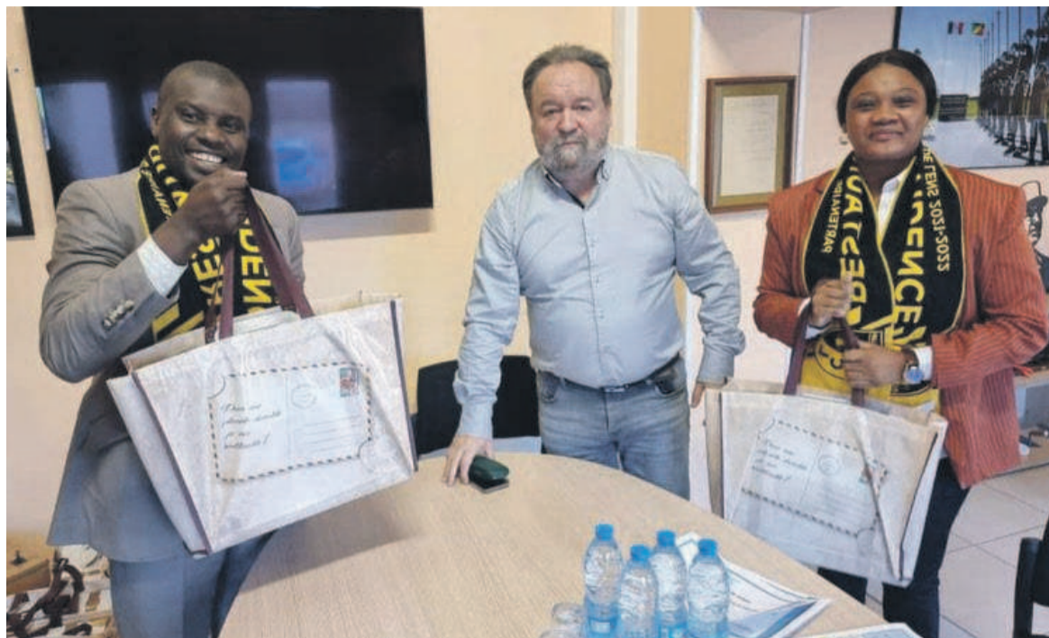
La délégation de la CCJ en France, dernière étape, Verquin, le 7 mars 2022