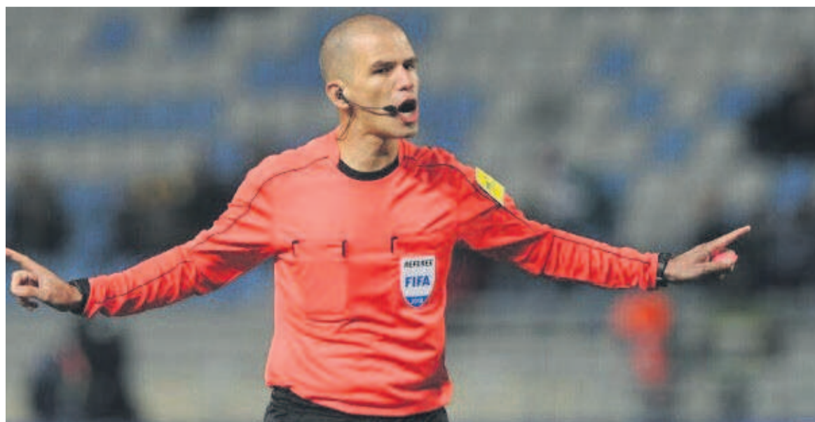
L'arbitre sud-africain Victor Miguel de Freitas Gomes

En 2018, Victor Miguel a été félicité par la Fédération sud-africaine de football après avoir rejeté et signalé une tentative de pot-de-vin de plus de trois cent mille rands (plus ou moins vingt mille dollars américains). Il avait été approché et on lui avait proposé la somme d'argent pour arranger un match de Coupe de la Confédération de la CAF entre