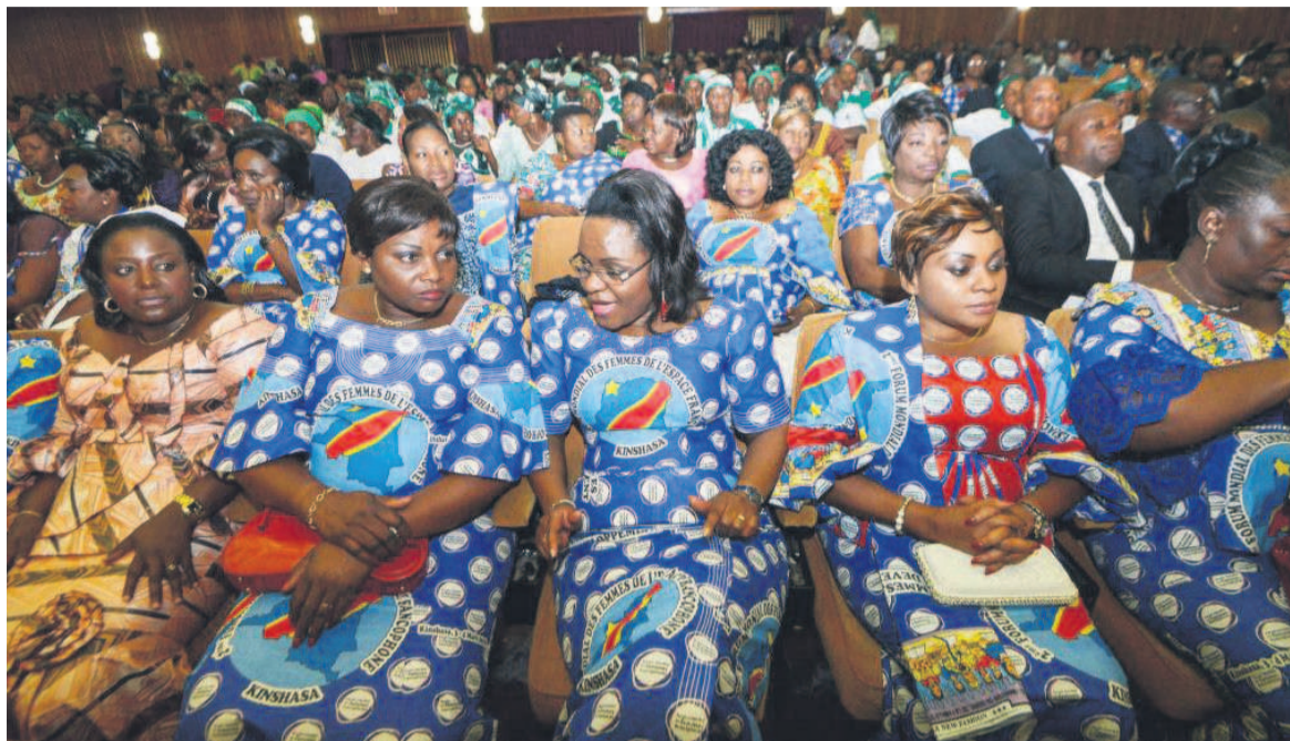
Des femmes congolaises

Toutefois, les mêmes sources renseignent que les entrepreneures, notamment en Afrique subsaharienne, continuent de réaliser des bénéfices inférieurs en moyenne de 34 % à ceux des hommes. Tout un paradoxe qui procède, entre autres, des idées préconçues et des clichés négatifs souvent accolés à tort aux femmes. Dans l'imaginaire collectif africain, en effet, l'entrepreneuriat est perçu comme un concept essentiellement masculin. Une femme entrepreneure est appelée à se comporter comme un homme et doit faire preuve d'autorité, de détermination et d'audace, ce qui n'est pas conforme avec l'identité sociale qu'on lui reconnaît. Et pourtant, loin de troubler la norme sociale, devenir