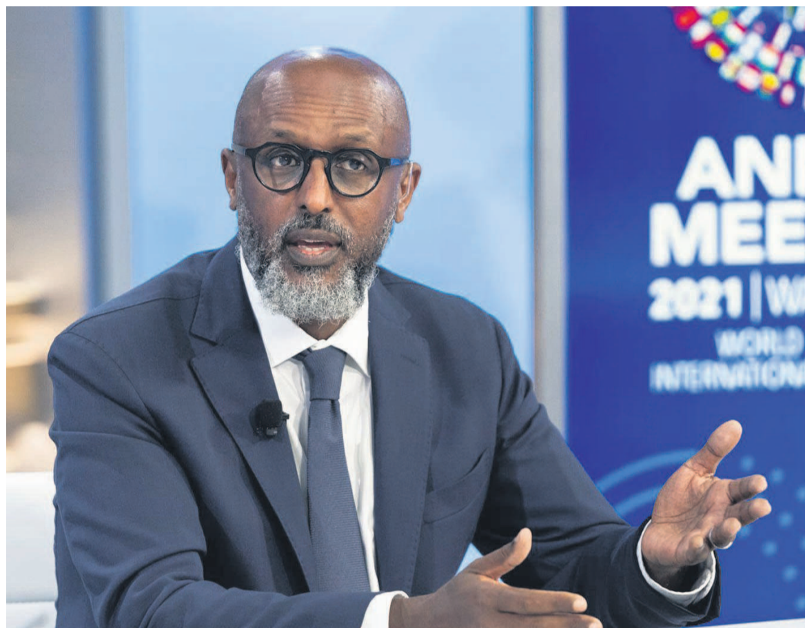
Abebe Aemro Selassie

Ces progrès ont été réalisés « grâce à l'engagement des décideurs politiques d'Afrique subsaharienne, qui s'est traduit par les réformes courageuses qu'ils ont entreprises », a déclaré Abebe Aemro Selassie. Des réformes visaient des cadres de politique monétaire fondés sur les prix et une plus grande flexibilité dans les régimes de taux de change ; combinés à des mesures en