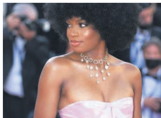
Didi stone au Festival de Cannes

L'Unicef a élevé, le 8 mars, Didi Stone au rang d'ambassadrice nationale, pour être le porte-étendard de la promotion des droits de l'enfant en RDC et en Afrique. Le représentant de l'Unicef en RDC, Edouard Beigbeder, s'est dit ho-