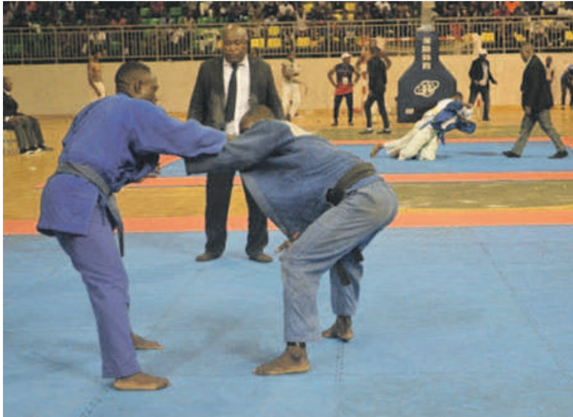
Une compétition de judo

patronnée par le ministre des Sports, Hugues Nguélonlé. Elle est la deuxième du genre après le tournoi de la République qui s'est tenu le 28 novembre dernier.