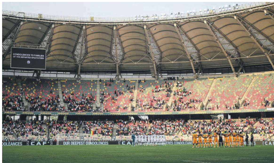
Le stade Japoma, lors match Egypte-Côte d'Ivoire, et le Stade Olembé, au lendemain du mouvement de foule qui a coûté la vie à 8 personnes: deux stades au cœur des critiques

Huit personnes, dont un enfant et deux femmes, avaient péri piéti-