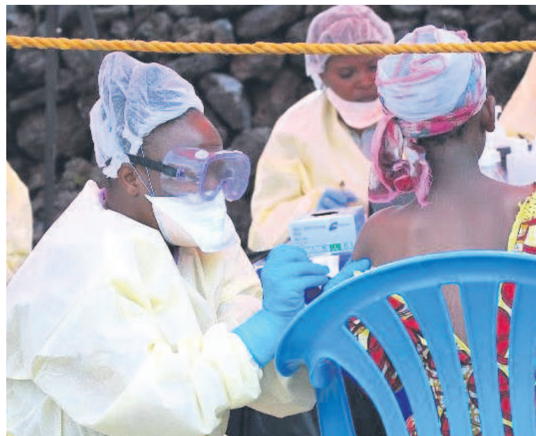
La vaccination, un des moyens de lutte efficace contre la pandémie de Coronavirus

Les autorités sanitaires multiplient des efforts pour installer plusieurs sites de vaccination contre cette pandémie afin de permettre à la population de se faire vacciner. La province du Kasai oriental compte à ce jour soixante sites de vaccination.