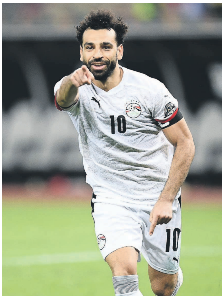
Mo Salah jubile, Badra Ali accuse le coup, l'Égypte bat encore la Côte d'Ivoire aux tirs au but après 1998 et 2006

Un solo de Salah côté droit, où il embarque toute la défense ivoirienne, a été gaspillé par Amro