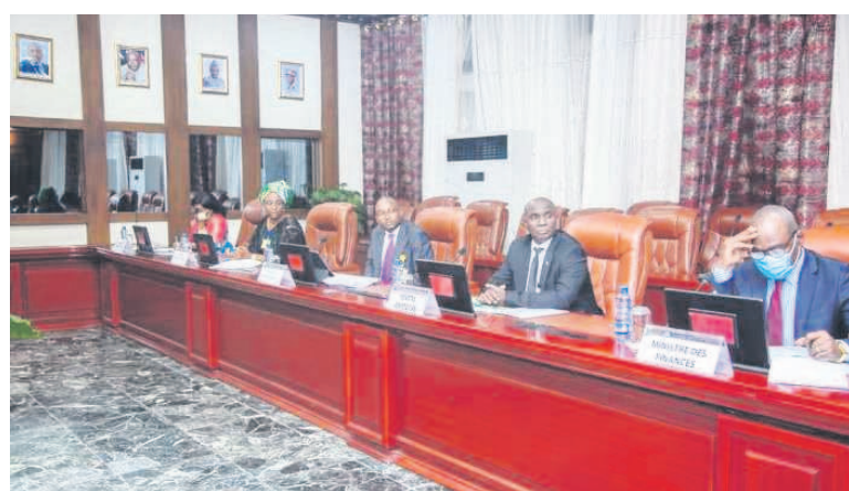
Quelques participants à la troisième réunion d'évaluation

Il s'est agi d'évaluer ce qui a été dit au cours des réunions précédentes en attendant la dernière rencontre prévue incessamment qui consistera à palper les réalités sur le terrain. Les agences d'exécution seront mises à contribution via les structures locales