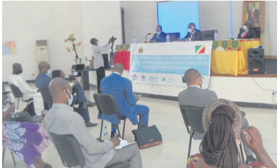
Vue de la salle lors de l'atelier de consultation

Malheureusement, comme l'a signalé Léa Désiré Ondongo Bamboli, ces écosystèmes et les espèces biologiques sont confrontés à plusieurs menaces du fait des pressions anthropiques (érosion côtière, surexploitation des ressources halieutiques, pollution et autres). Pour lui, le projet de création de l'aire marine protégée de la baie de Loango, mis en œuvre par le gouvernement de la République et le Programme des Nations unies pour l'environnement depuis 2018, «est un sujet de soulagement, au regard des objectifs fixés, qui concourent à contenir la menace».