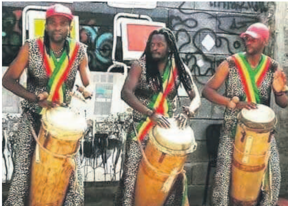
Les percussionnistes du groupe Ballet Africa en plein spectacle

Dans ce groupe, résonnent les rythmes des ethnies du Congo. Sa politique d'interculturalité en se penchant vers les autres cultures et traditions africaines, notamment sénégalaise, malienne et guinéenne, donne aux spectacles une personnalité rythmique résolument traditionnelle et particulière. En effet, arrivé au Royaume du Maroc, le groupe a eu un parcours artistique très varié et très migratoire, pendant lequel il a enregistré des succès, des échecs et même un manque de reconnaissance. Il a intégré d'autres ensembles de danses africaines. N'ayant pas les mêmes buts et objectifs artistiques, le groupe a repris sa vision fondée sur l'amour, la paix, le social et le respect.