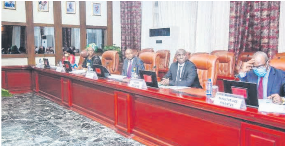
Quelques participants à la troisième réunion d'évaluation

dont les préparatifs vont évoluer avant d'aller sur terrain. Il a été question du projet complexe que représente le programme de développement à la base des 145 territoires où il sera question de construire des écoles, des hôpitaux, des infrastructures sportives, etc. Le gouvernement aura à travailler avec les agences d'exécution, a précisé le ministre de la Communication et Médias, avant d'ajouter que dans ce projet, le gouvernement va privilégier les structures locales pour concrétiser la vision du chef de l'Etat, Félix-Antoine Tshisekedi, qui vise leur renforcement en vue