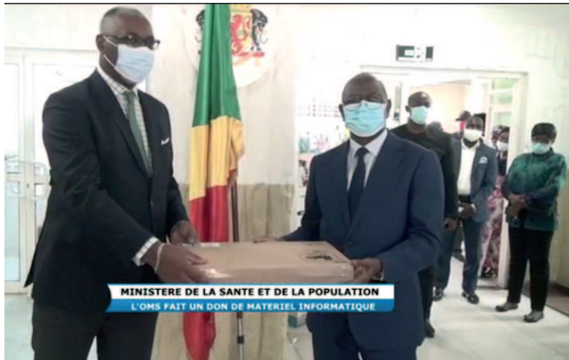
La remise symbolique du matériel informatique.

Il revient à la direction de l'information sanitaire, de l'évaluation et de la recherche,