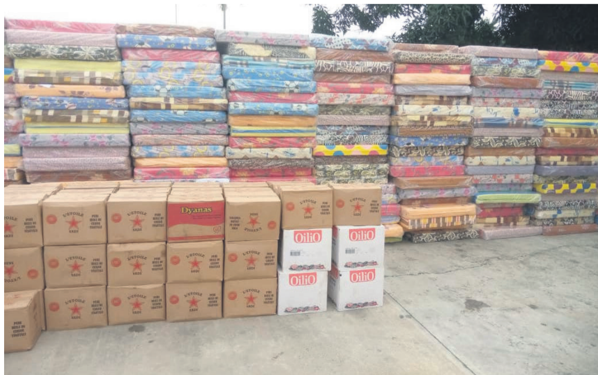
Des vivres et non vivres destinés aux sinistrés