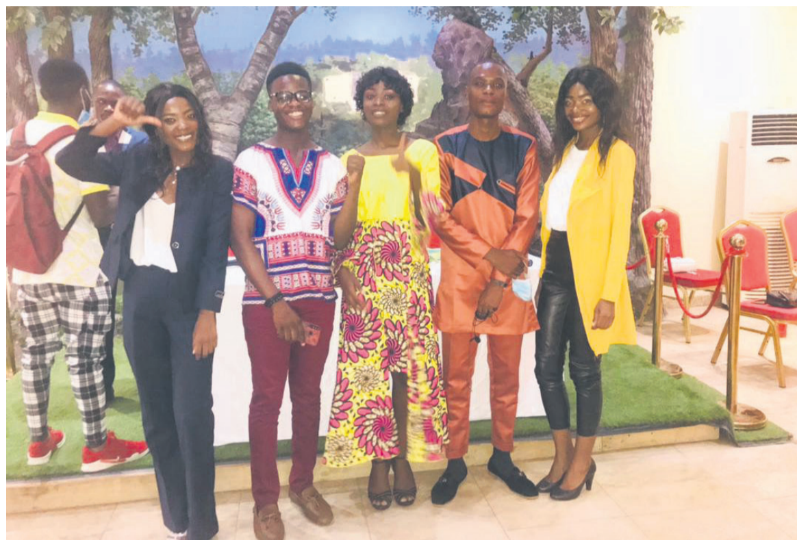
Des jeunes entrepreneurs