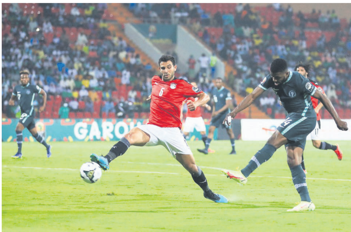
Le Nigeria s'est imposé grâce au but de Kelechi Iheanacho

Le Nantais a sans cesse dépassé son arrière-droit,