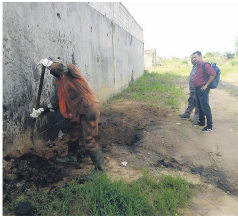
De l'huile de vidange et des déchets déversés à l'extérieur de l'usine

Des pathologies respiratoires liées à l'intoxication au plomb sont enregis-