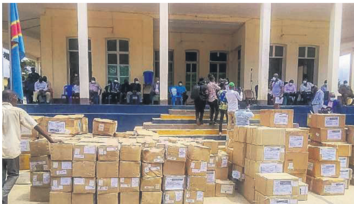
Le lot d'intrants et des médicaments remis

L'important lot des intrants et médicaments de lutte contre la covid-19 a été remis récemment à la zone de santé de Boma par le ministère de la Santé publique, Hygiène et Prévention, via le Secrétariat technique de la riposte contre cette maladie, avec l'appui de certains partenaires techniques et financiers.