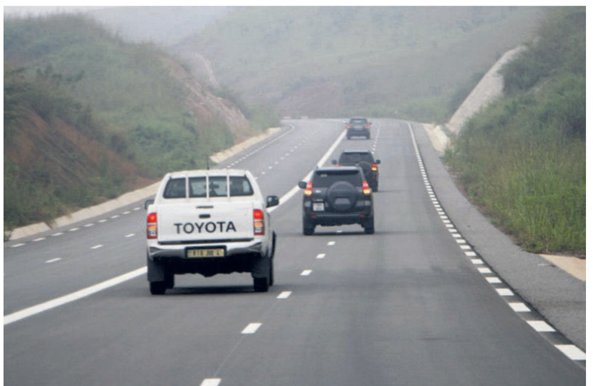
Un tronçon de la route nationale n°1

Au titre de cette année, le Fonds routier a initié quelques projets parmi lesquels la construction du pont