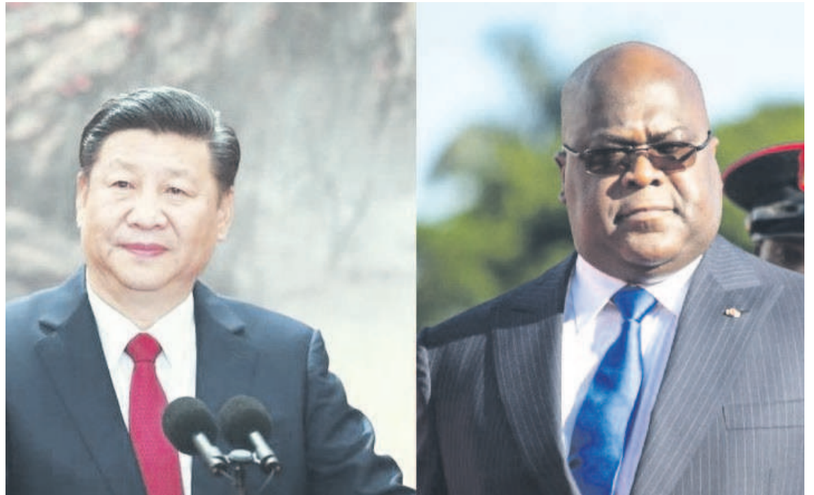
Les présidents chinois et congolais

tion au cours d'une séance de questions-réponses lors d'une conférence de presse sur la manière dont la révision par la RDC des contrats miniers signés avec la Chine en 2008 pourrait affecter les investissements chinois dans le pays. En effet, le président Félix Tshisekedi a demandé une révision des contrats miniers signés avec la Chine en 2008 par son prédécesseur, affirmant vouloir obtenir des accords plus équitables.