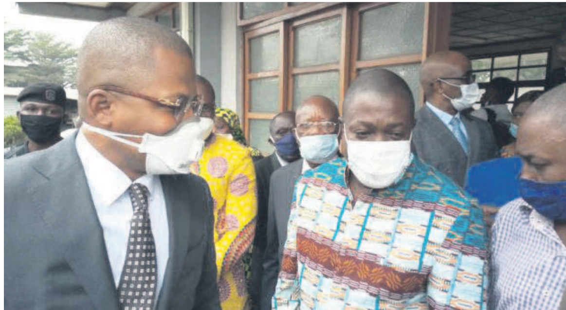
Le ministre Didier Budimbu

Mû par le souci de prendre la température du point de vue fonctionnement des différents services placés sous sa responsabilité, le ministre des Hydrocarbures, Didier Budimbu, a effectué, le 15 septembre, une visite surprise au secrétariat général de son ministère.