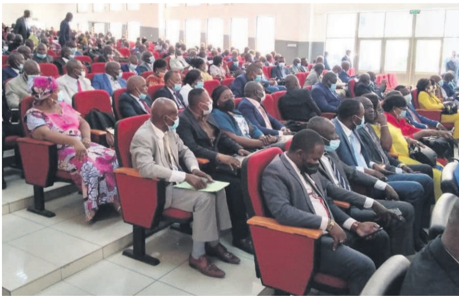
Les participants à la session

La vingt-troisième session du Conseil national de l'éducation préscolaire, primaire, secondaire et de l'Alphabétisation se tient à Brazzaville du 15 au 17 septembre sur le thème « La maîtrise du personnel actif pour le fonctionnement harmonieux des structures scolaires ».