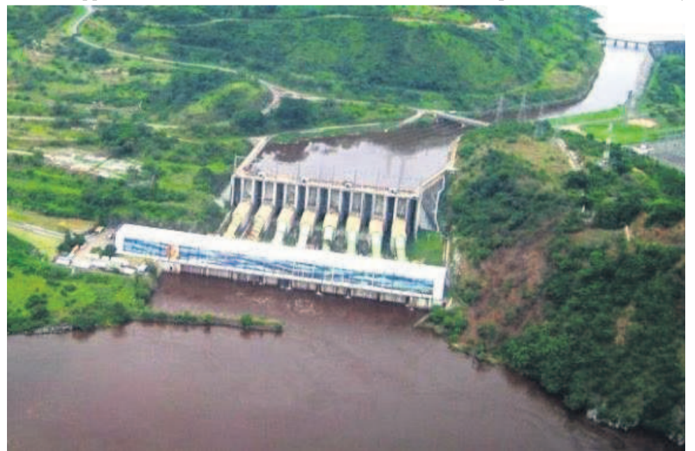
Barrage d'Inga

Pour cette association, les impacts sociaux et environnementaux à craindre sont notamment la perte des moyens de subsistance, qui peut créer une crise alimentaire de près de 80 mille pêcheurs installés dans la zone du projet et dépendant de la rivière Lufira et du Lac Upemba ; des changements dans l'hydrologie et la charge sédimentaire en aval de la rivière, qui pourra occasionner la perte d'environ soixante km 2 de terres forestières ainsi que les menaces sur la pollution de l'eau et le fonctionnement des turbines à cause des végétations aquatiques flottantes. L'ONG a également relevé comme conséquences à redouter les menaces sur la migration des espèces, à savoir les plus grands mammifères, en particulier la dernière population de plus au moins 190 éléphants dans la région du Katanga et autres. Mais, outre ces impacts, l'ONG Dédur a dit également constater la violation de la loi N° 14/003 du 11 février 2014 relative à la conservation de la nature, qui interdit le développement des projets ayant des objectifs autres que ceux liés à la conservation de l'environnement. « Parce qu'une aire protégée a pour but de se rassurer à long terme de la conservation de la nature, des services écosystémiques et des valeurs culturelles qui lui sont associés »,