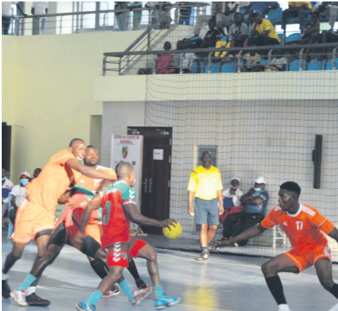
Caiman et Petro sport, deux candidats pour la consécration finale en seniors hommes

Le groupe E est composé de Caiman, Avenir du rail et Interclub de Brazzaville. Petro