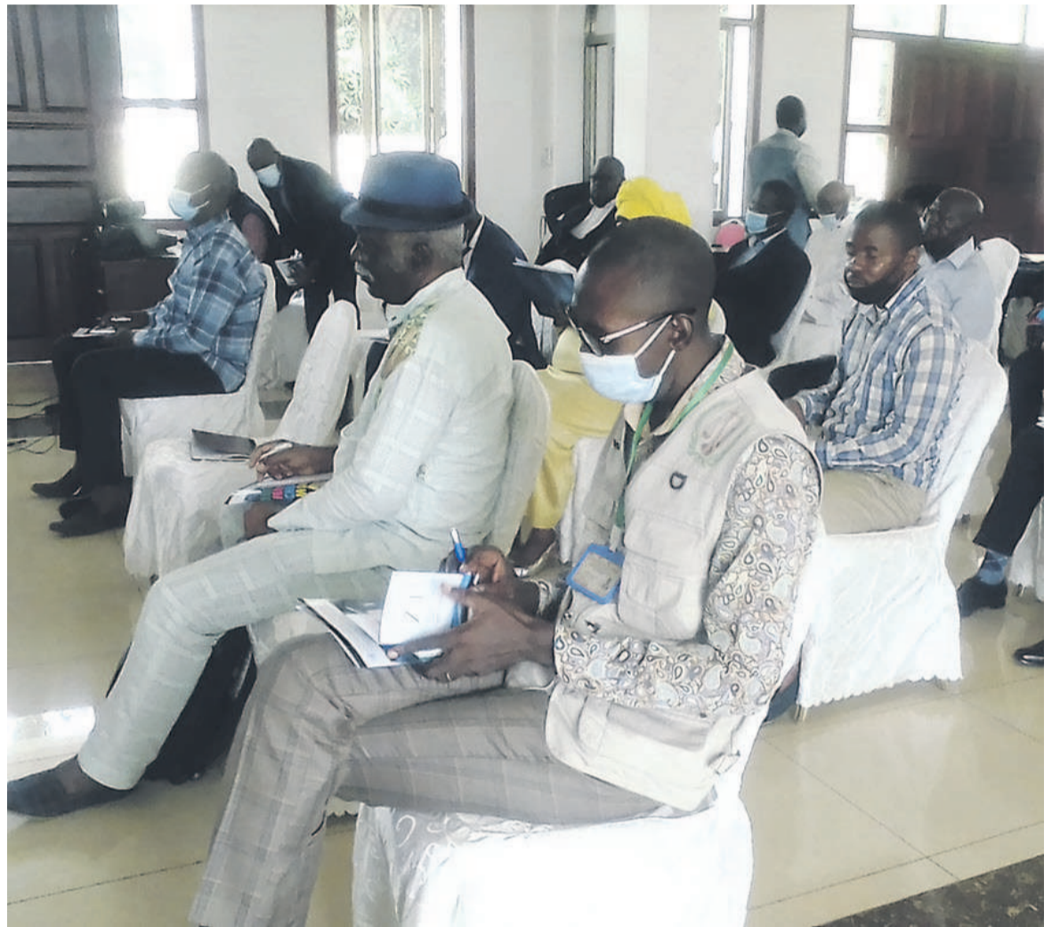
Les participants à l'atelier

« La société civile doit être à l'avant-garde de cette lutte contre la covid-19 en s'assurant que les droits de l'homme sont respectés car nous constituons un cadre de travail. Les droits de l'homme sont un levier essentiel pour lutter contre la covid-19. Il y a des mesures de lutte contre la pandémie à covid-19 prises par le gouvernement, il faut que la dignité humaine soit respectée dans l'application de ces mesures. Le personnel de santé, par exemple, doit respecter le traitement des malades et ceux qui sont chargés de faire respecter le couvre-feu doivent savoir