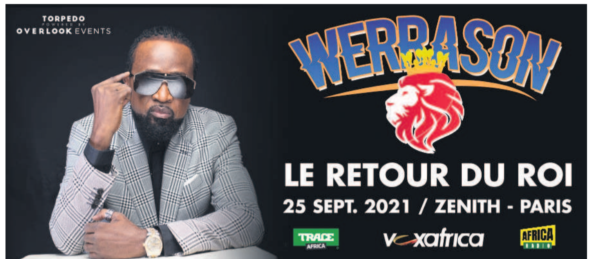
« Le retour du roi au Zénith de Paris » décalé d'une semaine.

Néanmoins, il y a lieu de se demander si ce report n'aurait pas un lien avec la manifestation des fans inconditionnels de la star congolaise le 14 septembre. Ces derniers avaient pris carrément d'assaut la maison Schengen. Excédés par le refus de visa opposé par le centre européen de délivrer les visas aux musiciens de l'orchestre WMMM et ce, à quelques jours du concert censé être son événement de