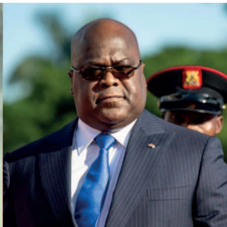
Les présidents chinois et congolais