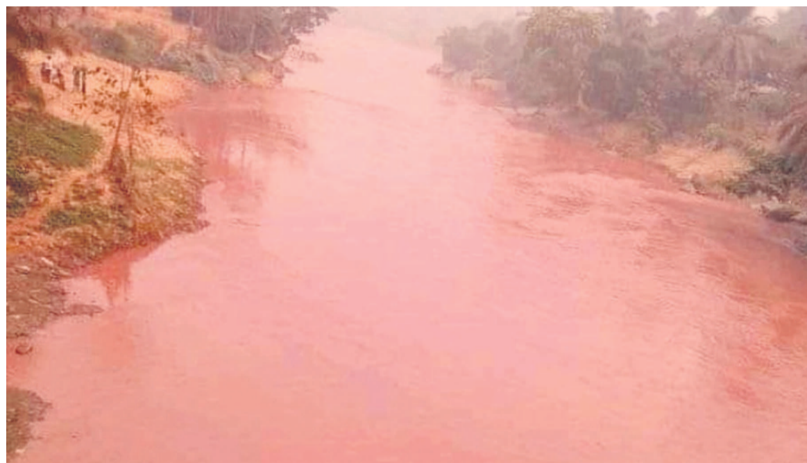
Les eaux de la rivière Tshikapa qui ont viré au pourpre

Le vice-Premier ministre, ministre des Affaires étrangères, Christophe Lutundula Apala, et son homologue angolais, Tété Antonio, sont tombés d'accord pour mettre sur pied le plus rapidement possible une équipe conjointe composée d'experts pour se rendre aux sources des rivières Kasai et Tshikapa qui se trouvent en Angola.