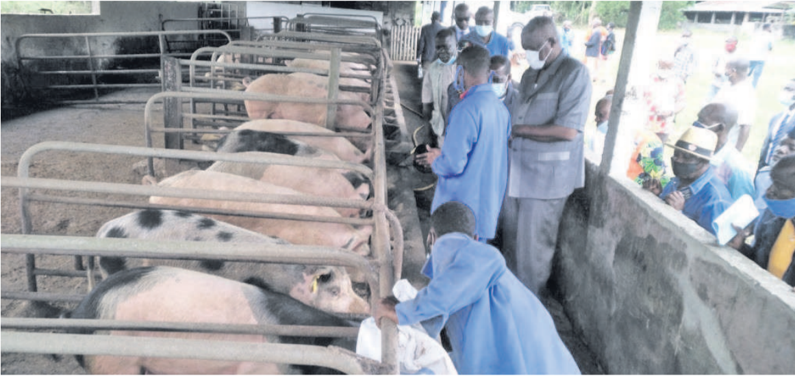
Une porcherie dans le district de Boko/Adiac

L'accès à l'alimentation pour bétail est un véritable casse-tête pour les producteurs locaux, notamment les éleveurs de poules pondeuses, de porcs, et de bovins. Alors que la nouvelle politique de l'État mise sur les filières maïs, soja, sorgho et Niébé.