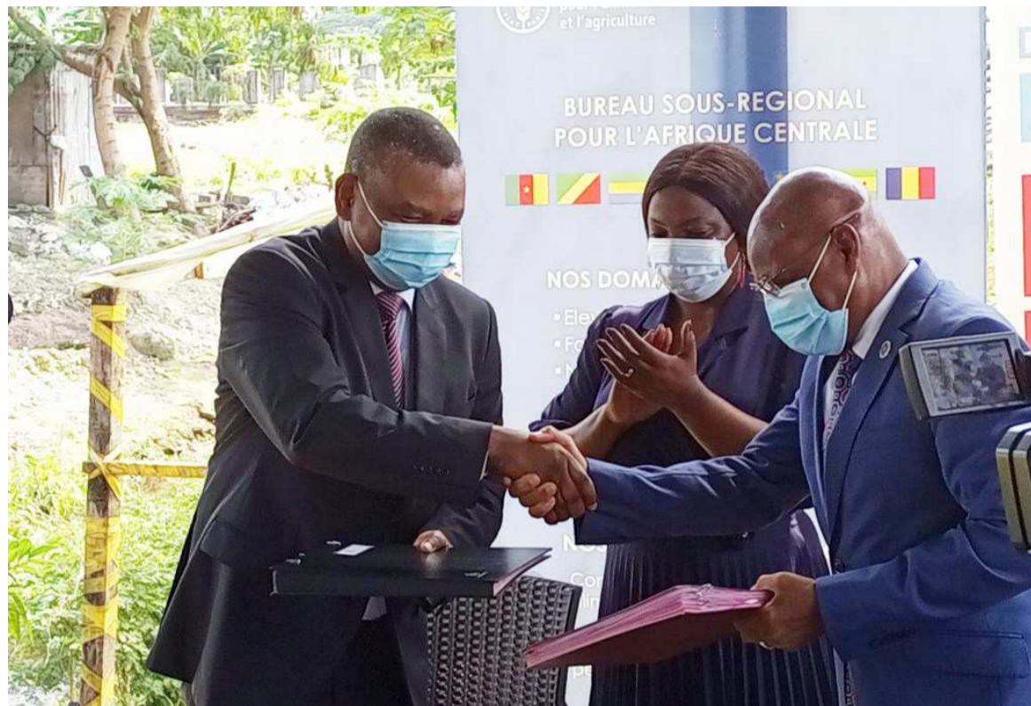
Echange de documents entre les deux parties

D'un montant total de 206 000 dollars américains, soit 115 000 000 F CFA sur une durée d'un an. Ce projet d'appui à la CEEAC vise à faire le bilan à mi-parcours et partant, sur la base des leçons apprises, définir de nouvelles priorités pour une politique agricole commune et pour les investissements catalyseurs clefs de deuxième génération, conformément aux engagements continentaux et à l'agenda 2030 ainsi que dans le cadre de la réponse à la pandémie