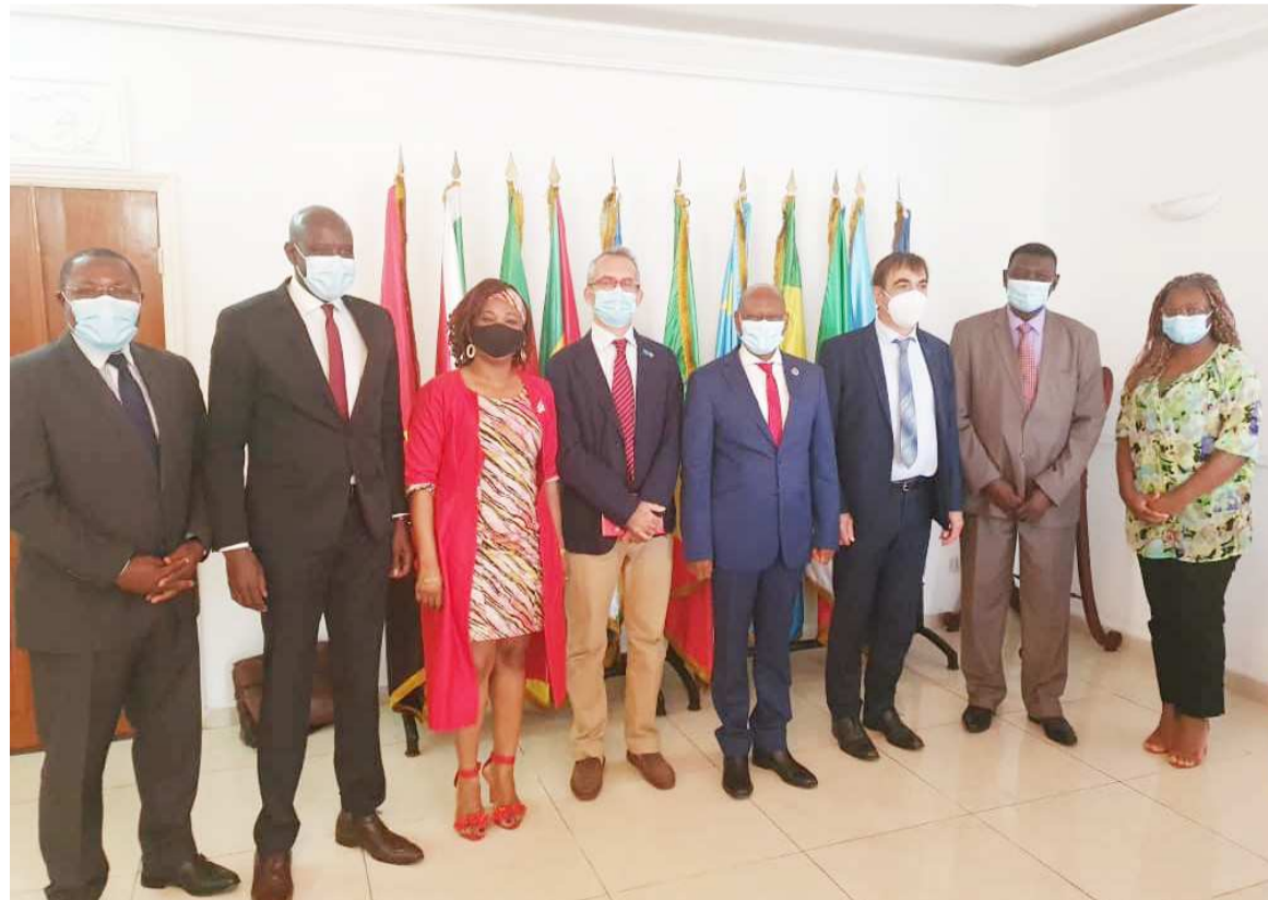
La photo de famille

Rappelons que le Passmar vise à renforcer la sûreté et la sécurité maritimes en Afrique centrale. De manière concrète, la mise en œuvre opérationnelle du Programme permettra de renforcer la gouvernance maritime et la maîtrise des espaces maritimes ; d'adapter les cadres juridiques nationaux/régionaux aux standards internationaux ; de renforcer l'application des lois dans les Etats membres ; de faciliter et de coordonner l'implication accrue de la société civile et du secteur privé dans le processus de politique maritime intégrée. Les équipes techniques ont reçu mandat d'amorcer les préparatifs liés à ce démarrage sous la supervision du Commissaire aux Affaires politiques, paix et sécurité.