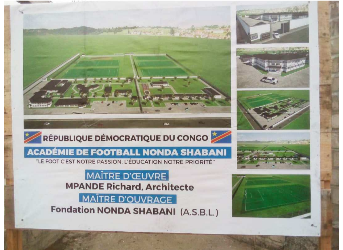
Maquette de l'Académie de football Nonda-Shabani

Et de poursuivre : « La qualité de nos installations modernes qui seront érigées à cet endroit, sans oublier la présence des enfants qui seront internés et pris en charge totalement par la Fondation, l'étendue de notre quartier et l'ensemble de tous nos riverains méritent aussi l'encadrement et la sécurisation par la police nationale congolaise. Le rapprochement avec la police nationale congolaise ne date pas d'aujourd'hui, car depuis la création de