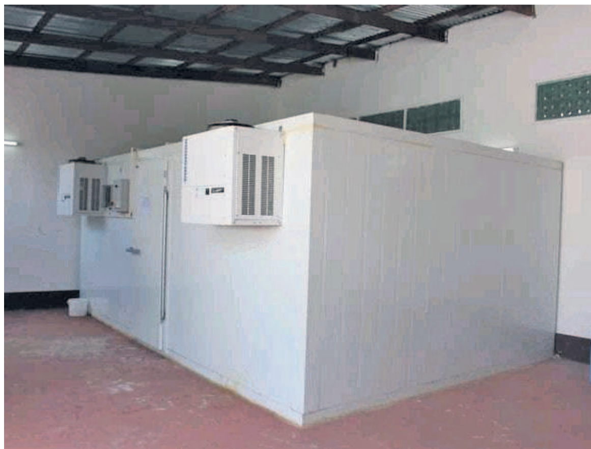
Une des chaînes de froid dont dispose le pays

L'objectif fixé par le gouvernement d'atteindre l'immunité collective, en vaccinant trois millions de personnes, soit 60% de la population, nécessite, en effet, l'approvisionnement de vaccins