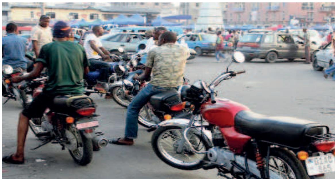
Des motocyclistes dans un carrefour à Kinshasa

A Kalehe, Kabare, dans la prison de Bukavu et ailleurs, a fait savoir le président du bureau de coordination de la société civile de ladite province, les prisonniers manquent de tout et meurent de faim. Outre les conditions de détention des prisonniers, la délocalisation de la prison de Bukavu a également été envisagée. Page 3