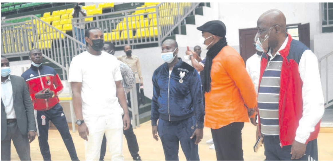
La délégation de Crice Boussoukou au gymnase Etienne Manga

Au cours d'une visite, le 10 août des infrastructures sportives de Brazzaville, le double champion du monde et d'Europe en boxe thaïlandaise ou Muay-thaï, le Congolais Crice Boussoukou a invité les sportifs et les acteurs politiques à mettre la main dans la pâte afin de valoriser cette discipline au Congo.