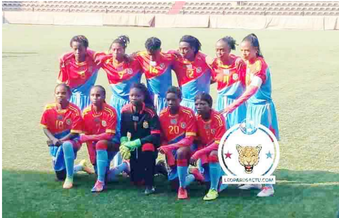
Les Léopards dames U20 de la RDC avant le coup d'envoi du match, le 10 août à Lubumbashi