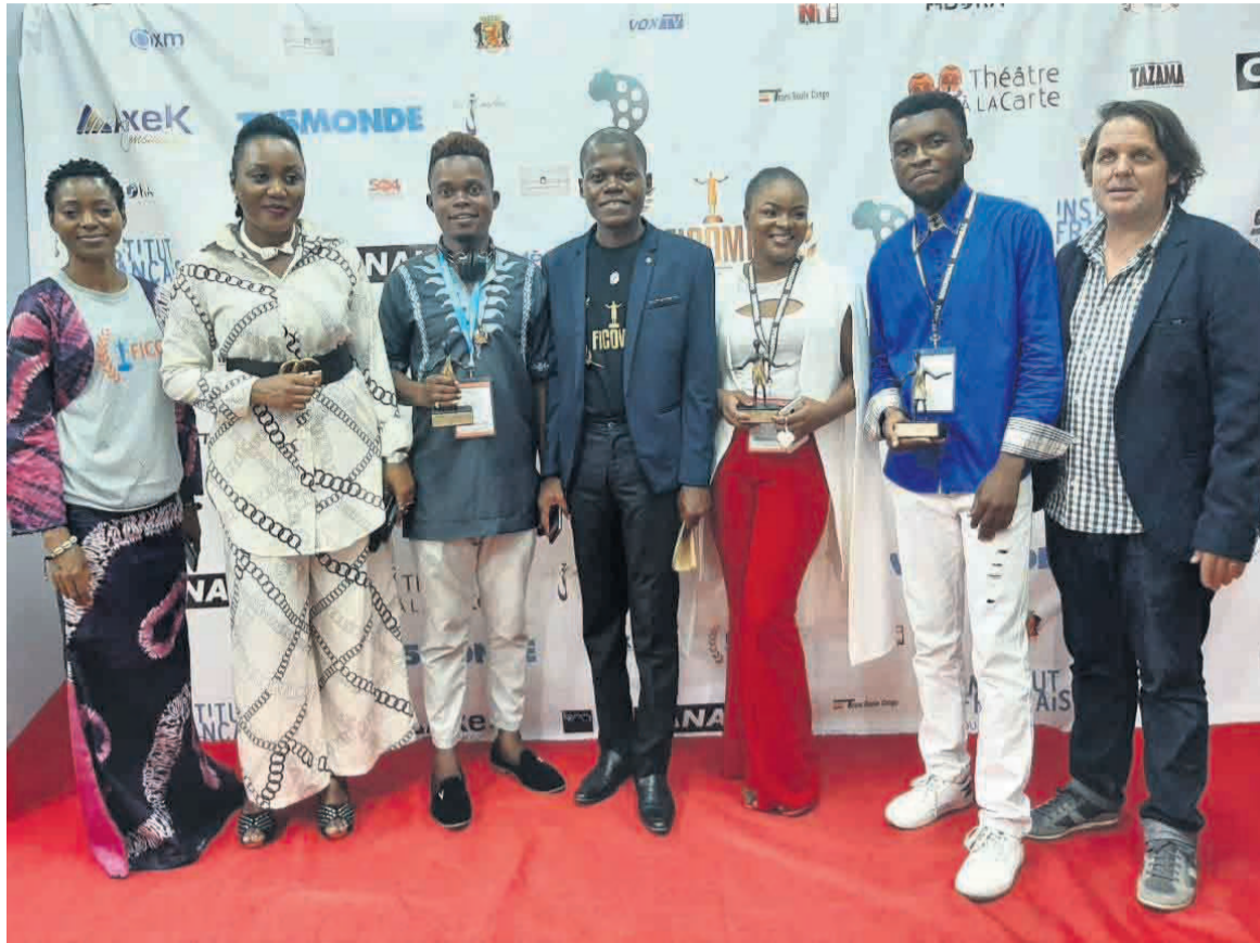
La photo de famille des acteurs à la fin du Ficomp 2021

En effet, cette édition qui a eu la particularité de se tenir en ligne et en présentiel a reçu le soutien et l'apport inestimables des chaînes de télévision TV5 Monde et Canal +. Durant le festival qui s'est déroulé essentiellement à l'Institut français du Congo (IFC), le public a eu droit à huit projections par jour de films retenus par la programmation. Un public qui a suivi les autres activités tels que les master class, les conférences-débats et les rencontres professionnelles entre les cinéastes et acteurs confir-