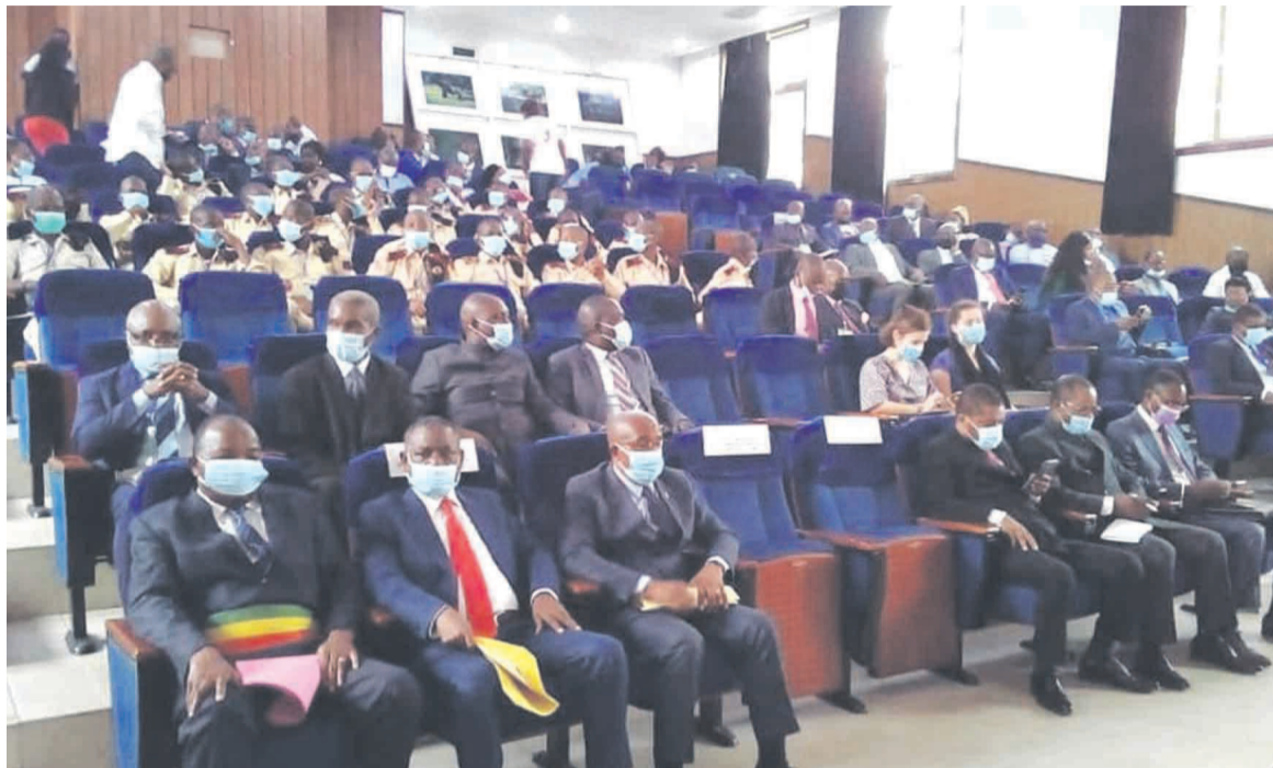
Les participants aux Journées nationales du patrimoine

« Dans le contexte de notre pays, le ministère de la Culture et des Arts qui a reçu mandat de protéger et de pro-