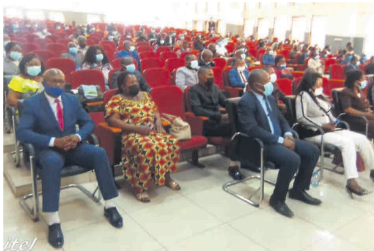
Les pédagogues en formation à Brazzaville

Le séminaire qui prendra fin le 9 juillet à Brazzaville permet à une quarantaine d'inspecteurs et conseillers pédagogiques venus de tous les départements du pays de mettre à jour leurs connaissances en didactique de lecture-écriture.