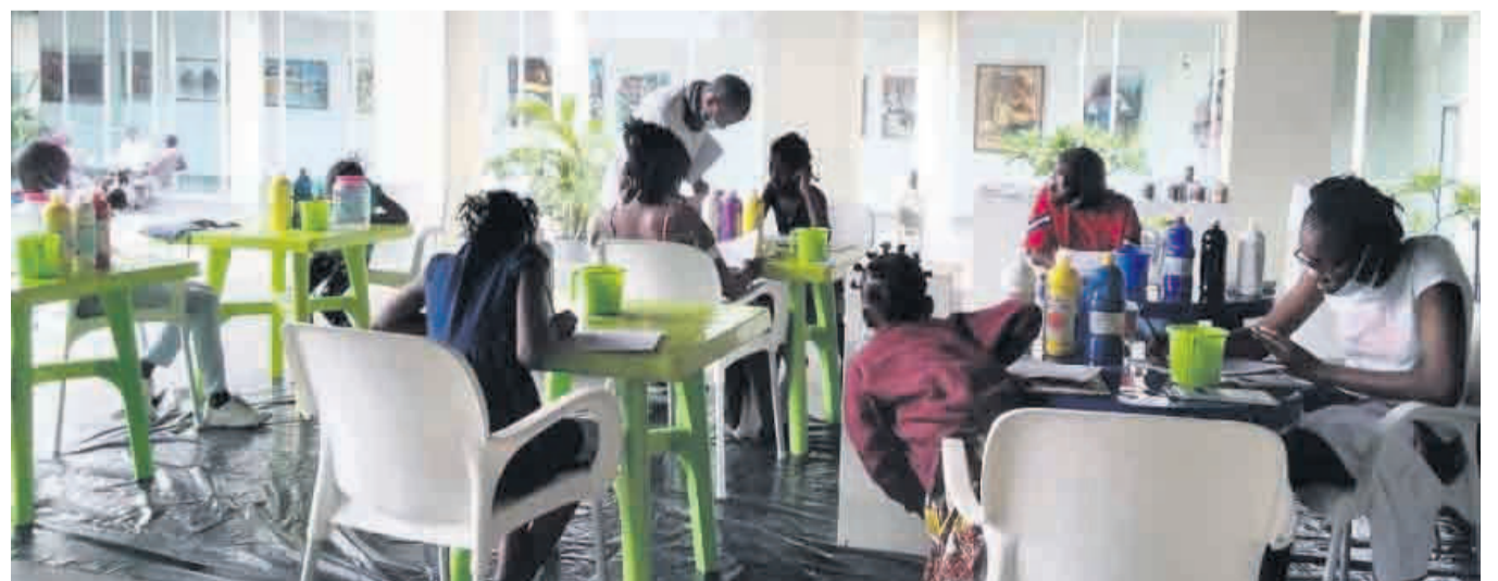
Une vue des enfants à l'atelier de peinture

En vue de susciter la créativité des enfants, le musée Cercle africain, situé en face du marché de la frontière dans l'arrondissement 1 Eméry-Patrice-Lumumba, a lancé le 6 juillet un atelier vacances de peinture. Celui-ci est destiné aux enfants âgés de 8 à 16 ans.