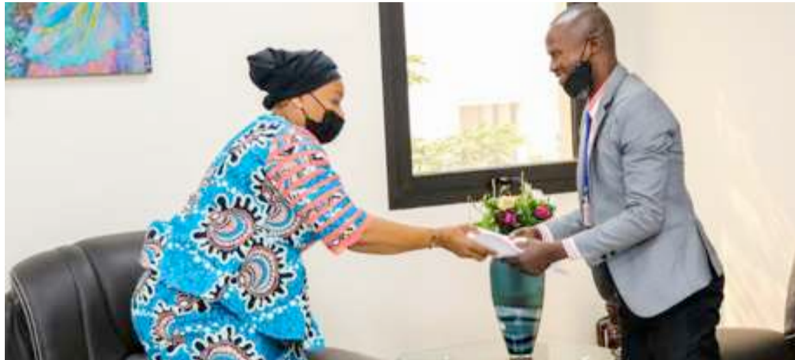
Remise de l'enveloppe et de la note de perception aux responsables des établissements Kabongo Ngoy

En remettant cette enveloppe aux responsables de la société Kabongo Ngoy, la VPM Eve Bazaiba leur a également expliqué la procédure à suivre en vue de faire bénéficier l'Etat congolais ainsi que toute la population de cet argent des taxes payées par les opérateurs dans ce secteur. «Le ministère n'est pas une banque. Ici, on ne perçoit pas l'argent. Nous faisons juste la politique, nous donnons l'orientation. Et dans nos bureaux ici, on n'a pas un coffre-fort pour garder l'argent », a indiqué Mme Eve Bazaiba, qui a remis, en plus de cette enveloppe, une note de perception pour que cet argent soit payé à