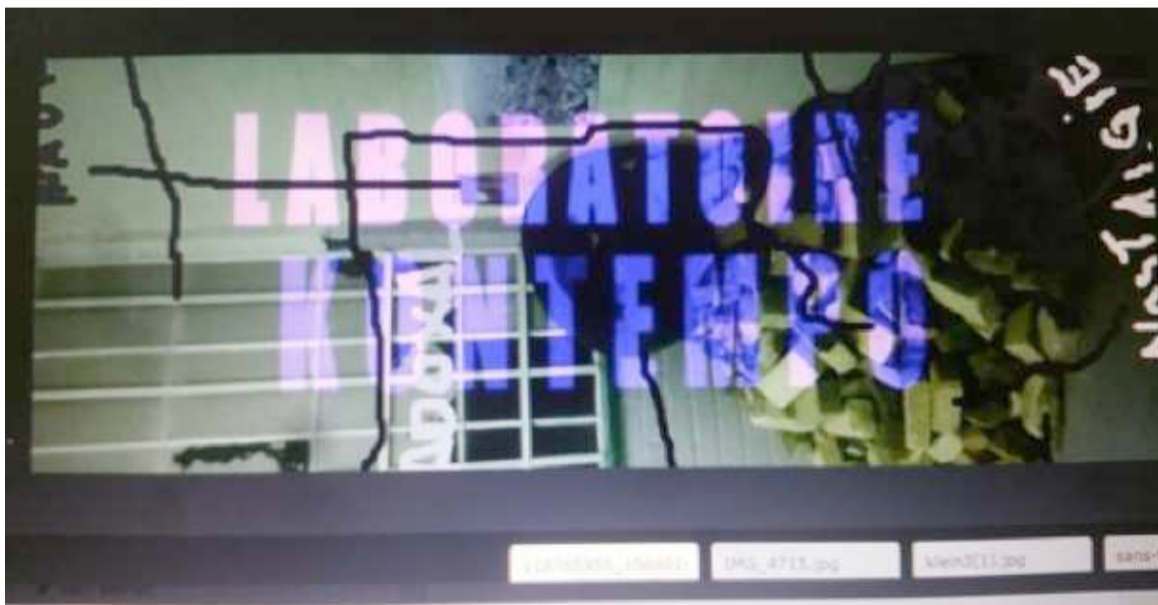
Appel à candidatures de Laboratoire Kontempo 2021

Les propositions sur "Kinzonzi : Réinvestir les perspectives" peuvent être autant des projets collectifs que des travaux individuels. Les candidats sont tenus