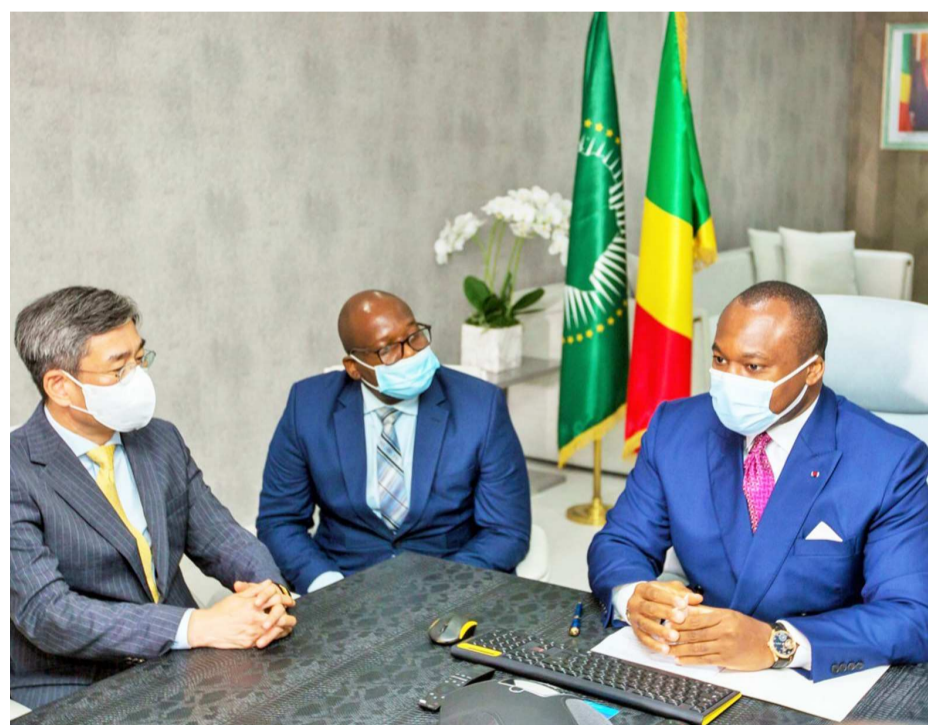
Les ministres congolais et sud-coréen lors de l'audience

Le vice-ministre sud-coréen des Affaires étrangères, Ham Sang Wook, a fait part, le 7 juillet à Brazzaville, de la volonté de son pays de collaborer avec le Congo dans les domaines liés aux ressources naturelles.