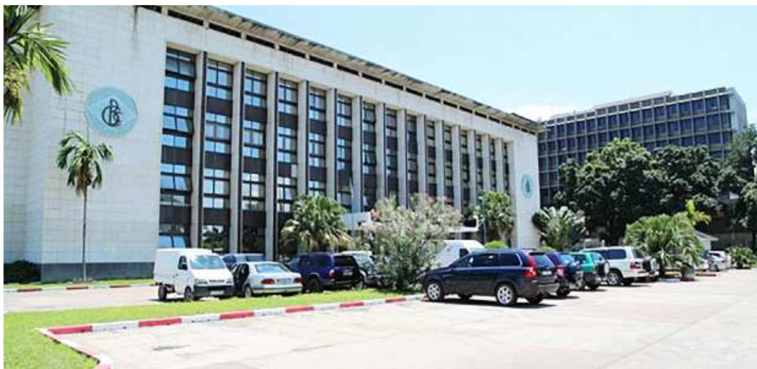
Le siège de la Banque centrale du Congo à Kinshasa