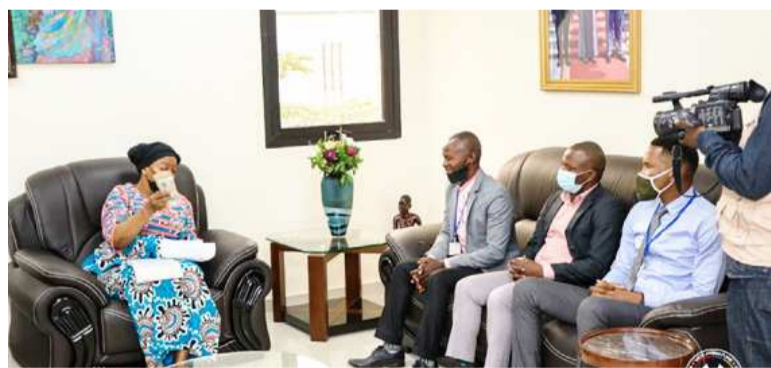
La VPM de l'Environnement dévisant avec les responsables des établissements Kabongo Ngoy.

La vice-Première ministre chargée du secteur, Eve Bazaïba, vient de