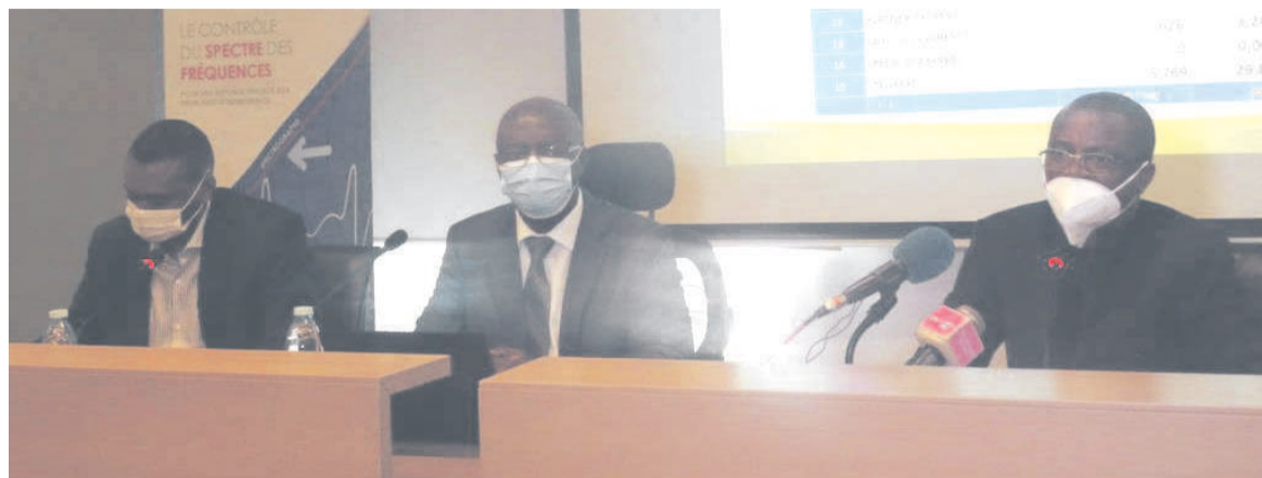
Les régulateurs présentant le rapport Adiac

Dans son récent rapport sur les activités postales, présenté le 22 juin, l'Agence de régulation des postes et des communications électroniques (ARPC) s'est félicitée de la dynamique du secteur et de ses opérateurs locaux. Le régulateur public a indiqué que les données contenues dans son rapport sont celles réalisées par les opérateurs postaux privés dans le segment du courrier et colis express. Il faut souligner que la poste,