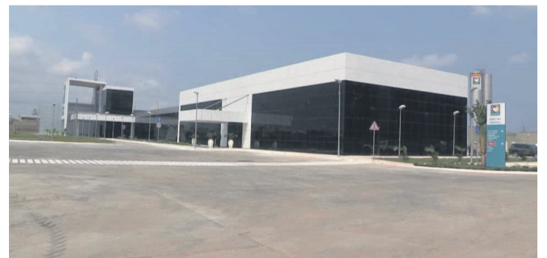
La maquette de l'hôpital général de Patra

A l'issue d'une visite de terrain de l'hôpital général de Patra (Pointe-Noire), le ministre de la Santé et de la Population, Gilbert Mokoki, a évoqué quelques problèmes à régler avant que la structure sanitaire ouvre ses portes aux malades au plus tard au mois de septembre.