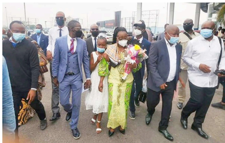
La veuve Chebeya et l'orphelin de Bazana reçus à l'aéroport de N'Djili

Officiellement, ces deux membres de familles des activistes des droits de l'homme assassinés en juin 2010 sont revenus dans la capitale congolaise pour recevoir le prix Maman Marthe-Kasalu-Tshisekedi alors qu'il y a de nouvelles révélations