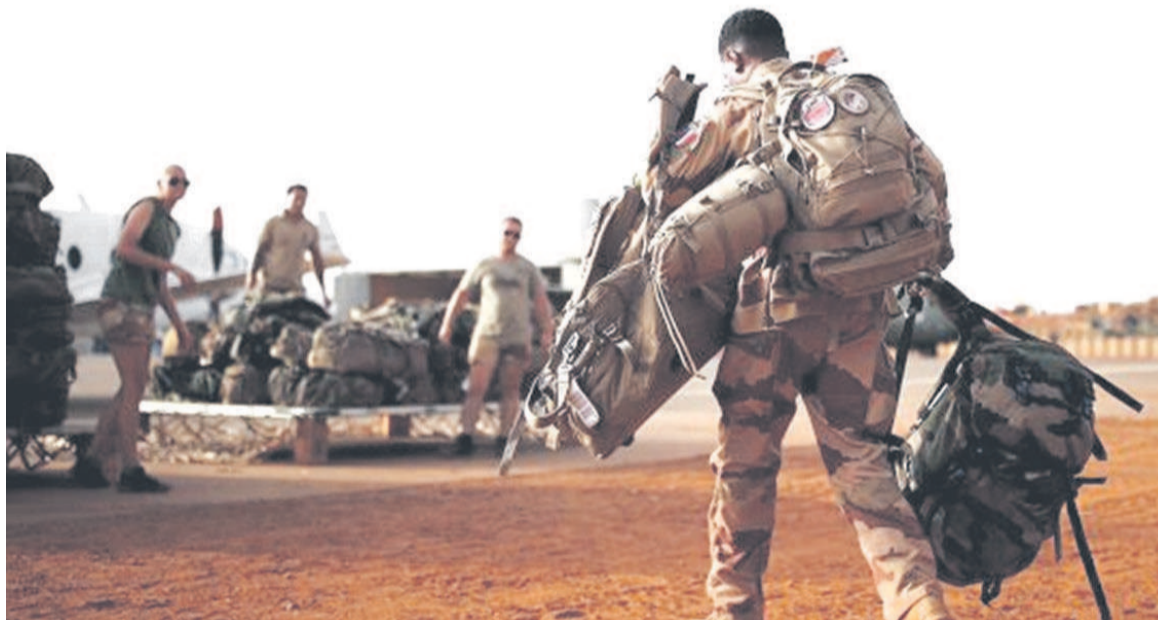
Le retrait de la force Barkhane

Le retrait annoncé de Barkhane, forte de 5100 soldats, suscite de nombreuses réactions, surtout après l'attaque à la voiture piégée du 21 juin dont 6 militaires français et 4 civils ont été blessés. Sans la France, les opérations maliennes seront vraisemblablement « extrêmement réduites : protection de base;