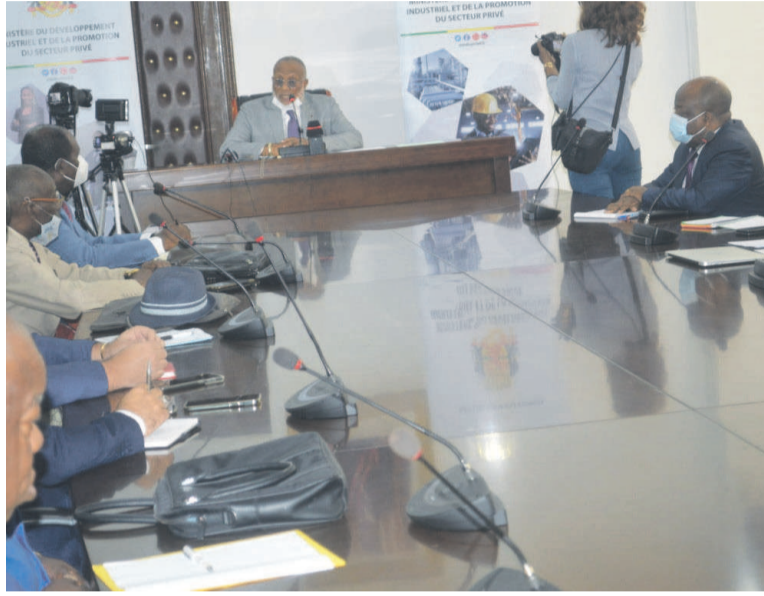
Échange entre les deux parties/Adiac

« Nous voulons le soutien actif du gouvernement. Que deviennent nos collègues qui