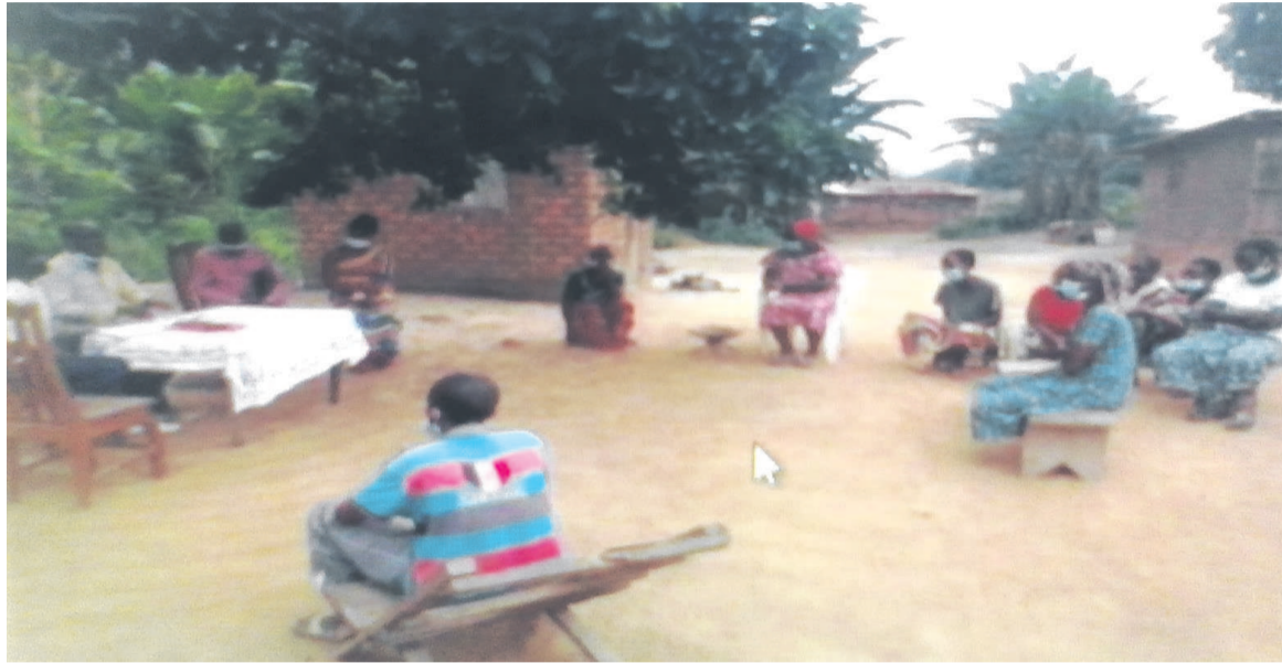
Les membres de la RPDH s'entretenant avec la population de Louvakou/Adiac

La rencontre avec les directions départementales de l'Agriculture, de l'Economie forestière, de l'Environnement, des Populations autochtones, de la Pêche, de l'Elevage ainsi qu'avec les