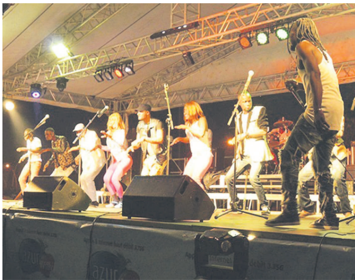
Un orchestre lors de la journée de la musique

Anatole Collinet Makosso a aussi annoncé exprimé l'engagement du gouvernement de lancer dans un proche avenir une profonde réflexion sur l'avenir de nos cultures à travers une concertation avec les artistes et les hommes de Lettres « La culture et les arts doivent contribuer, par leurs retombées, à la croissance économique. »