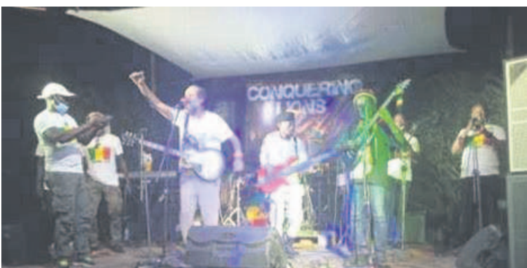
Le groupe Conquering Lions en concert pendant la fête de la musique

L'ensemble des cuivres et des percussions de la musique du groupe Conquering Lions a raisonné, le 21 juin, au restaurant-bar La Pyramide dans la ville océane à l'occasion de la journée mondiale de la musique.