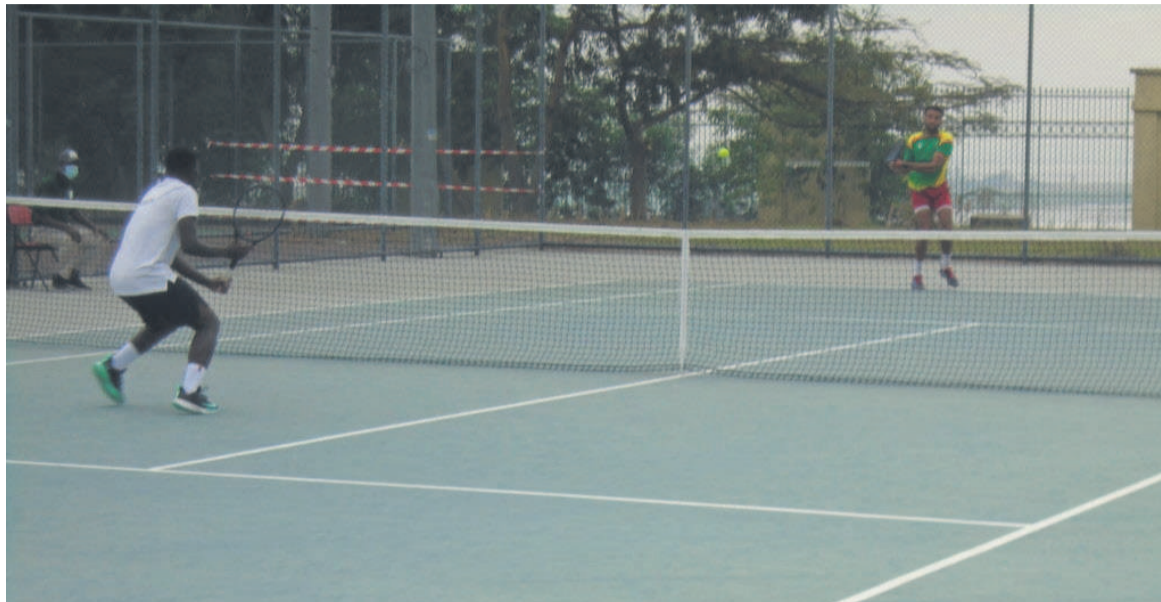
Le Cameroun relance ses chances de disputer les demi-finales

Ayant concédé sa deuxième défaite, le Gabon a vu les chances d'accéder au prochain tour s'en- voler. « Mes joueurs ne sont pas