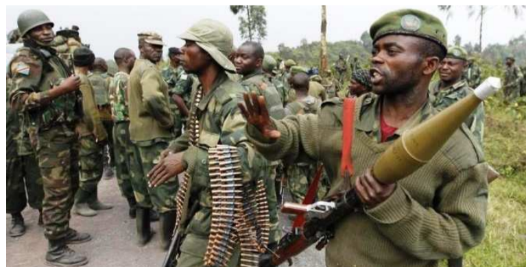
Des éléments des Fardc au front

Ces interpellations rentrent dans le cadre des efforts fournis par le gouvernement et les autorités de l'armée afin de mettre fin aux ré-