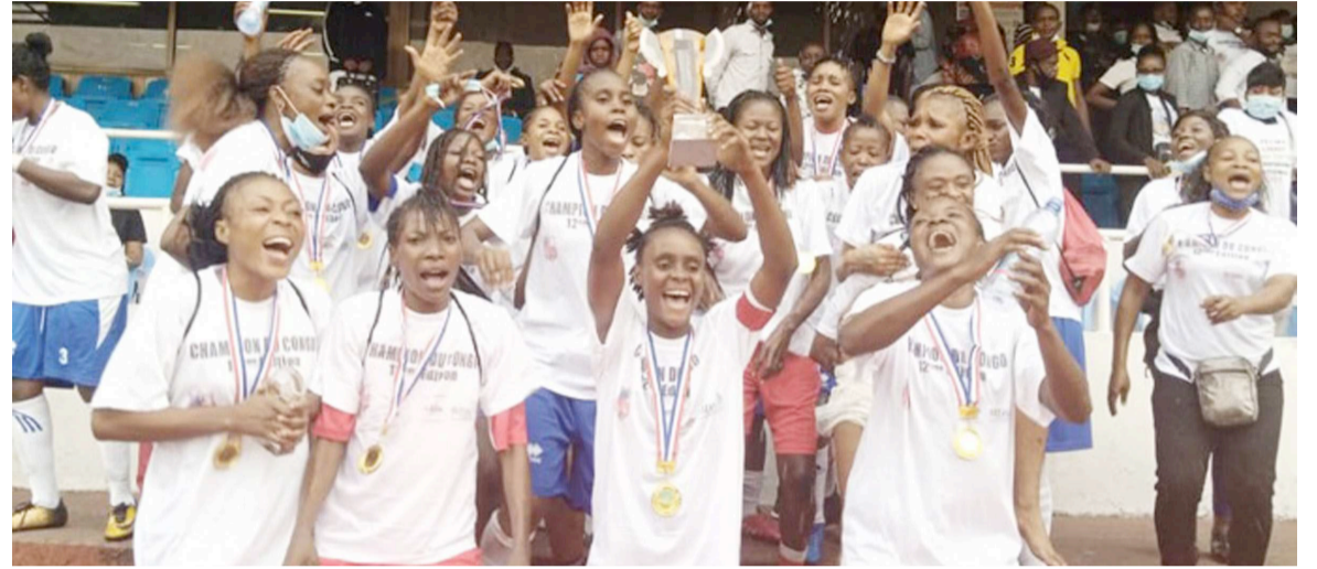
FCF Amani vainqueur de la 12e Coupe du Congo de football féminin

La 12e édition de la Coupe du Congo de football féminin a vécu, avec le sacre du FCF Amani qui disputera pour la première fois de l'histoire la Ligue des champions de football féminin, nouvelle compétition instituée par la Confédération africaine de football (CAF) depuis 2020.