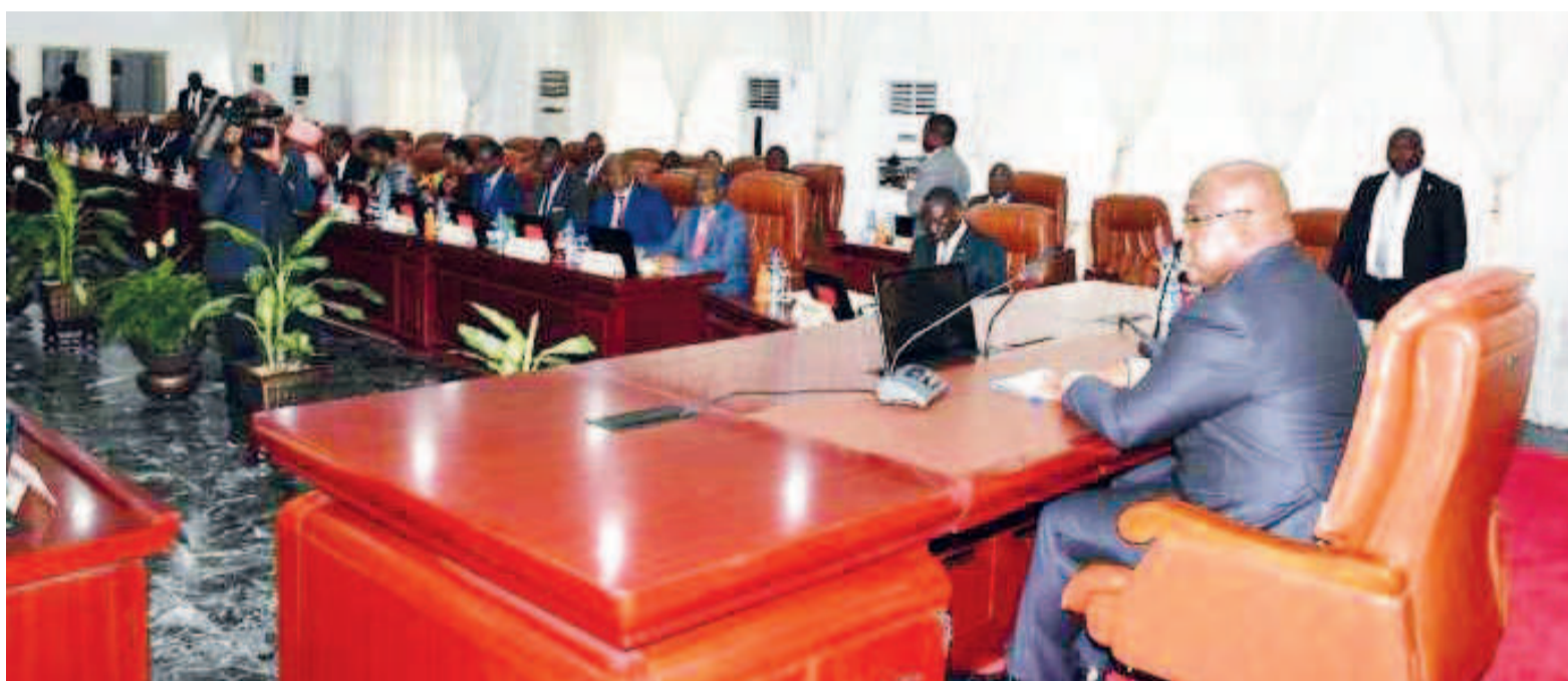
Un conseil des ministres présidé par le chef de l'Etat, Félix Tshisekedi