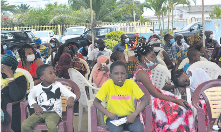
Une vue des patients attendant leur tour

A l'occasion de la journée mondiale de sensibilisation sur la drépanocytose, le ministre de la Santé et de la Population, Gilbert Mokoki, a lancé, le 19 juin à Pointe-Noire, la campagne de vaccination gratuite contre le pneumocoque et les salmonelles chez les personnes atteintes de drépanocytose.