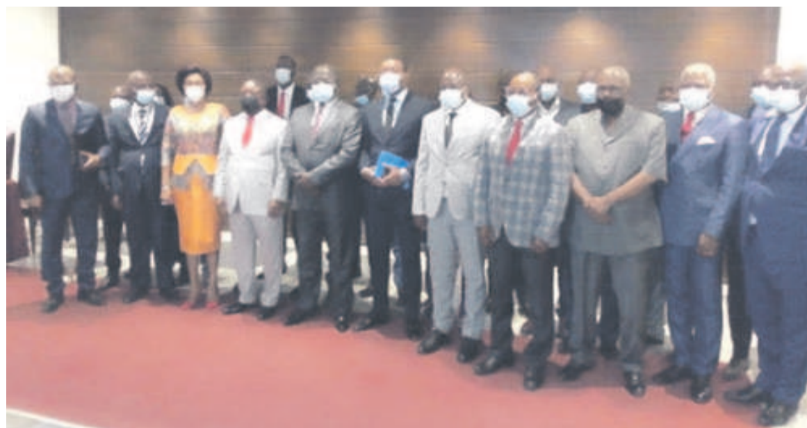
Les participants à l'atelier Adiac

Ainsi, le programme de cet atelier offre aux participants la possibilité d'une parfaite maîtrise des dispositions relatives à la composition du domaine forestier national et sa gestion, de l'exploitation économique du domaine forestier de l'Etat et la transformation du bois, du calcul de l'assiette et la liquidation des taxes et redevances auxquelles sont assujetties l'exploitation et