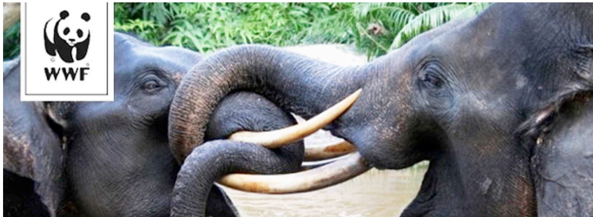
les éléphants, des animaux menacés pour leurs défenses.

Des magistrats, le personnel judiciaire ainsi que des cadres des administrations et services publics dont la douane, l'Agence nationale de renseignement, Interpol, l'armée, la police, l'Institut congolais pour la conservation de la nature, les officiers de police judiciaire de l'environnement, etc. ont participé, le mois de juin courant, à Mbandaka, province de l'Equateur, à un atelier de renforcement de leurs capacités dans la lutte contre le braconnage et le trafic illégal de l'ivoire. Cette activité organisée par Juristrale et financée par le Fonds mondiale pour la nature (WWF) rentre dans le cadre du volet « Renforcement des capacités des magistrats » du partenariat entre ces deux institutions dont l'autre le volet vise l'application de la loi. « Je voudrais remercier Juristrale et tous ses partenaires, en l'occurrence l'ICCN et WWF, d'avoir songé à associer ceux à qui la loi a donné mission d'appliquer et de dire le droit, sans distinguer les uns et les autres, parce que c'est ensemble que nous devons affronter le défi qui est devant nous. Comment concilier l'impératif de la conservation de la nature et les problèmes suscités par les criminalités fauniques ? Voilà une formulation qui interpelle toute âme consciencieuse », a indiqué le président de la Cour d'appel de Mbandaka, à l'ouverture de ces travaux. Pour lui, s'engager contre la criminalité faunique, pour l'environnement et la conservation de la nature, c'est en réalité retrouver l'espoir pour le futur.