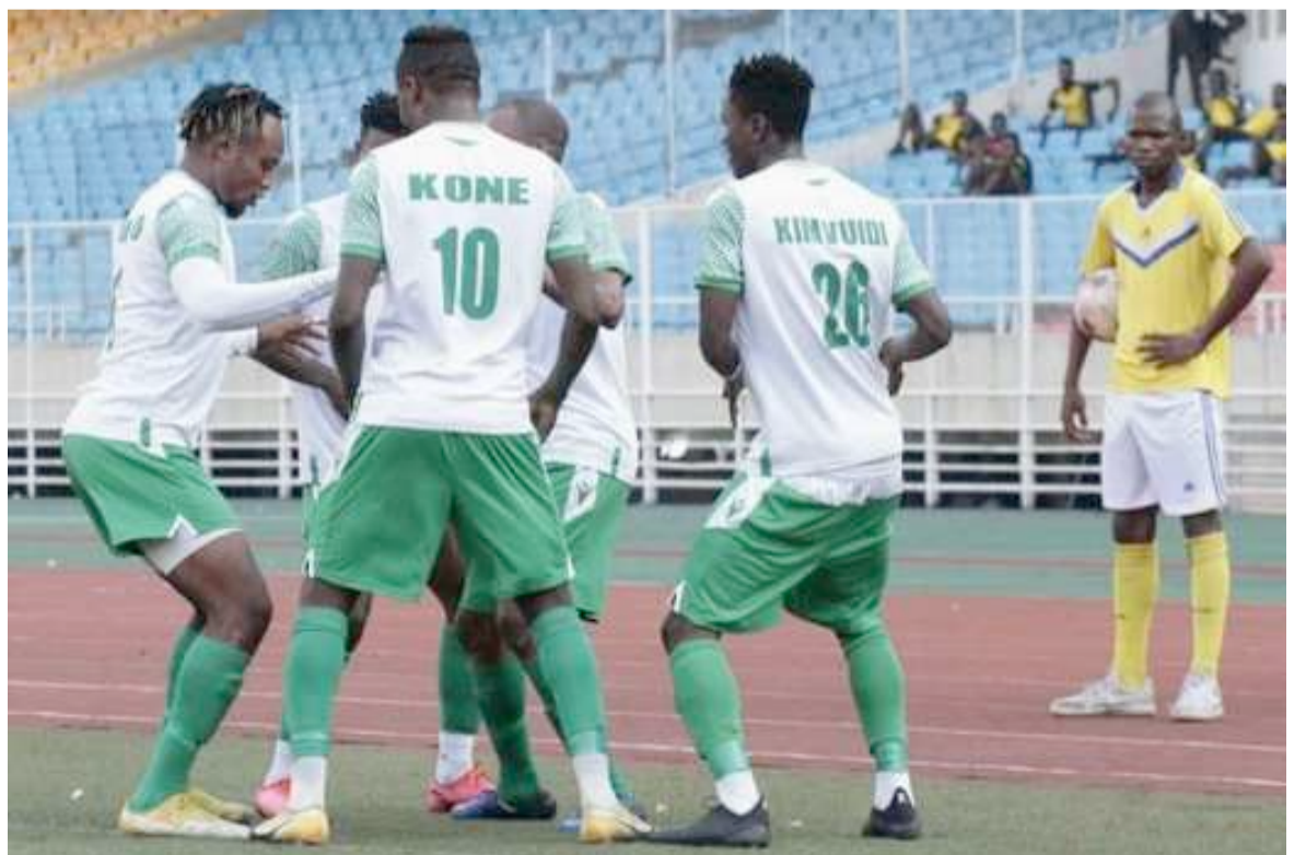
DCMP qualifié pour les quarts de finale de la 56e Coupe du Congo de football

Dans une autre rencontre importante disputée le 20 juin au stade des Martyrs, Sa Majesté Sanga Balende de Mbuji-Mayi, tombeur du FC Saint-Eloi Lupopo (aux tirs au but après un nul de zéro but partout) et le CS Don Bosco de Lubumbashi se sont quittés sur le nul vierge de zéro but partout à l'issue de la fin du temps réglementaire. A cause de l'insuffisance de la lumière, la séance des tirs au but a été reporté au 21 juin sous