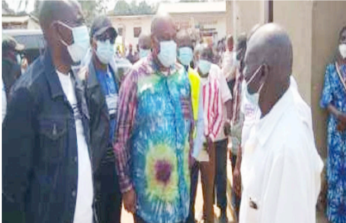
Le ministre de la Santé publique, Hygiène et Prévention en mission au Kongo central