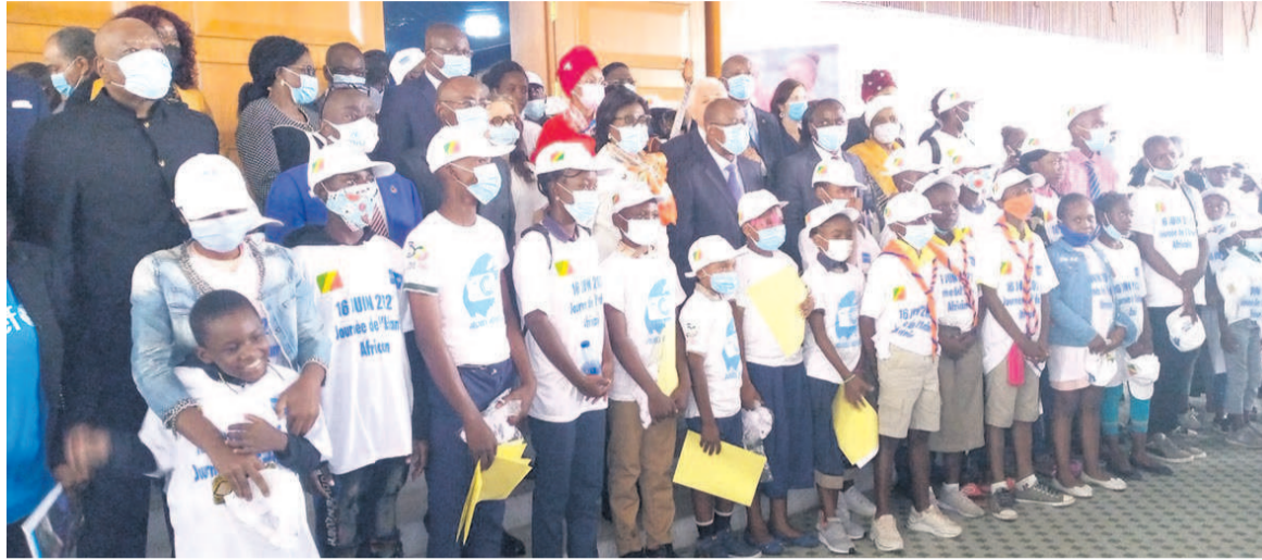
Les officiels posant avec les les enfants (Adiac)

Selon elle, la journée de l'enfant est une occasion