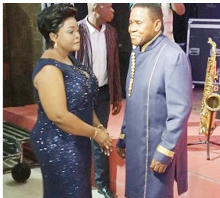
Verckys Kiamuangana ouvrant le bal pour ses 77 ans

C'est aussi soixante ans de carrière musicale active que l'homme aux poutons d'acier a célébré au cours de la fête organisée dans son quartier général. « Soyez béni », est le souhait émis par le patriarche et octogénaire Jeannot Bombenga à l'endroit de Verckys. Il ne s'est pas contenté de chanter mais il a aussi dansé sur les airs des tubes Mado et Africa Mokili mobimba pour faire honneur à un homologue et à un