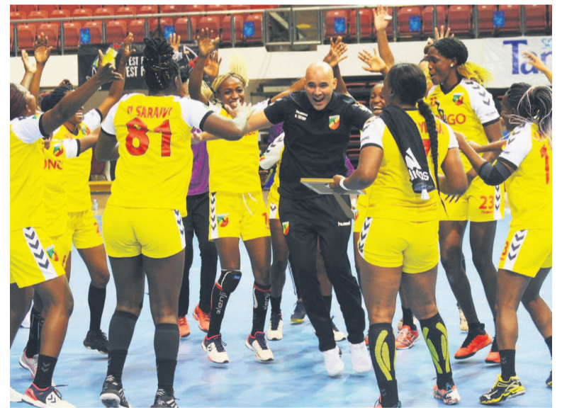
Le Congo affronte la Tunisie aujourd'hui

Battu 21-22, le 16 juin à Yaoundé par le Cameroun lors des demi-finales de la 24 e édition de la Coupe d'Afrique des nations (CAN), le Congo affronte la Tunisie ce 18 juin à 15h afin de disputer la troisième place de la compétition.