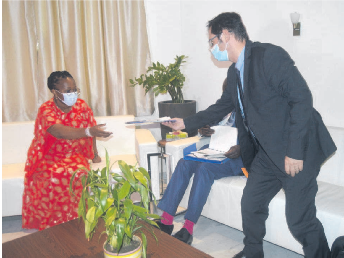
La ministre en charge des PME et la délégation de Saris-Congo

« L'idée est de faire fonctionner toutes ces activités en même temps et de promouvoir le développement de la production locale »