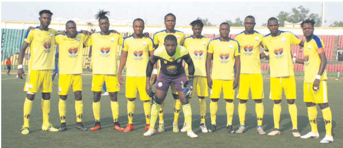
L'AS Otohô championne du Congo pour la 4 e fois

L'As Otohô n'avait besoin que d'un point pour être mathématiquement sacrée championne du Congo. Les tenants du titre l'ont fait mieux d'ailleurs puisqu'ils ont battu, le 16 juin au stade Alphonse-Massamba-Débat, l'Etoile du Congo 2-0 en match comptant pour la 23 e journée du championnat national.