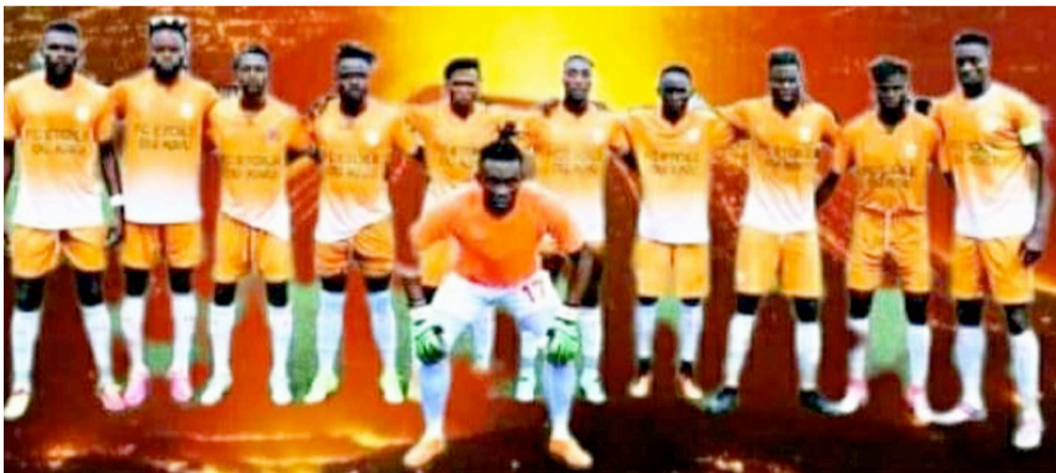
La formation d'Etoile du Kivu, tombeur de l'AS Mapenzi

La 56e édition de la Coupe du Congo de football continue son bonhomme de chemin avec des rencontres des éliminatoires qui se jouent à Kinshasa, avant d'arriver à la phase finale. Deux rencontres ont eu lieu, le 17 juin, au stade des Martyrs à Kinshasa.