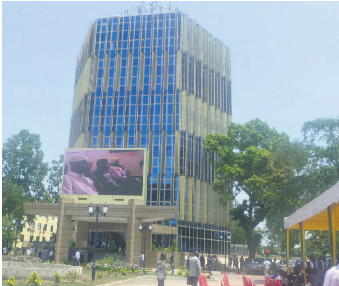
Façade principale du ministère de l'Aménagement du territoire, des Infrastructures et de l'Entretien routier

« Depuis un moment, nous vivons une situation sociale difficile au BCBTP. A la date d'aujourd'hui, nous sommes à 21 mois d'arriérés de salaire. A peine une semaine, on nous a versé un demi salaire sur l'ensemble des mois dus. Hormis cela, on ne nous paye pas les cotisations sociales. Il y a quelques semaines, notre syndicat avait amorcé des ré-