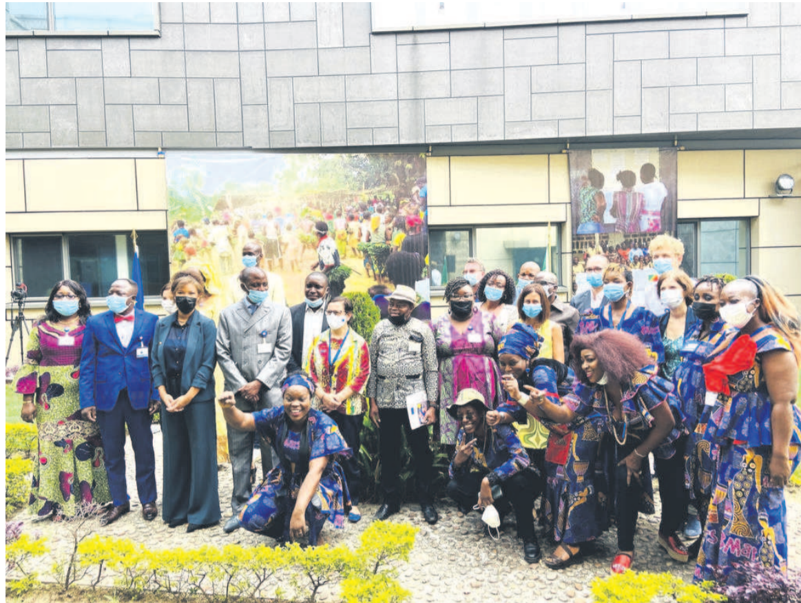
Les officiels et les participants après la présentation des projets

Ces projets sont soutenus dans le cadre de deux instruments financiers dédiés aux organisations de la société civile no-