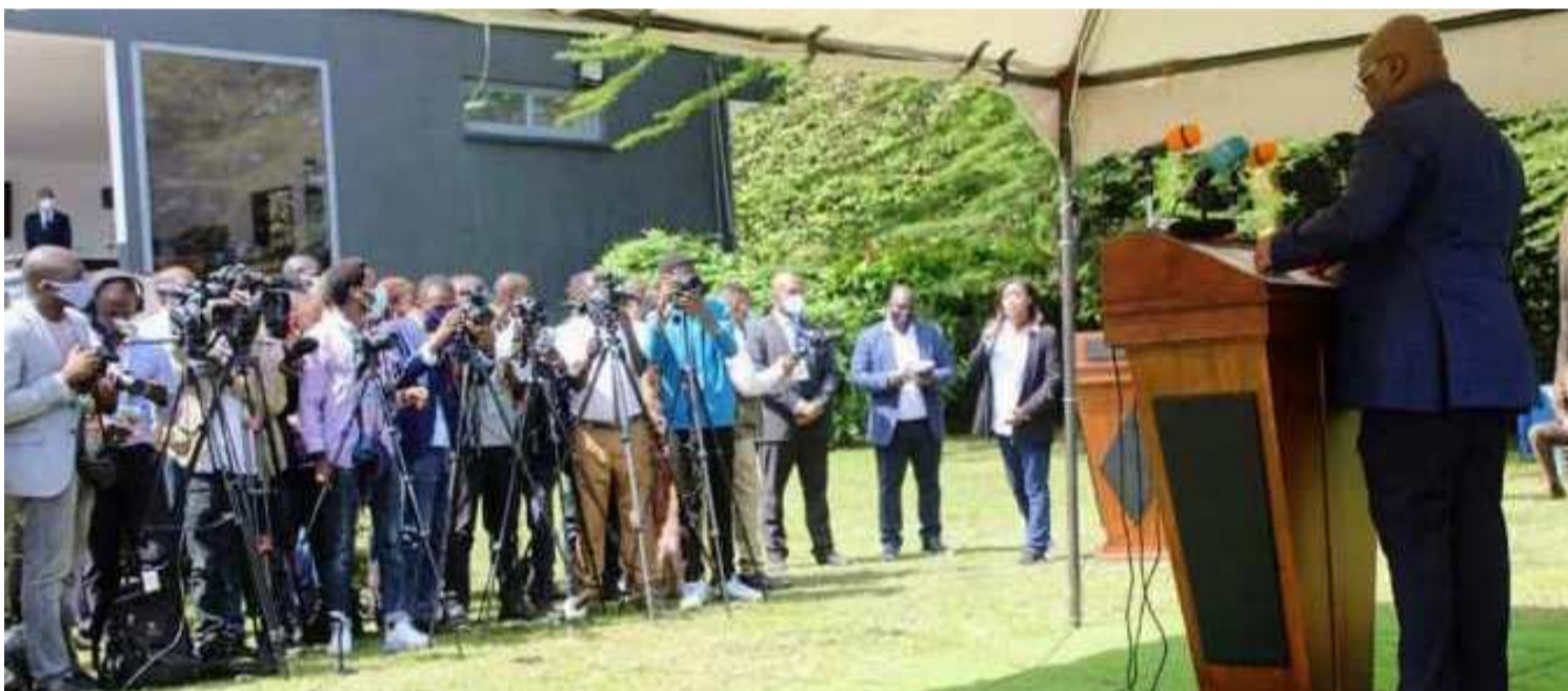
Félix Tshisekedi s'adressant à la presse locale à Beni