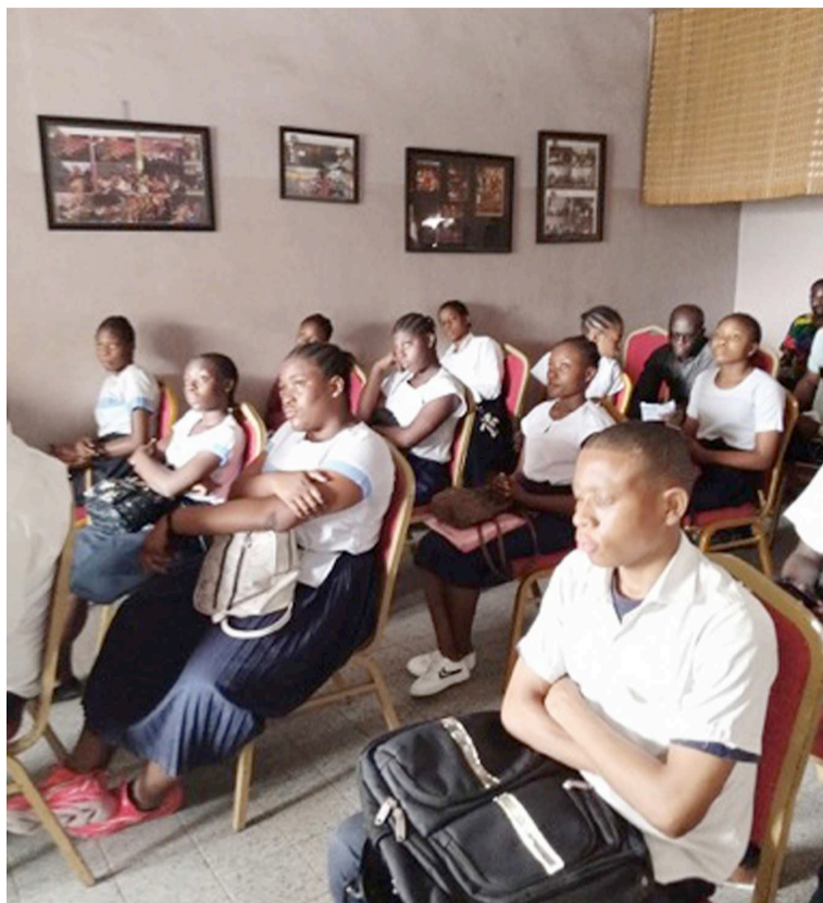
Les élèves de l'Inas captivés sont toute ouïe (Adiac)

Ce n'est donc pas de façon docturale qu'il s'est adressé aux élèves, la relève. En effet, le conteur qui dit avoir constaté, vu de l'extérieur, que « notre culture est en perte de sens » a dès lors invité les jeunes à lui emboîter le pas. « Être écrivain, ce pourrait être juste recueillir les contes. Ce soir, demandez à votre maman de vous raconter les contes de sa jeunesse, écrivez-les », a-t-il suggéré. De manière pratique, il a incité à ne pas laisser brûler les bibliothèques, quitte à « récolter auprès des vieux ce qu'ils savent » avant qu'ils ne passent de vie à trépas. Le naturel de l'artiste est un atout qui réussit à emporter ses auditeurs dans l'univers qu'il leur révèle, le sien, avec un humour et une autodérision qui le rend attachant. La sincérité de l'auteur qui transparaît dans ses propos crée la sympathie de ses auditeurs. Les lecteurs de son premier ouvrage qui met à nu un talent pur, sans fard qui se contente de tout dire