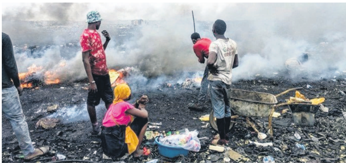
Une décharge d'objets électroniques

Selon ce rapport, environ douze millions de femmes travaillent dans le secteur informel des déchets, ce