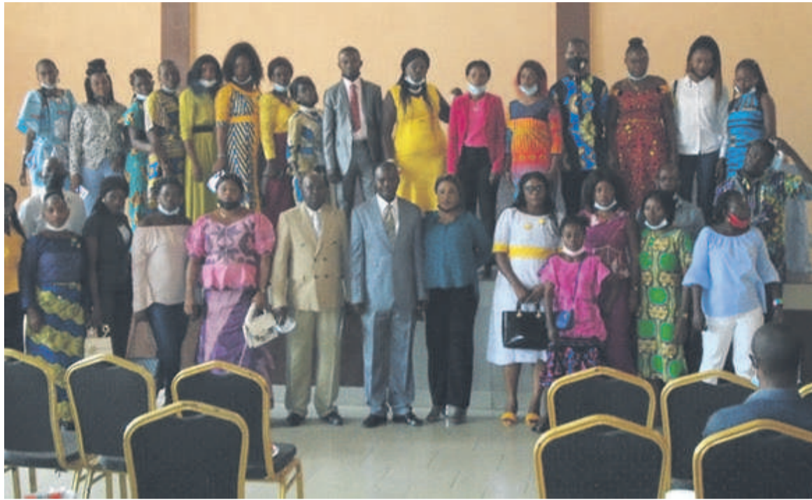
Les participants après le lancement du projet Adiac

En dehors des élèves, le personnel enseignant du secteur public comme celui du secteur privé sera aussi pris en compte dans ce projet à travers la couverture médicale mise en place par l'Adéco qui sollicite pour cela l'appui des partenaires nationaux et in-