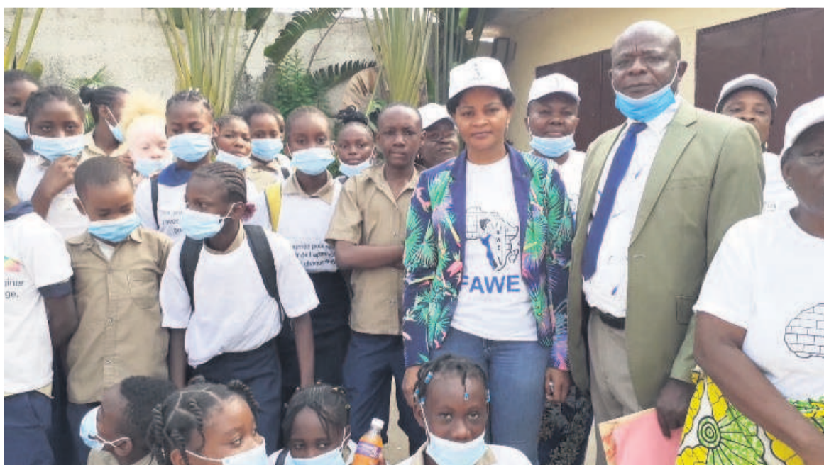
La présidente du Fawe-Congo en compagnie des élèves

Le Fawe-Congo s'est arrangé à faire en sorte que cette célébration cadre avec le thème retenu pour la circonstance : « Art, culture et patrimoine ». C'est donc par les arts plastiques que les