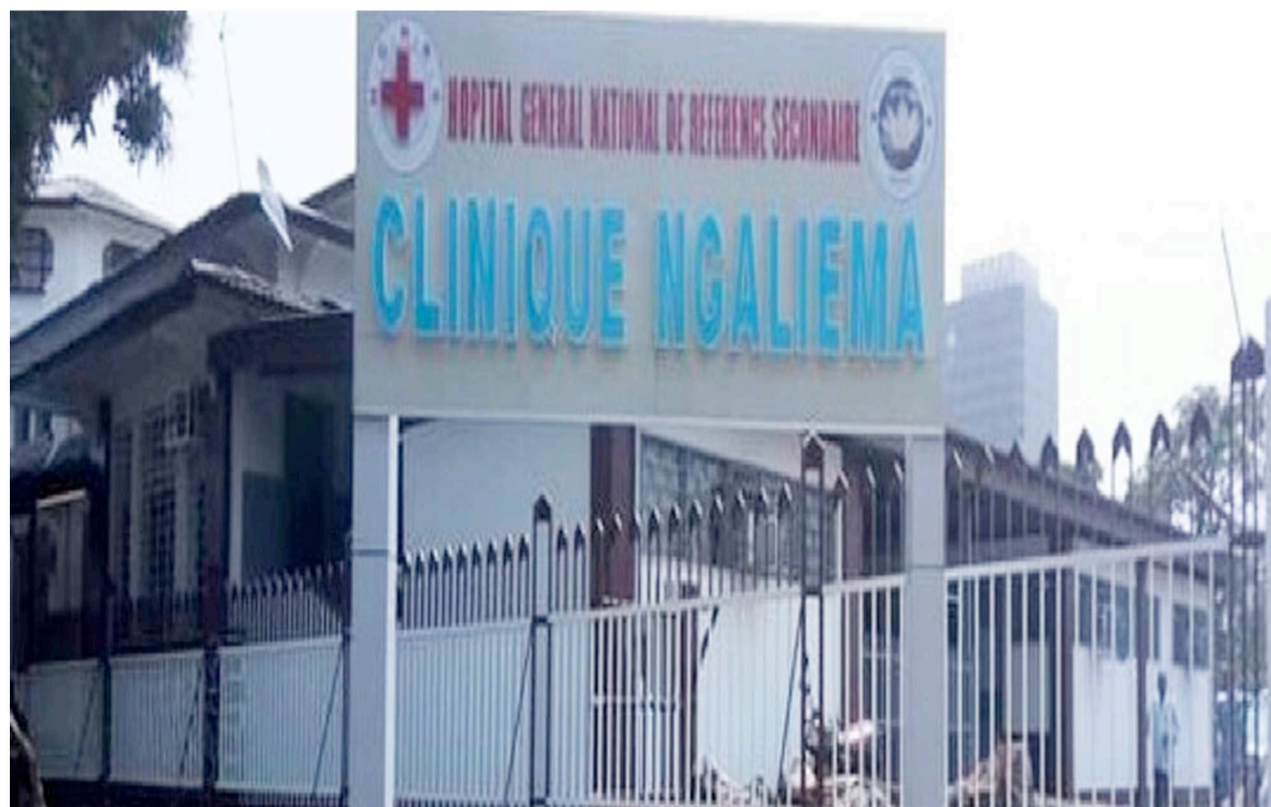
Les professionnels des hôpitaux publics en grève

Le syndicaliste n'est pas allé par le dos de la cuillère pour faire porter le chapeau à l'ancien ministre de la Santé, le Dr Eteni Longondo, qui n'avait jamais pris en compte leurs desiderata préférant partager l'enveloppe allouée à la prime des risques entre eux les médecins. " Il y a eu un budget de rémunération. Dans cette rémunération, ce n'est pas le salaire de base mais la