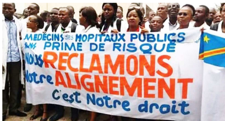
Le personnel médical lors d'une manifestation à Kinshasa

Bien qu'ils aient été reçus par le ministre de la Santé publique, le Dr