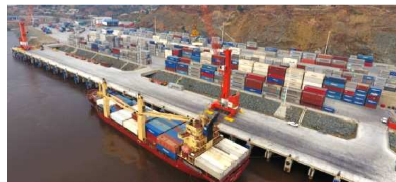
Le port maritime de Matadi en RDC

Avec l'adhésion de la RDC, du Burkina Faso et du Maroc, l'Africa finance corporation (AFC) dépasse les trente Etats membres et plus de la moitié des pays africains en sont désormais membres, indique l'institution dans un communiqué publié le 9 juin. Fondée en 2007 dans le but de stimuler les investissements du secteur privé dans les