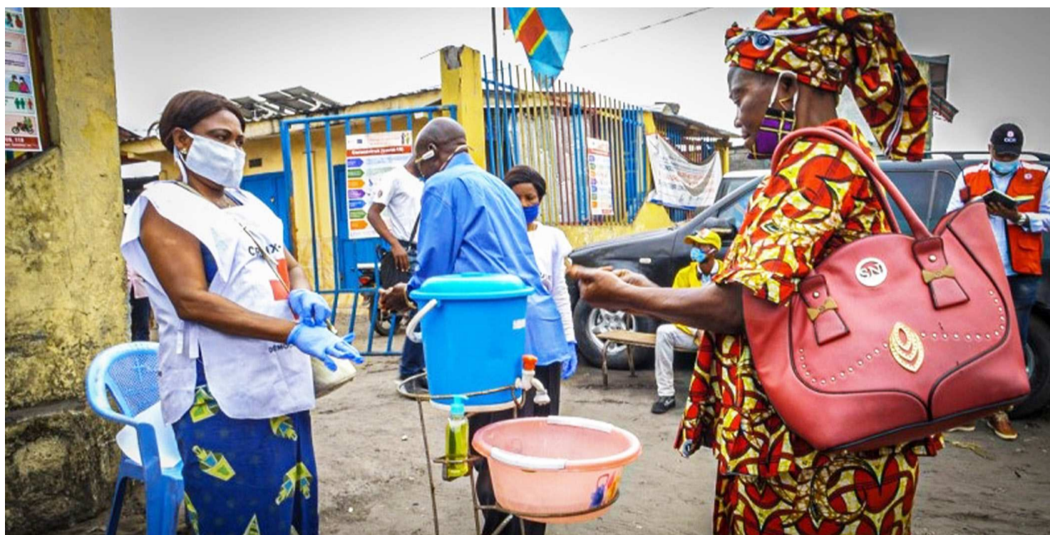
Il est recommandé le respect strict des gestes barrières

Le chef de l'Etat, Félix-Antoine Tshisekedi, a annoncé le 15 juin, quelques nouvelles mesures visant à lutter contre la troisième vague de covid-19 qui sévit au pays depuis début juin. Ces mesures, avec effet immédiat, résultent de sa récente concertation avec la Task force de la Présidence et le secrétariat technique de lutte contre la pandémie.