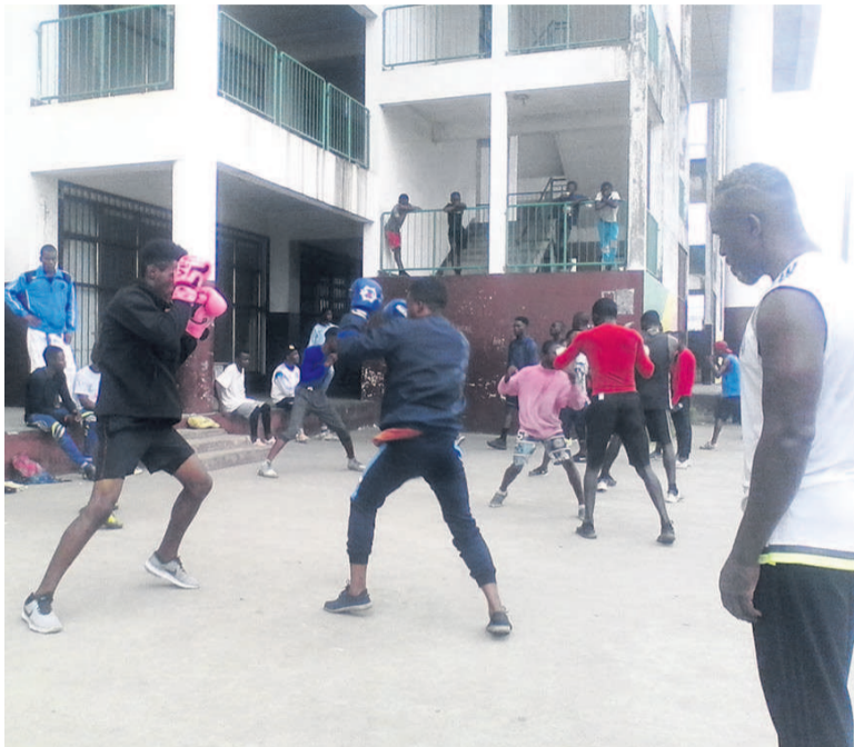
Les boxeurs ponténégrins pendant les entraînements

En attendant la reprise effective des activités de la boxe au niveau national, les compétiteurs de certains clubs de la ville océane s'entraînent tous les dimanches à l'esplanade du complexe sportif pour garder la forme.