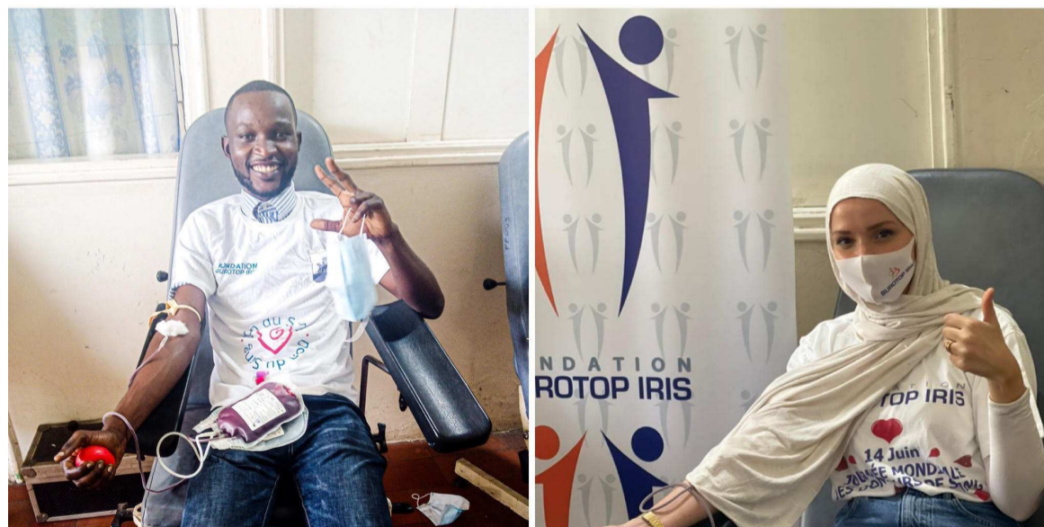
Des membres de la Fondation en train de donner leur sang Adiac

« Nous sensibilisons les personnes à donner le sang pour sauver des vies. Donner du sang sécurisé est un acte citoyen et noble. Le sang n'a pas de substitut, en donner aux autres est un geste généreux ; c'est ainsi que nous