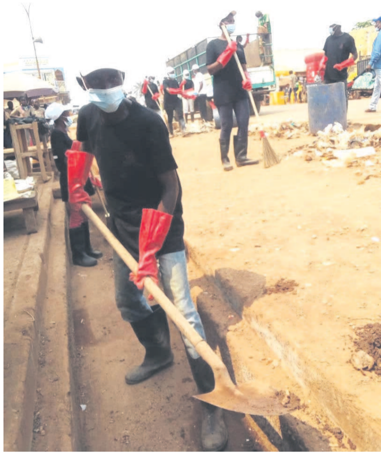
L'entretien des caniveaux par les volontaires

« Après cinq ans d'attente du projet, la population de Nkayi peut enfin voir le bout du tunnel. Le lancement du programme “villes résilientes” ce