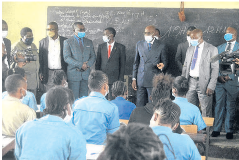
Le ministre exhortant les élèves à la discipline déjà sécurisées.

Il y a quelques jours, en effet, de graves incidents sont survenus dans cet établissement scolaire, suite à l'affrontement des gangs des jeunes écoliers. La police y a remis de l'ordre. Ainsi, le ministre de l'Enseignement préscolaire, primaire, secondaire et de l'Alphabétisation a effectué une descente pour rassurer les élèves en classe de passage, qui sont en train de composer, que des me-