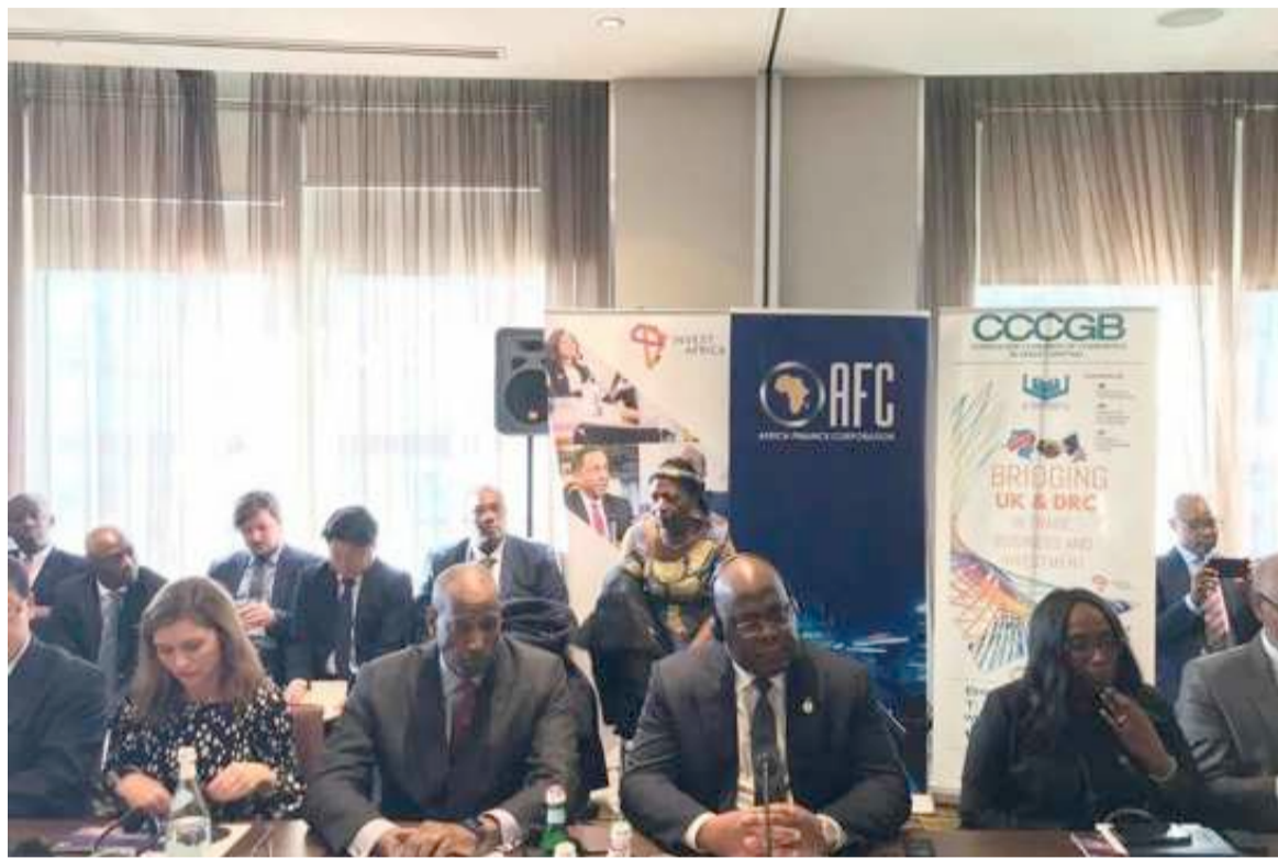
Le président Félix Tshisekedi lors d'un événement organisé par l'AFC