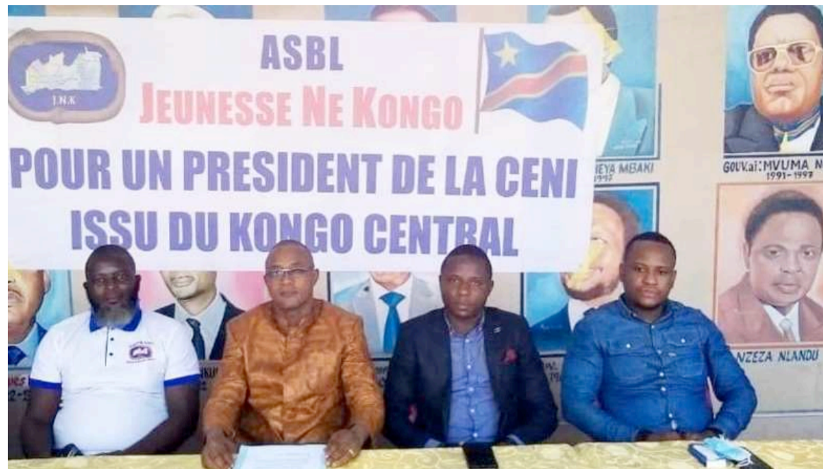
Lecture de cette déclaration au Centre culturel Ne Kongo, à Kasa-Vubu.

Evoquant la dernière institution en date à pourvoir, la centrale électorale, cette association attire l'attention des délégués des confessions religieuses pour prendre en compte l'équilibre géos-