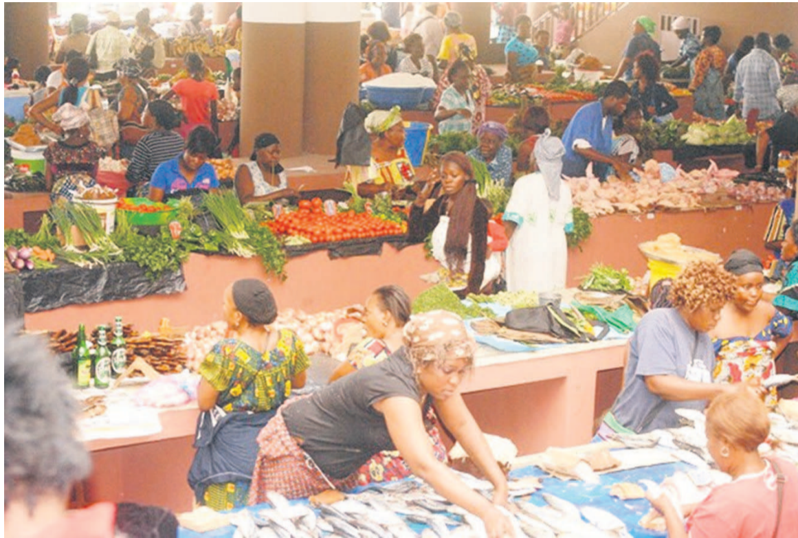
Le nouveau marché Total à Bacongo, 2 e arrondissement de Brazzaville-DR

Certains secteurs représentent de véritables opportunités. C'est le cas de l'agro-industrie. Mais « elles sont nombreuses », a dit Arnaud Floris. « Mais le secteur agro-industriel implique non seulement la production mais aussi tous les aspects relatifs au développement, une filière agroalimentaire qui va de la sélection des matières