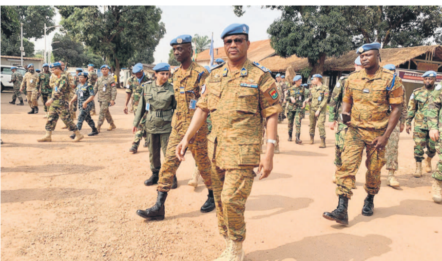
Le nouveau commandant de la Force de Minusma

Le 7 juin, le colonel Assimi Goïta est devenu le nouveau président de la transition à Bamako et Choguel Maïga a été nommé le même jour Premier ministre. Ce dernier a annoncé la formation de son gouvernement le 11 juin. Ces