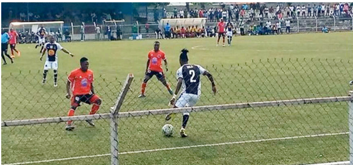
Mazembe a broyé du noir à Goma face à Dauphin Noir