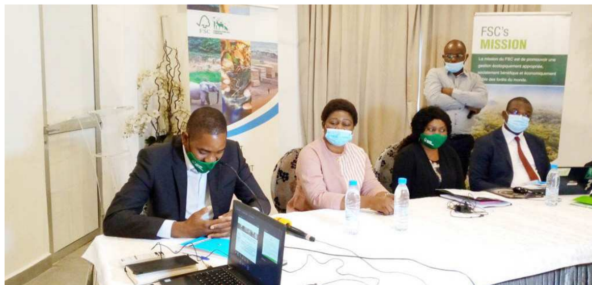
Podium officiel lors du séminaire