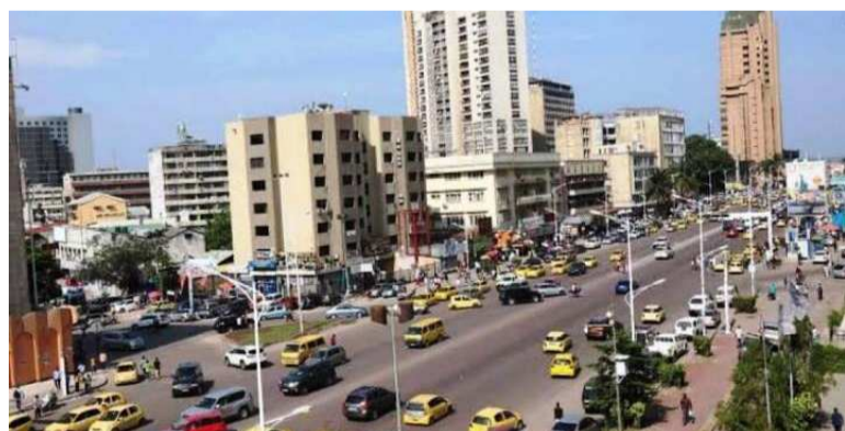
Le centre des affaires à Kinshasa

Reçue le 19 mai par la vice-Pre-mière ministre, ministre chargée