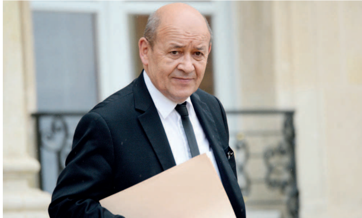
Jean-Yves Le Drian

à l'Unesco, en sachant que le Congo intégrerait son conseil, cette année.