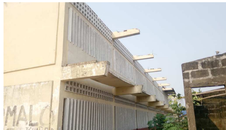
Une vue partielle des bâtiments endommagés

Le vent violent ayant accompagné la pluie qui s'est abattue sur Brazzaville le 18 mai a emporté les toitures des bâtiments du collège d'enseignement général public Maurice Lheyet Gaboka et une dizaine d'habitations environnantes du cinquième arrondissement, Ouenzé.