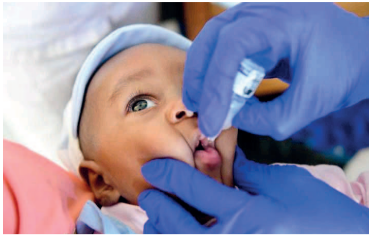
Vaccination d'un enfant