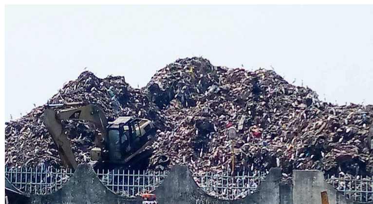
Les immondices à Mpila

A Brazzaville, le refus du passage des camions bennes remplis des déchets par La Congolaise des routes (LCR) exigeant le paiement des frais de péage à Lifoula a occasionné un débordement d'immon-