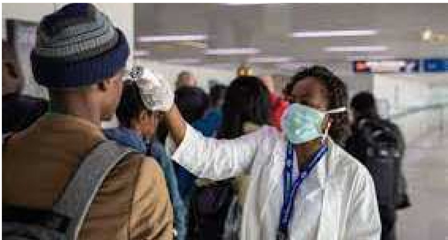
Prise de température d'un sujet à risque.

Selon la mise à jour fournie à la date du 19 mai, mille patients supplémentaires sont sortis guéris. Ces personnes sont essentiellement de Kinshasa et des différentes provinces touchées par la pandémie. Avec ce nombre, le cumul de personnes guéries en RDC passe à vingt-sept mille six cent trois. Ce qui représente un taux de guérison de 90%. Pour ce qui est de la vaccination, 14.434.000 personnes ont été vaccinées avec la première dose du vaccin AstraZeneca. Ces données proviennent des différents sites de vaccination de Kinshasa et des provinces ayant lancé leurs campagnes de vaccination contre le coronavirus.