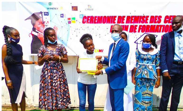
Le coordonnateur du CAMI remettant l'attestation à une apprenante

tificat de qualification professionnel. Il s'est agi des filières ci-après : infographie ; développement Web ; Réseau informatique ; secrétaire administratif ; assistant comptable ; assistant des ressources humaines ; assistant commercial ; assistant logistique et transport ; amadeus et HSE (hygiène, sécurité, environnement).