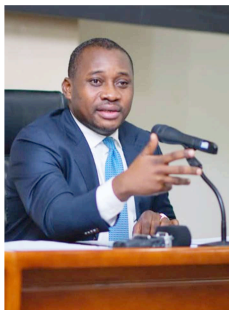
Le ministre d'Etat de l'Aménagement du territoire, Guy Loando Mboyo