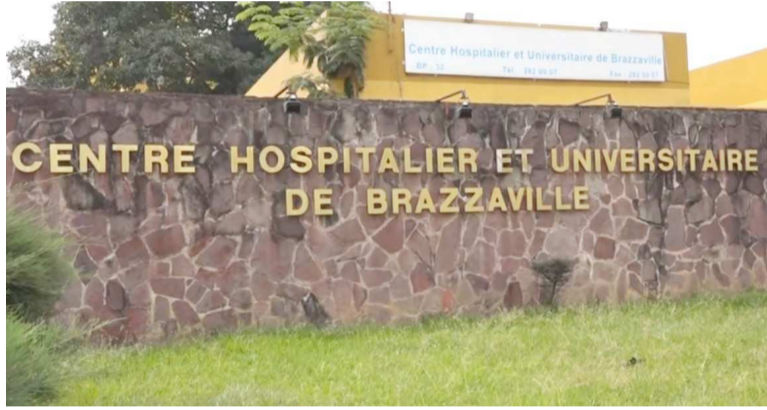
Une vue du CHU-B

jour de l'entrée en vigueur de la grève générale et illimitée, les malades ont afflué comme d'habitude, les travailleurs retenus pour le service minimum étaient eux aussi au rendez-vous. Il est