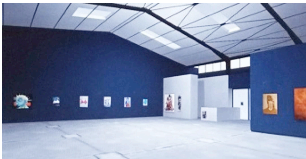
Vue partielle de l'exposition virtuelle Mke (Adiac)

La pandémie de covid-19 n'arrête pas la créativité artistique, au contraire ! Obligés de se réinventer pour continuer à créer, mais ensuite où montrer le résultat de plusieurs heures de travail où l'inspiration mêlée à une once de fantaisie produit des merveilles ? Tous les plasticiens congolais n'ont pas eu cette chance d'exposer pendant un mois et demi comme l'ont fait les sept jeunes participant à l'exposition Mke. En effet, grâce à Kub'Art Gallery, ils ont eu droit à cette exposition virtuelle inédite visitée sur www.kubart.gallery et dont le catalogue a été consulté par plusieurs sur www.kubart.gallery/expo-mke21/