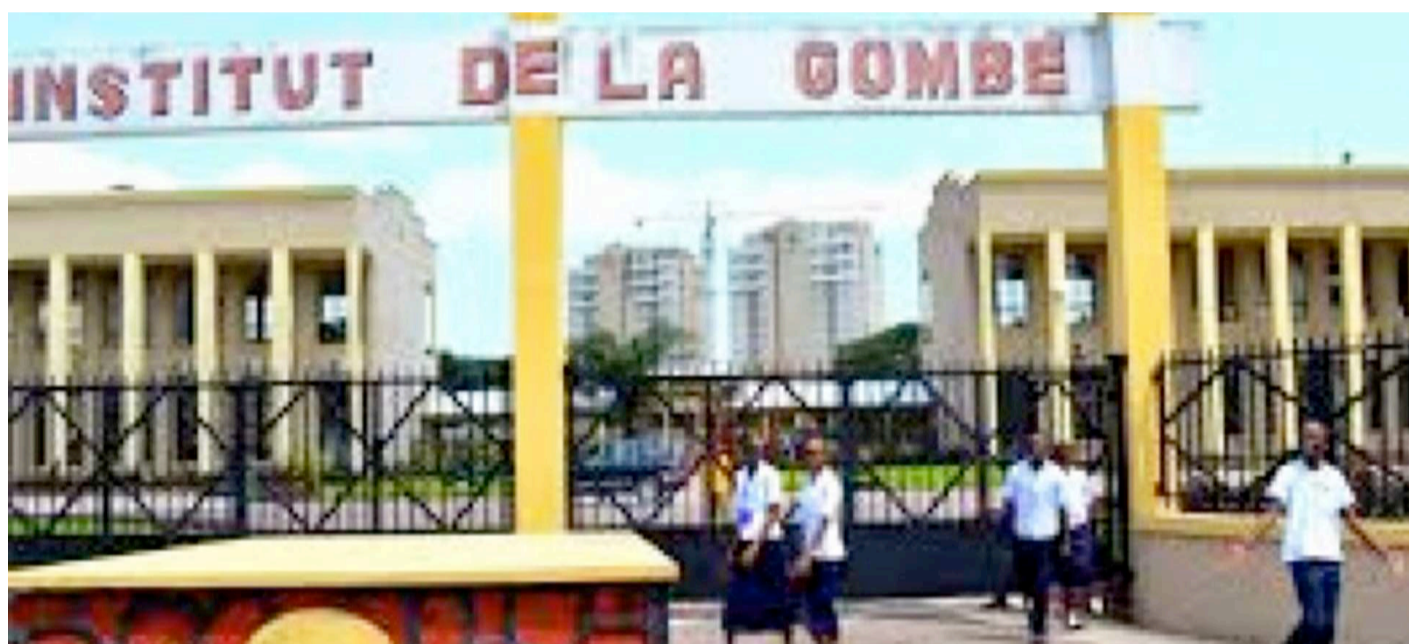
Une école publique de Kinshasa/DR