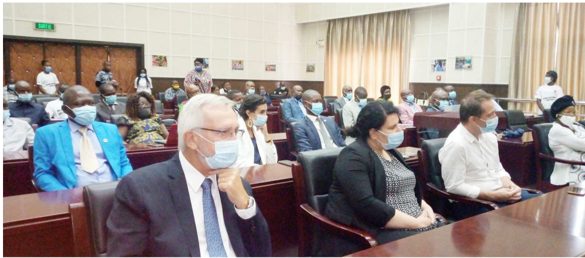
Les volontaires de la Croix-Rouge (Adiac)

Le président de la Croix-Rouge congolaise, Christian Sédar Ndinga, a réitéré le 8 mai son engagement à œuvrer au côté des pouvoirs publics. C'était lors de la célébration de la Journée internationale de la Croix-Rouge congolaise et du Croissant-Rouge sur le thème « Ensemble, nous sommes inarrêtables ».