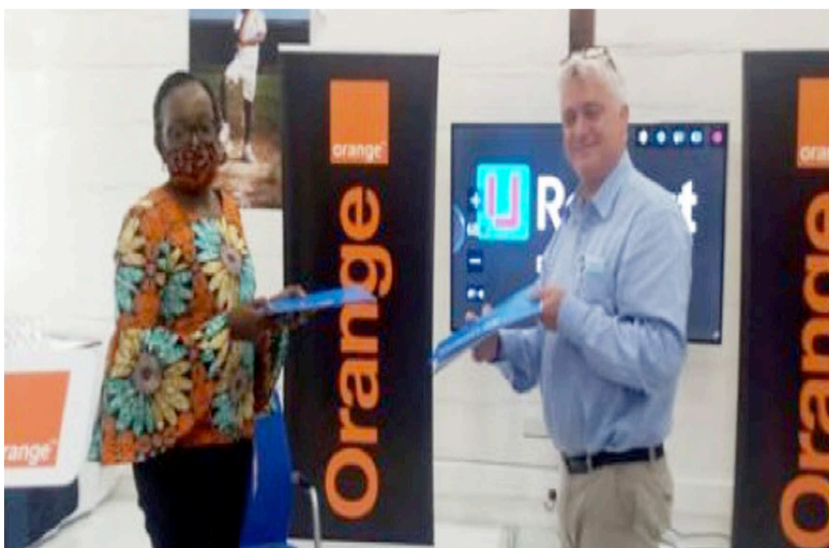
Echange des documents entre Unicef et Orange

U-Report est une plateforme sociale développée par l'Unicef, déjà disponible dans soixante-dix-neuf pays à travers le monde avec plus de 14 millions d'utilisateurs dont plus de 930.000 en République démocratique du Congo (RDC). Grâce à cet accord,