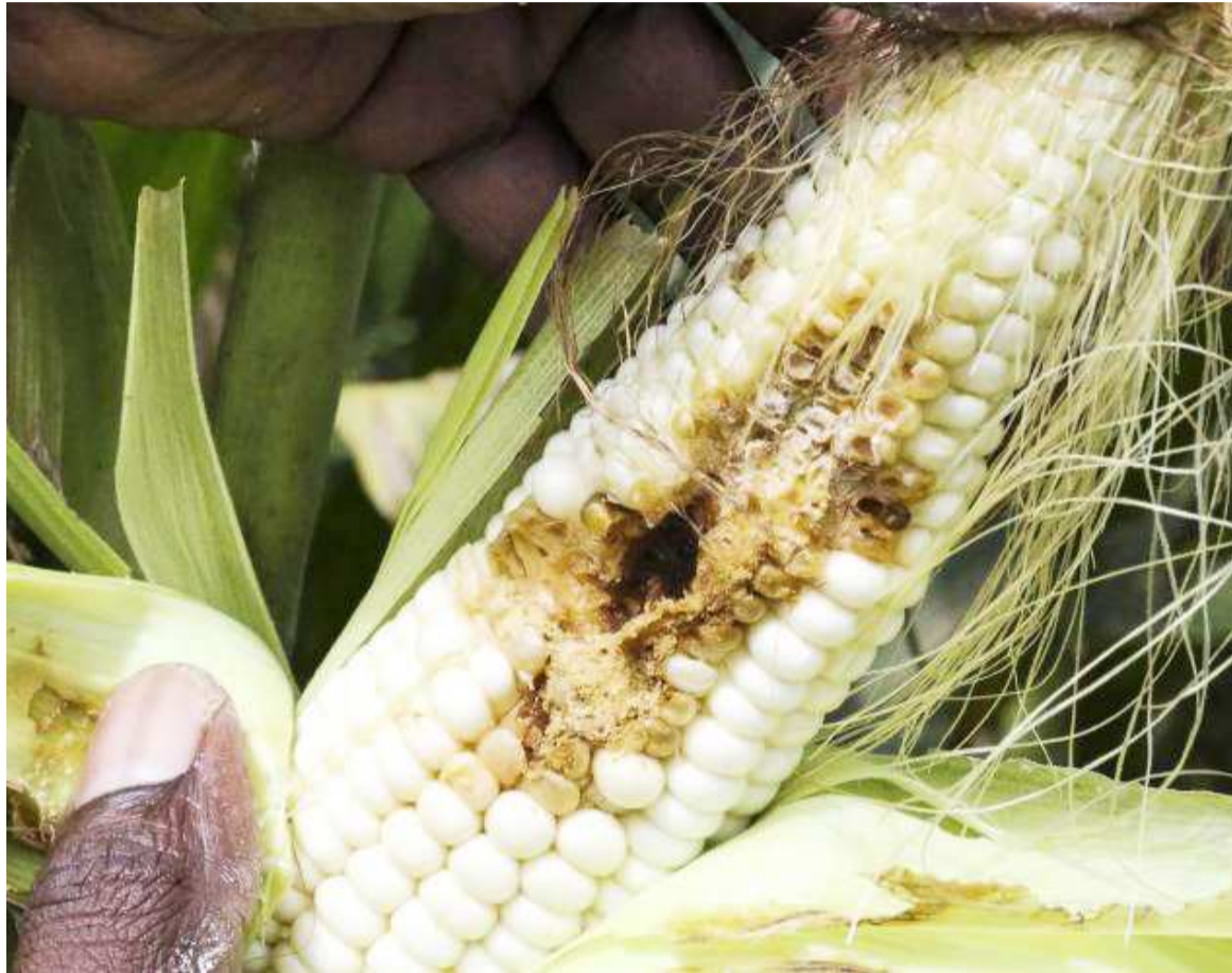
Une récolte de maïs ravagée par des chenilles légionnaires

directeur général adjoint de la division de production et protection des plantes à la FAO, les petits producteurs sont les principales victimes de ces importants dégâts causés par la chenille légionnaire. Ces chenilles sont non seulement pré-