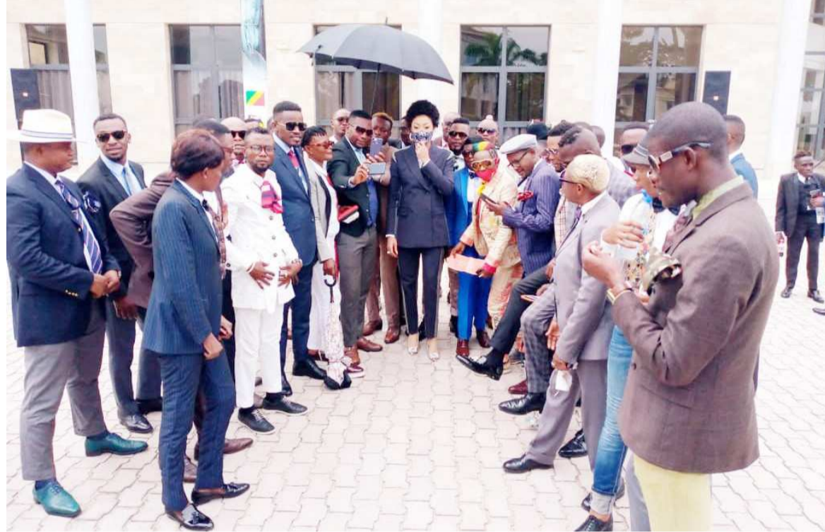
la directrice générale du Mémorial Pierre Savorgnan de Brazza posant avec les sapeurs