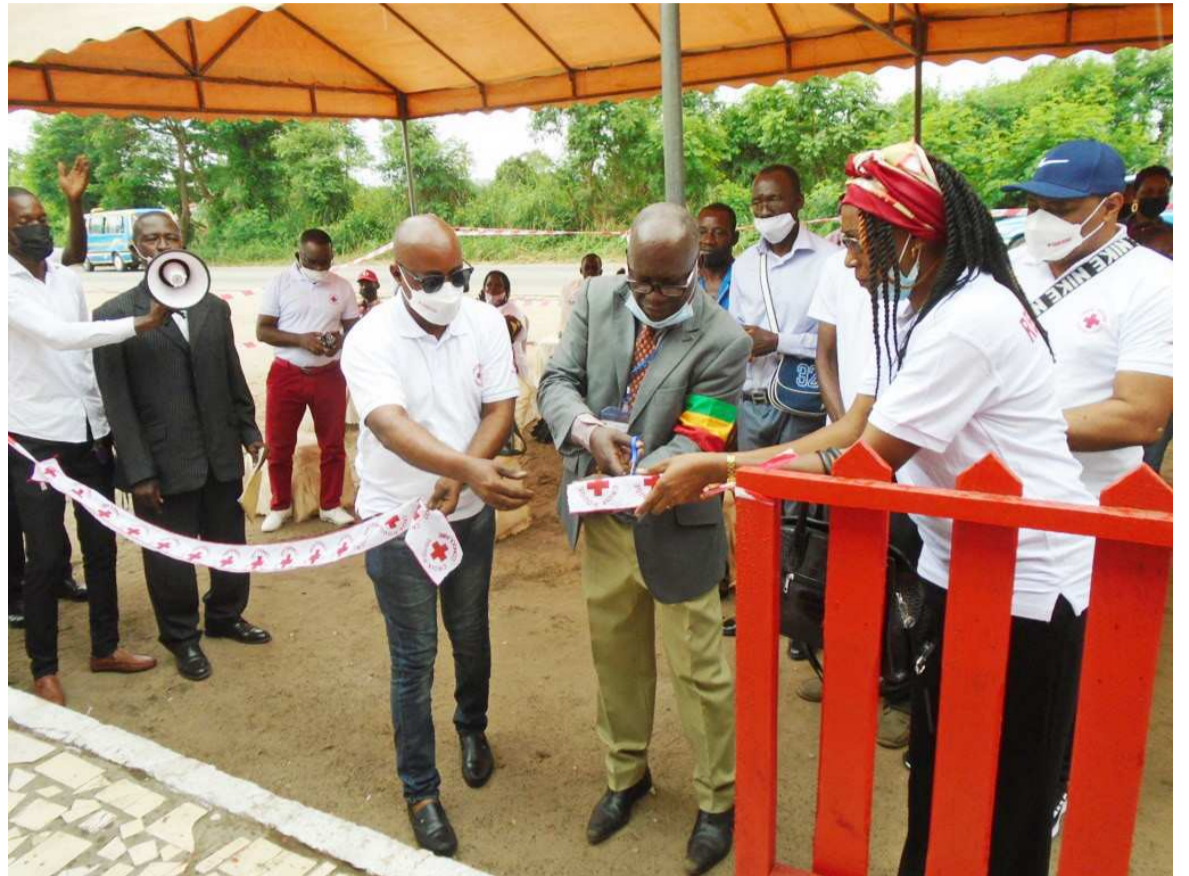
La coupure du ruban par le maire de Ngoyo

Signalons que toujours dans le cadre cette célébration, une matinée de nettoyage de la Côte sauvage a été organisée, le 7 mai, par les volontaires et secouristes de la Croix-Rouge congolaise. Quarante-cinq volontaires de tous les arrondissements de la ville et du district de Tchiamba Nzassi ont pris part à cette activité d'assainissement du littoral qui a été ainsi débarrassé ainsi des détritus et déchets divers. « Cette activité répond à