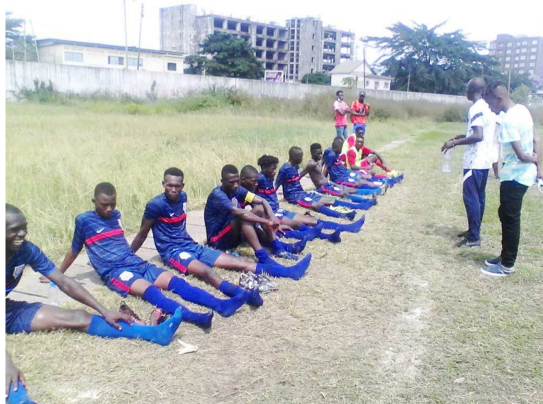
Les joueurs de l'ASP recevant les consignes de l'entraîneur à la mi-temps