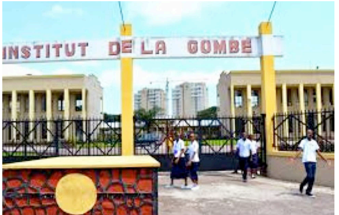
Une école publique de Kinshasa DR

A en croire ce communiqué, cette augmentation, qui vise notamment l'amélioration de la qualité de l'enseignement, interviendra progressivement.