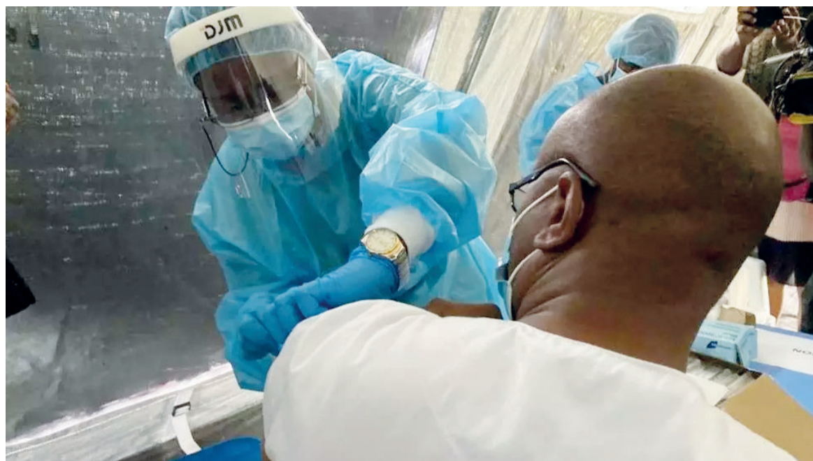
Une personne administrait la vaccination de la Covid-19

Cinquante-neuf nouveaux cas ont été confirmés dans les provinces touchées par cette pandémie. La ville de Kinshasa vient en premier