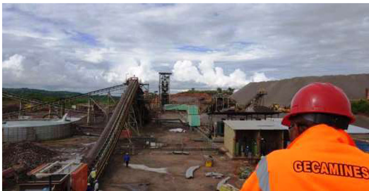
Un site minier de la Gecamines