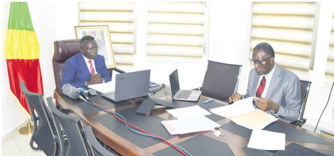
Le ministre délégué au Budget (en bleu) lors de la visio-conférence

pensable et urgent, pour toute institution, d'inscrire ses actions de mobilisation des ressources propres et externes dans le long terme, de penser et actualiser, si nécessaire, sa stratégie afin de mobiliser des financements durables pour mener efficacement ses missions statutaires », a poursuivi