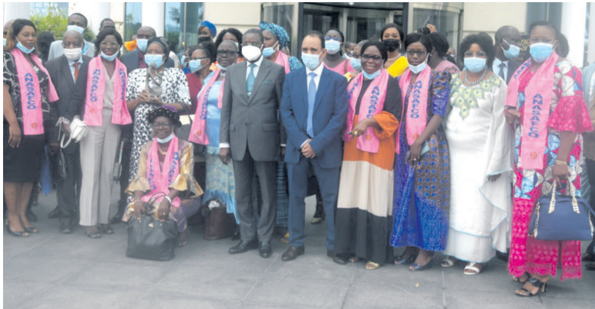
Les sages-femmes et les partenaires