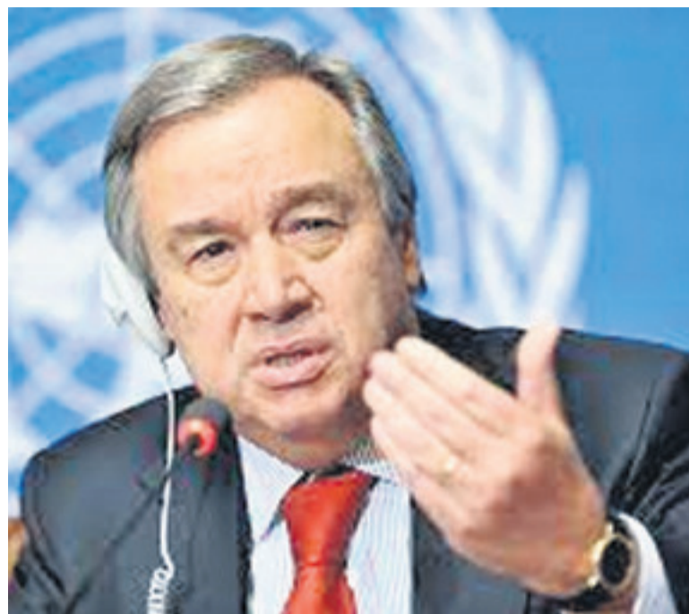
Le secrétaire général des Nations unies Antonio Guterres

Le secrétaire général a exprimé l'espoir que «dans les jours à venir, les Tchadiens seront en mesure de trouver, ensemble, un chemin consensuel et pacifique vers l'avenir».