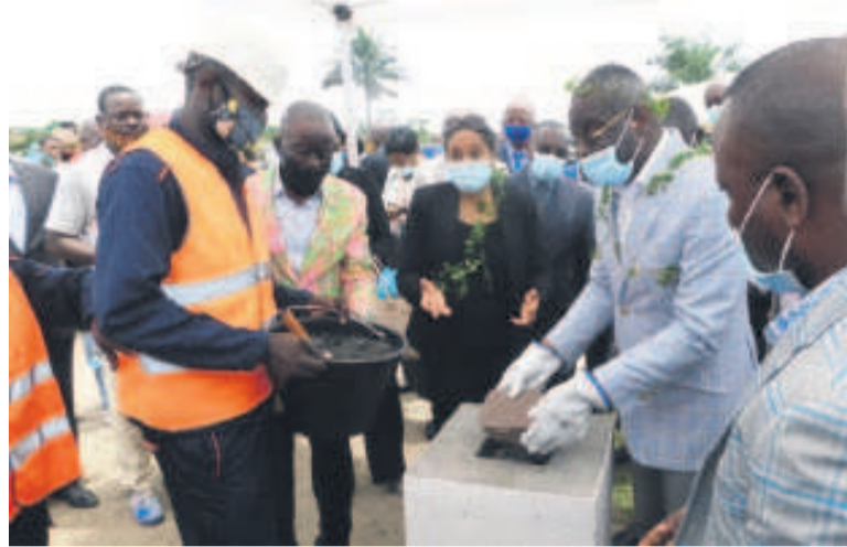
Pose de la première pierre pour la construction de l'ouvrage

L'extension de l'établissement scolaire de l'ancien village riverain de Pointe-Noire, devenu quartier du sixième arrondissement, est en cours.