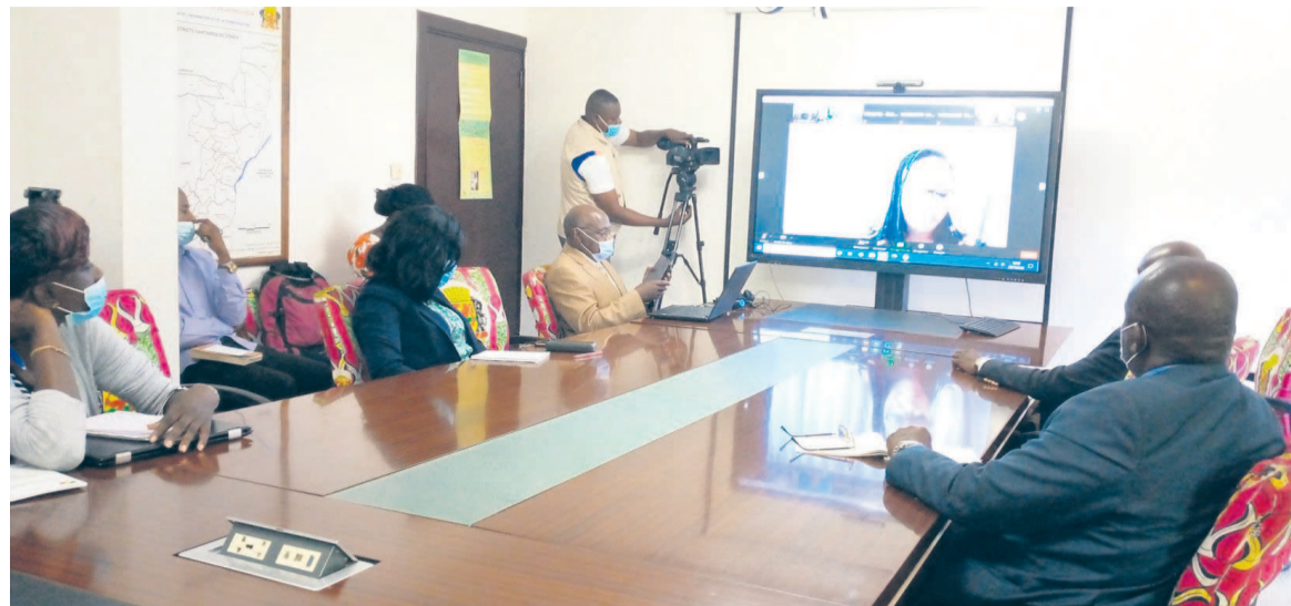
les agents du ministère la santé suivant en direct la visioconférence de la soixante dixième session de l'OMS/Afrique (Adiac)

renforcement du processus et des mécanismes d'accès au vaccin contre la pandémie, le partage des informations inhérentes à la gestion de la pandémie au niveau des nœuds transfrontaliers.