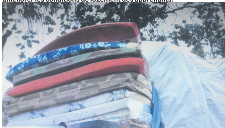
Un lot de matelas offerts à l'ENI de Dolisie

Le ministère de l'Enseignement technique et professionnel, de la Formation qualifiante et de l'Emploi a mis à la disposition des internats des écoles de formation de l'arrière-pays des équipements destinés à améliorer les conditions de logement des apprenants.