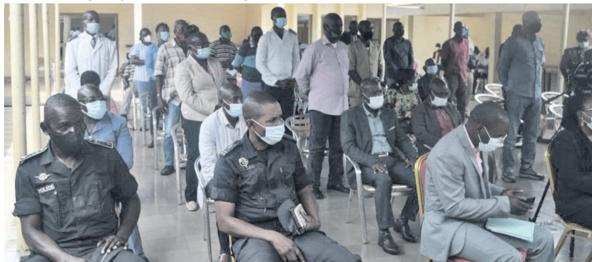
Les membres du comité de certification à l'écoute de la ministre des Affaires sociales

Au nombre des ménages pauvres et vulnérables enregistrés dans le premier arrondissement de Nkayi, il y a 1053 dossiers qui inspirent le doute tandis qu'au deuxième arrondissement le chiffre atteint 1499.