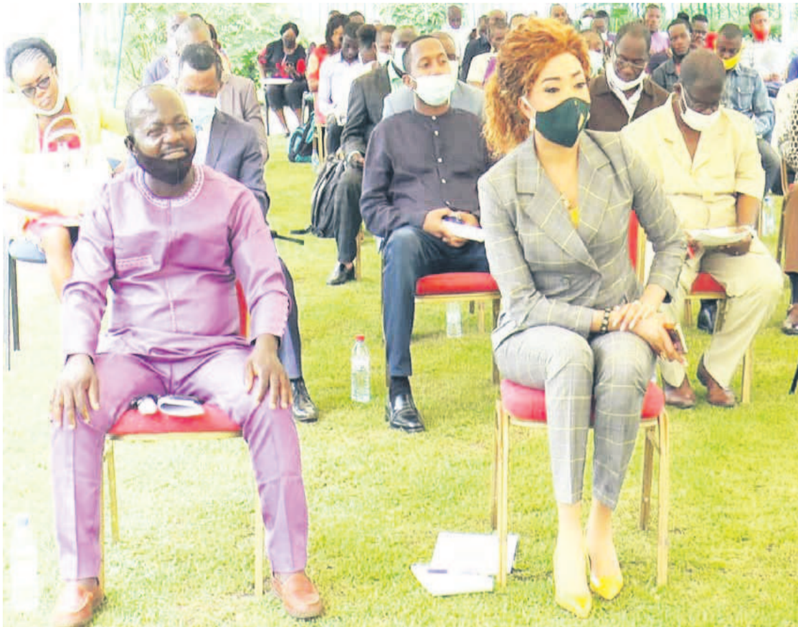
L'assistance suivant la conférence