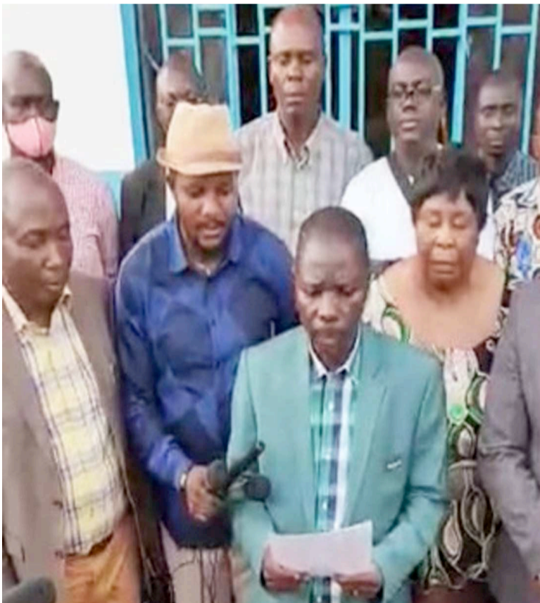
Le président de la Fondation katangaise lisant la déclaration

L'ASBL regroupant l'ensemble des communautés socio-culturelles de la province du Katanga vient de donner sa position par rapport aux consultations initiées par le chef de l'Etat, Félix Tshisekedi, pour trouver la solution à la crise politique qui ronge actuellement le pays.