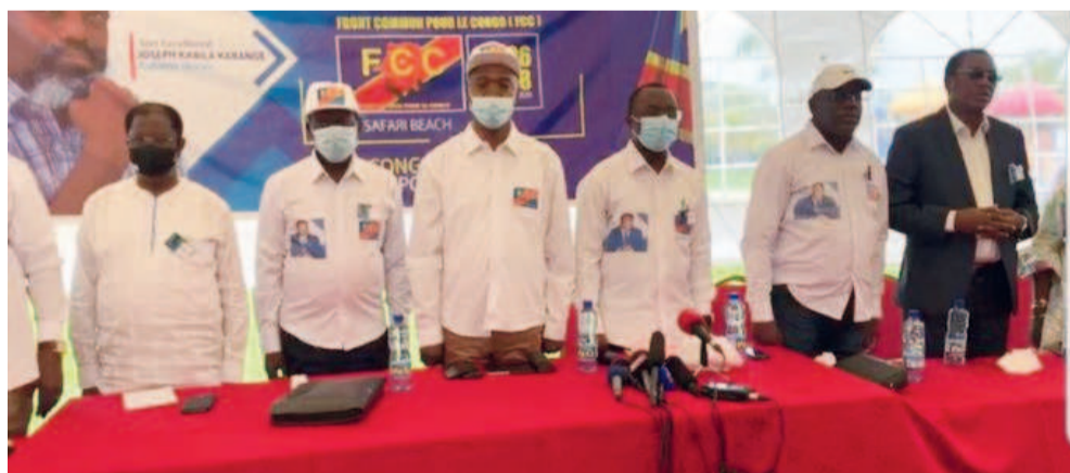
Les membres du FCC en retraite politique

Le FCC réitère son refus de reconnaître les trois juges investis à la Cour constitutionnelle