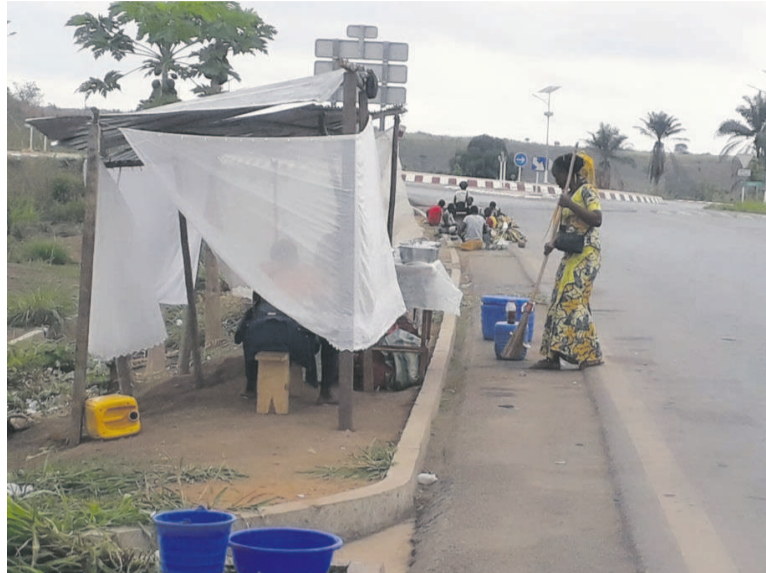
Un des restaurants de fortune près de la chaussée sur la route nationale n°1

« Je me suis installée ici parce que c'est un carrefour qui mène dans plusieurs communautés urbaines : Sibiti, Nkayi, Loudima. Les clients viennent nombreux. Certes nous sommes exposés mais nous fai-