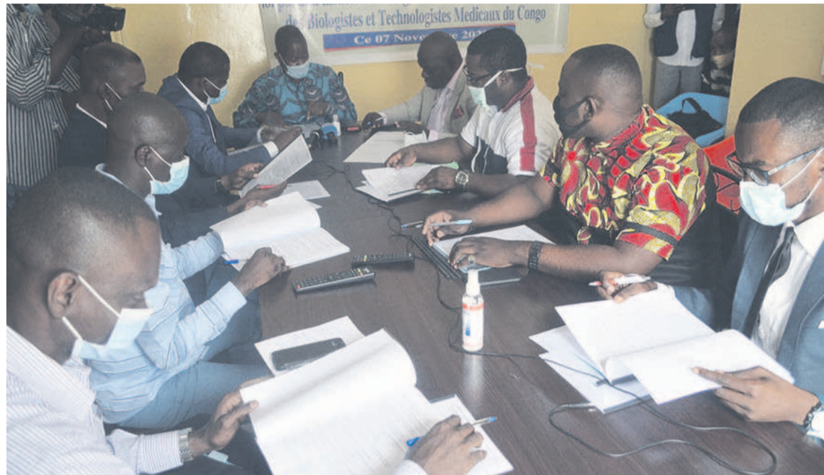
Les biologistes en atelier

« L'Ordre professionnel des biologistes et technologistes médicaux du Congo vise le contrôle à l'accès à l'exercice