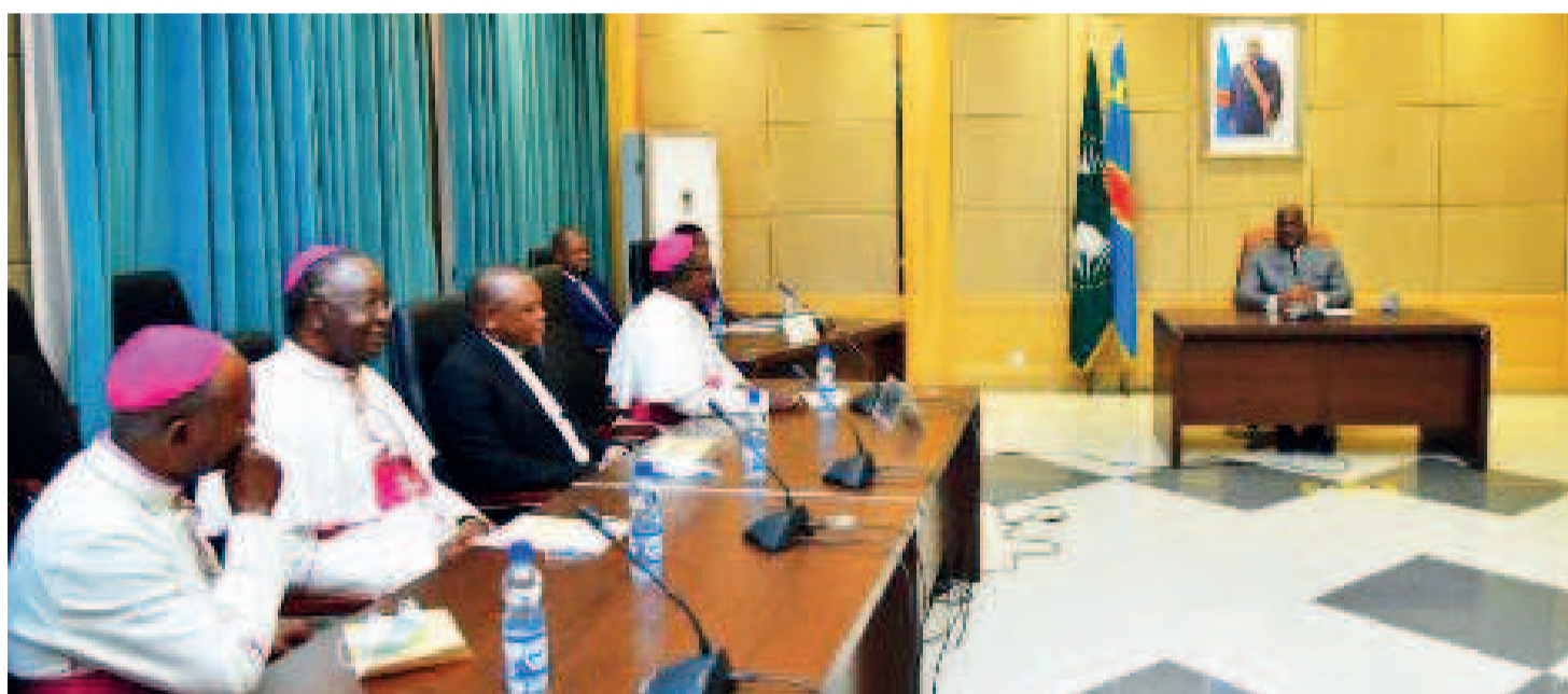
Les prélats catholiques s'entretenant avec le chef de l'Etat.

Une délégation des évêques catholiques membres de la Conférence épiscopale nationale du Congo (Cénco) était le 9 novembre au Palais de la nation où elle a conféré avec le chef de l'Etat, Félix-Antoine Tshisekedi, dans le cadre des consultations des forces politiques et sociales en cours.