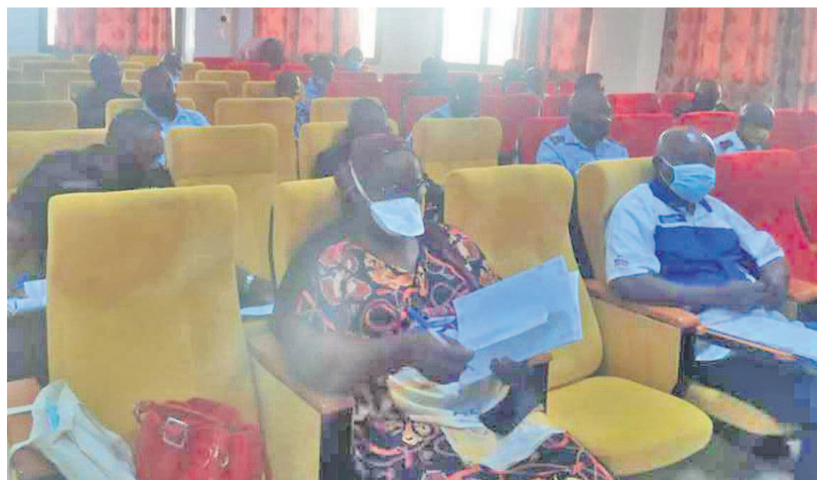
Des participants à l'atelier de formation

Ces guichets qui collaborent avec les commissariats de quartiers de police et les brigades de gendarmerie, jouent un rôle majeur dans la prévention et la prise en charge des femmes victimes de violences. Au travers de ce programme, l'ambassade de France a al-