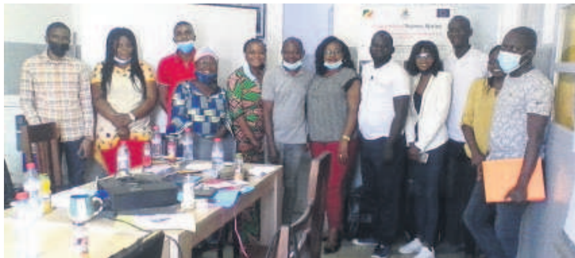
Une vue des journalistes

Sous la supervision du Samusocial de la ville océane, les membres du Club des journalistes ambassadeurs des droits de l'enfant ont échangé, le week-end dernier, leurs points de vue sur les activités prévues par le Samusocial durant la campagne de vulgarisation de la loi portant protection de l'enfant en République du Congo, qui a débuté le 1er novembre et se poursuit jusqu'au 31 décembre.