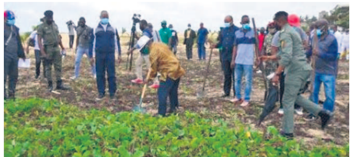
Les autorités locales pendant la journée nationale de l'arbre

Le Conseil départemental et municipal de Pointe-Noire a, dans le cadre du projet vert, procédé le 6 novembre au planting de quelque cinq cent quatre vingts arbres sur les boulevards Moe-Kaat-Matou et Linguissi-Tchicaya, dans le premier arrondissement Emery-Patrice-Lumumba.