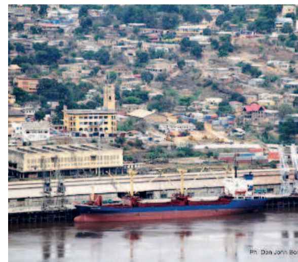
Une vue du port de Matadi.

Selon ces sources, ces employés du port international de Matadi préconiseraient, en revanche, le maintien, sans condition, de l'actuel gestionnaire, qui aurait fait preuve d'une capacité managériale no-