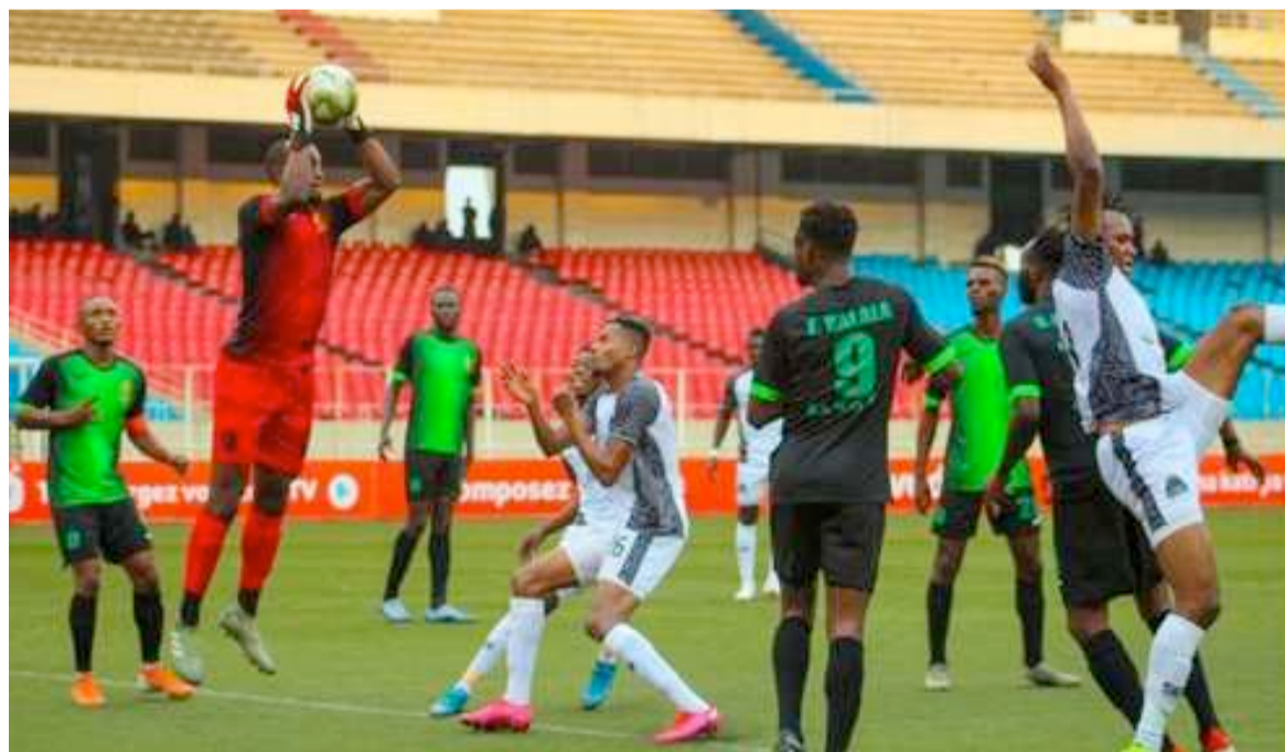
Une action lors du match V.Club contre Mazembe