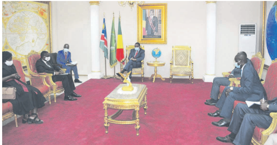
Entretien entre les deux personnalités

Sur le plan économique, ce dernier a rappelé la campagne de sensibilisation organisée par l'ambassade, portant sur les opportunités en Namibie ainsi que la visite de travail en Namibie des chefs d'entreprises congolaises. Du côté namibien, une trentaine des chefs d'entreprises ont également visité le Congo. « Tous s'intéressent à l'agriculture, au bois, au mine, au tourisme, à l'hôtellerie etc. Et de nombreux accords ont été si-