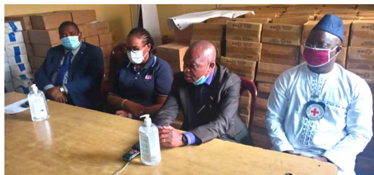
La délégation de la Croix-Rouge lors de la remise de matériel de protection

La remise du don intervenue le vendredi dernier permettra à la zone de santé de Kingabwa de prévenir et de lutter contre plusieurs maladies dont la pandémie de covid-19 auxquelles ladite zone fait face. Procédant à la remise de cette dotation, le président de la Croix-Rouge a indiqué que l'une des missions assignées à son organisation est de prévenir et de lutter