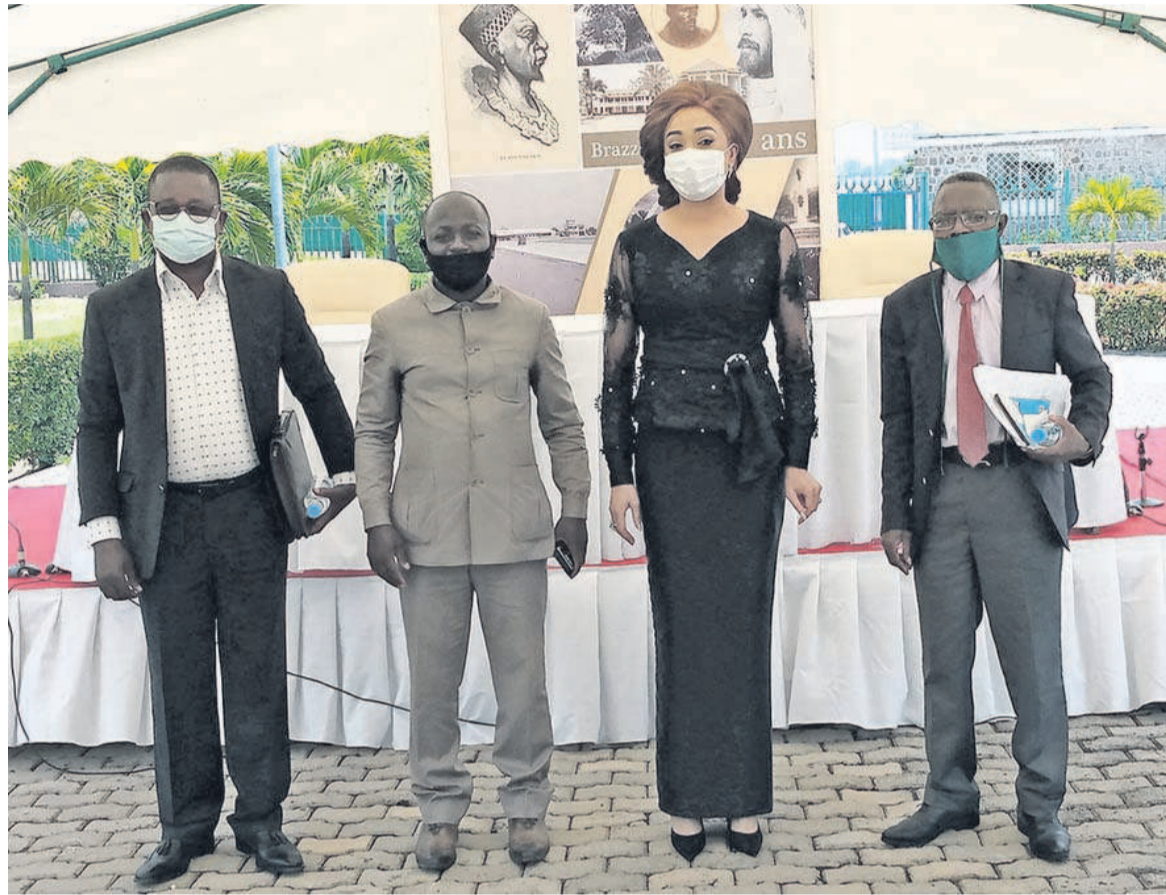
La directrice du mémorial posant avec les conférenciers

« Nous sommes aujourd'hui dans une situation fortement anxieuse et de stress généralisé où notre psychisme est hanté, à travers les images terrifiantes venant de l'Europe et fortement chargées par l'angoisse de mort face à un danger mortel que produit l'effroi, la peur, le désarroi et qui pourrait, dans des cas extrêmes, provoquer des pathologies associées d'ordre psychosomatique. Toutes les barrières qui canalisent et régulent notre comportement au quotidien tombent et, avec elles, la perte des repères ... ».