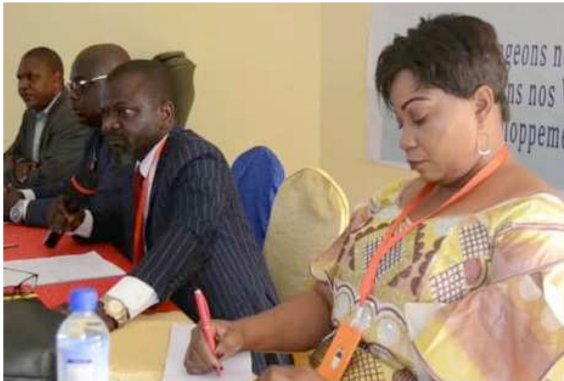
Des participants à l'atelier de vulgarisation de la Pnat à Kolwezi

Ces ateliers ont aussi permis aux participants de mieux comprendre le concept Aménagement du territoire et ses