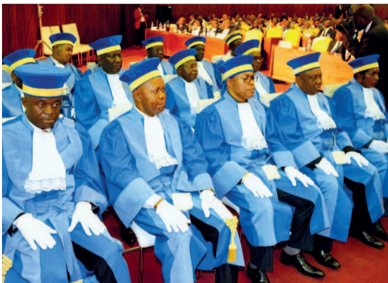
Les membres de la Cour constitutionnelle

La présidence de la République a émis des invitations pour la cérémonie de prestation de serment des trois magistrats nommés récemment à la Cour constitutionnelle. Bien que cette nomination suscite une polémique au sein de la classe