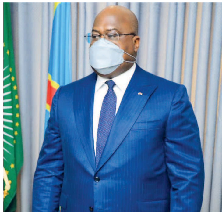
Le président Félix Tshisekedi

Pour l'ONG, l'action ainsi sollicitée du chef de l'Etat vise à sauver la nation en péril « au regard du climat socio-politique tendu en RDC, caractérisé notamment par la montée en puissance de l'insécurité, la cacophonie dans l'animation du pouvoir judiciaire, la précarité financière, etc. » Page 3