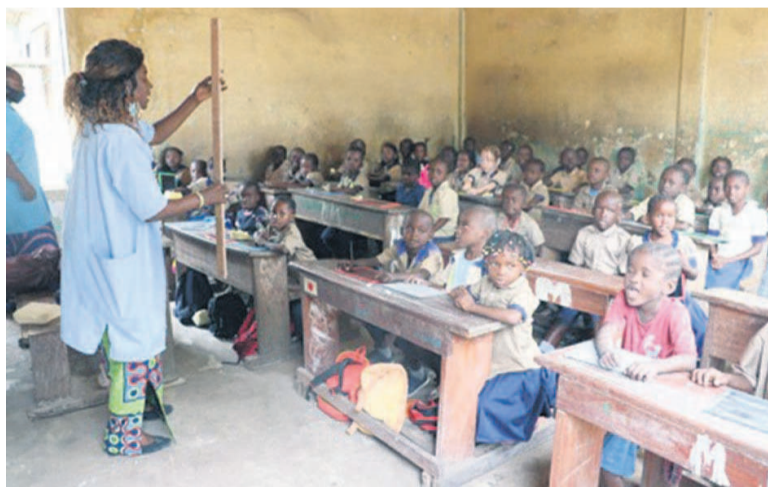
Les élèves au centre de rescolarisation de l'Angola-Libre

Le directeur de cabinet du ministre de l'Enseignement primaire, secondaire et de l'Alphabétisation, Adolphe Mbo Maba, a fait la ronde des établissements en charge de l'éducation non formelle, le 19 octobre à Brazzaville, pour constater l'effectivité de la rentrée péda-gogique.