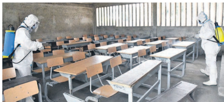
Une des salles de classe désinfectées de l'Etat dans le cadre de la lutte contre cette pandémie », a expliqué la conseillère municipale.

Les conclusions de la onzième réunion de la Coordination de gestion de la pandémie de Covid-19, tenue le 16 octobre à Brazzaville, précisent que la maladie n'est pas encore éradiquée même si les cas ne sont plus aussi nombreux.